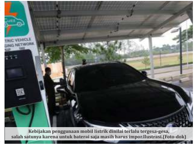
Kebijakan penggunaan mobil listrik dinilai terlalu tergesa-gesa, salah satunya karena untuk baterai saja masih harus impor. Ilustrasi.

Djoko kembali mendesak, alih-alih disalurkan untuk mobil dinas pejabat, pengadaan mobil listrik untuk angkutan umum penumpang tetap harus didorong lebih banyak. "Selain bisa digunakan oleh masyarakat umum, kendaraan umum listrik juga berpotensi untuk menghemat