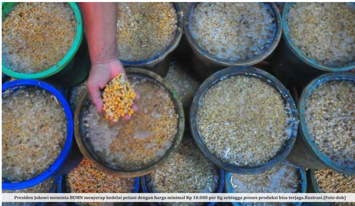
Presiden Jokowi meminta BUMN menyerap kedelai petani dengan harga minimal Rp 10.000 per Kg sehingga proses produksi bisa terjaga. Ilustrasi.

JAKARTA- Kondisi stok pangan diklaim pemerintah aman hingga akhir tahun. Meski demikian, Presiden Joko Widodo (Jokowi) memerintahkan penanaman tambahan jagung, kedelai, cabai, dan bawang. Setelah itu, BUMN juga diperintahkan menyerap semua hasil produksi petani.