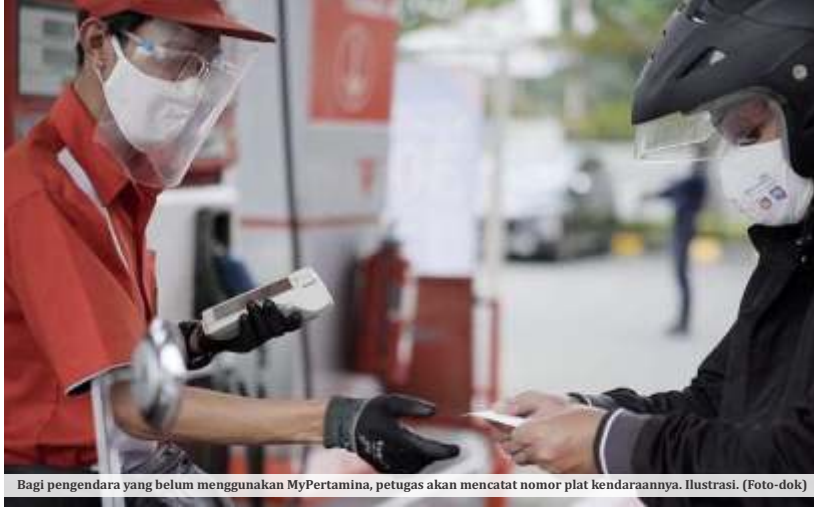
Bagi pengendara yang belum menggunakan MyPertamina, petugas akan mencatat nomor plat kendaraannya. Ilustrasi.

JAKARTA -Di tengah gonjang-ganjing kenaikan harga dan menipisnya stok Bahan Bakar Minyak (BBM), Pemerintah melalui Menteri Badan Usaha Milik Negara (BUMN) Erick Thohir melakukan perubahan susunan Komisaris dan Direksi PT Pertamina (Persero).