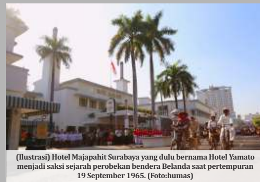
(Ilustrasi) Hotel Majapahit Surabaya yang dulu bernama Hotel Yamato menjadi saksi sejarah perobekan bendera Belanda saat pertempuran 19 September 1945.

berharap, hadirnya Wisata Perjuangan Surabaya nantinya dapat menggelorakan semangat Nasionalisme bagi para generasi muda di Kota Pahlawan. "Karena saya ingin mengingatkan bahwa Kota Surabaya ini punya jiwa Pahlawan yang sangat luar biasa," tandasnya. (mira,rls/dya)