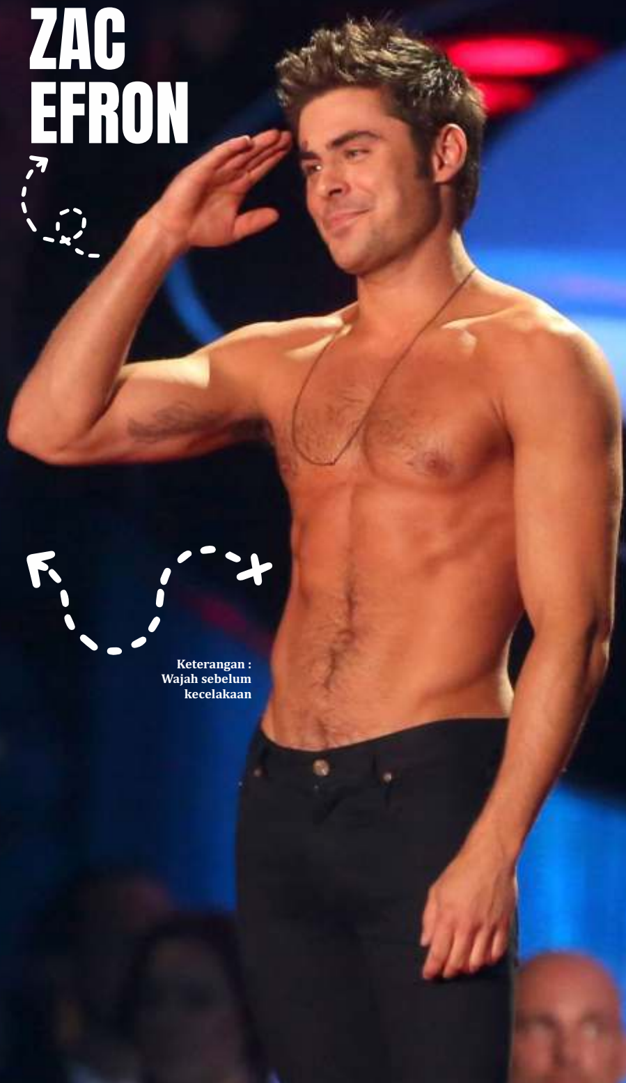
Keterangan : Wajah sebelum kecelakaan