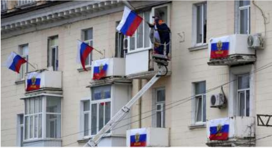
Rusia resmi mencaplok 4 wilayah Ukraina yaitu Donetsk, Luhansk, Kherson dan Zaporizhzhia. Ilustrasi.

MOSKOW -Presiden Rusia Vladimir Putin menandatangani undang-undang integrasi empat wilayah Ukraina. Dokumen yang diterbitkan pemerintah, Rabu (5/10) menerima wilayah Donetsk, Luhansk, Kherson dan Zaporizhzhia ke dalam Federasi Rusia.