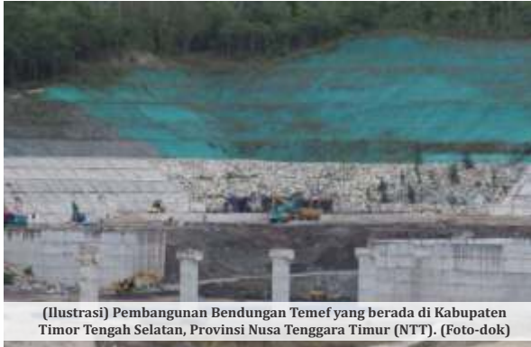
(Ilustrasi) Pembangunan Bendungan Temef yang berada di Kabupaten Timor Tengah Selatan, Provinsi Nusa Tenggara Timur (NTT). (Foto-dok)

JAKARTA- Menteri PUPR Basuki Hadimuljono menegaskan, pemerintah akan berhenti membangun bendungan baru pada 2023 hingga 2024. Ia mengatakan pemerintah akan fokus meningkatkan manfaat 61 bendungan yang terdiri dari 29 bendungan tuntas dibangun dan 32 bendungan yang masih dalam proyek pembangunan hingga 2022.