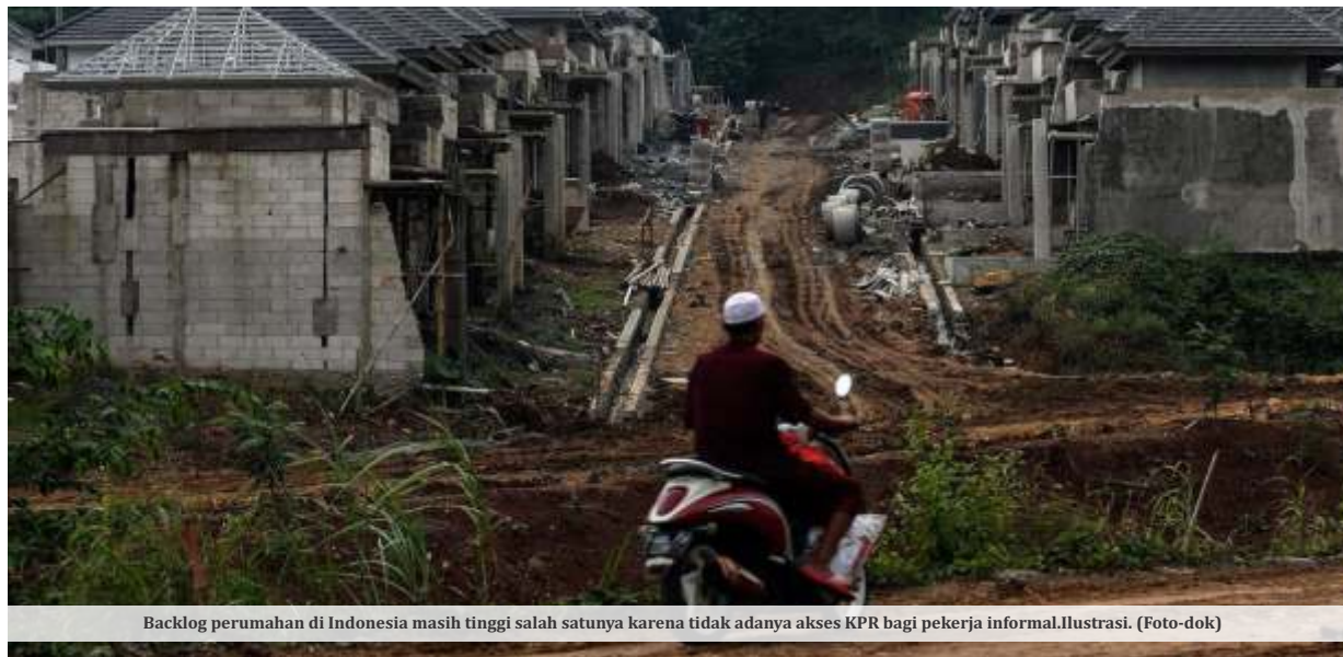
Backlog perumahan di Indonesia masih tinggi salah satunya karena tidak adanya akses KPR bagi pekerja informal. Ilustrasi.

JAKARTA-Indonesia masih dihadapkan pada persoalan tingginya gap antara ketersediaan dan kebutuhan (backlog) perumahan. Bahkan, diproyeksikan terus meningkat imbas kenaikan suku bunga acuan. Lebih ironis lagi, sekitar 60 persen dari total angkatan kerja Indonesia adalah pekerja informal yang tak mendapatkan akses Kredit Pemilikan Rumah (KPR) subsidi.