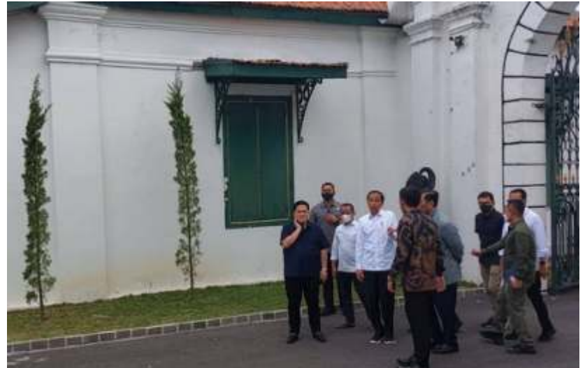
Presiden Joko Widodo bersama KGPAA Mangkunegara X dan sejumlah menteri di Pura Mangkunegaran Minggu (16/10/2022).

Percepatan revitalisasi ini juga berjalan beriringan dengan revitalisasi koridor Jalan Gatot Subroto (Gatsu) sampai Ngarsoपुरo, yang akan dijadikan street art Kota Solo. "Koridor itu kan kami kebut juga. Kan nanti apa semuanya akan berpusat di sini (Mangkunegaran) gitu jadi memang harus sinergi semua," jelasnya.