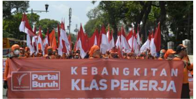
(Ilustrasi) Partai Buruh menjadi salah satu parpol baru yang lolos verifikasi administrasi KPU untuk menjadi calon peserta Pemilu 2024. (Foto-dok)

Ketua Umum DPP Parsindo Jusuf Rizal mengatakan, penyebab tidak lolosnya Partai Parsindo karena KPU RI menganggap pihaknya memasukkan data perbaikan administrasi tanggal 28 September