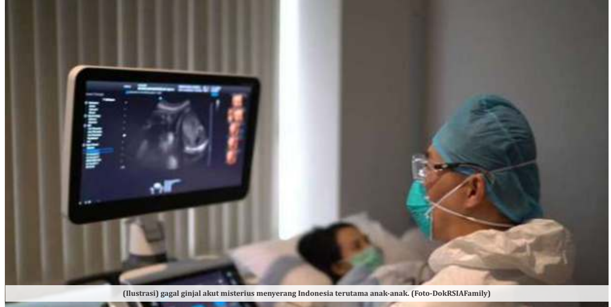
(Ilustrasi) gagal ginjal akut misterius menyerang Indonesia terutama anak-anak.

terjadi kekurangan cairan yang masuk ke ginjal, itu akan menyebabkan AKI. Ada lagi infeksi yang berat, umumnya terjadi di rumah sakit, dalam perjalanannya, dia bisa mengalami AKI.