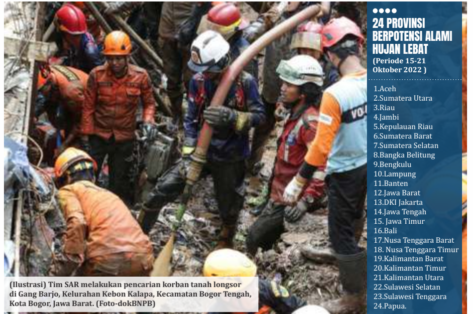
(Ilustrasi) Tim SAR melakukan pencarian korban tanah longsor di Gang Barjo, Kelurahan Kebon Kalapa, Kecamatan Bogor Tengah, Kota Bogor, Jawa Barat.

Perhitungan skenario terburuk tersebut, lanjut Dwikorita menjadi pijakan untuk mempersiapkan langkah-langkah mitigasi. Sehingga, andai kata terjadi gempa bumi dan tsunami sewaktu-waktu, diharapkan