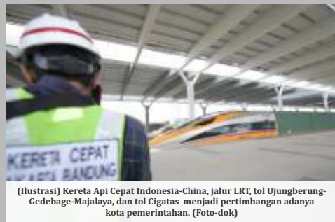
(Ilustrasi) Kereta Api Cepat Indonesia-China, jalur LRT, tol Ujungberung-Gedebage-Majalaya, dan tol Cigatas menjadi pertimbangan adanya kota pemerintahan.

BANDUNG - Gubernur Jawa Barat (Jabar) Ridwan Kamil (RK) menegaskan Ibu Kota Jabar tetap di Bandung dan menepis isu pemindahan Ibu Kota Jabar ke Tegalluar, Bojongsong, Kabupaten Bandung.