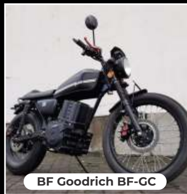
BF Goodrich BF-GC