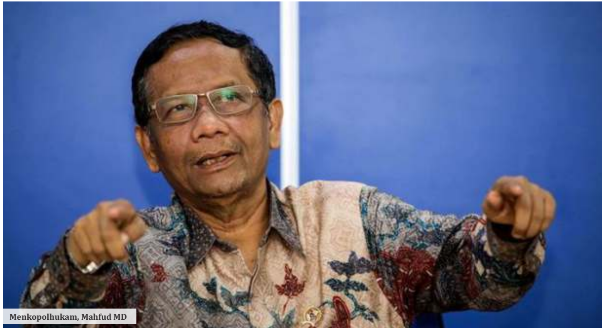
Menkopolhukam, Mahfud MD

JAKARTA - DPR RI menolak usulan RUU Pembatasan Transaksi Uang Kartal oleh pemerintah. Menteri Koordinator bidang Politik, Hukum, dan Keamanan (Menko Polhukam) Mahfud MD pun mengungkapkan salah satu alasannya, menurut para anggota dewan politik tidak bisa tanpa bawa uang tunai.