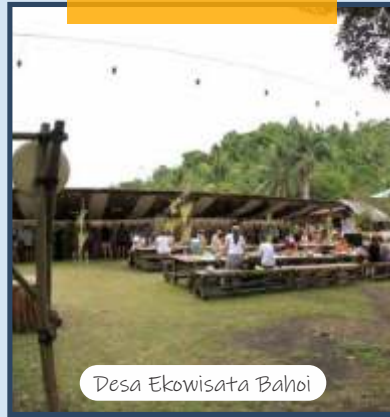
Desa Ekowisata Bahoi