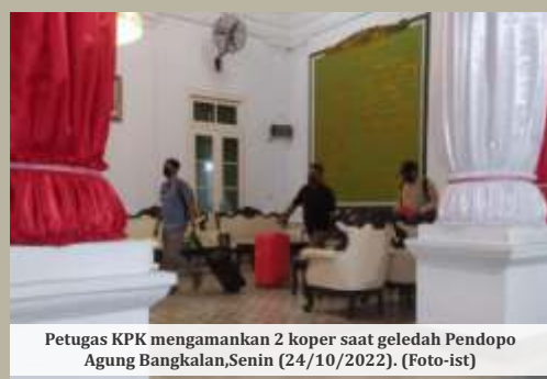
Petugas KPK mengamankan 2 koper saat geledah Pendopo Agung Bangkalan, Senin (24/10/2022).

BANGKALAN - Tepat saat Hari Ulang Tahun ke-491 Kabupaten Bangkalan, Komisi Pemberantasan Korupsi (KPK) menggeledah kantor Pemerintah Kabupaten (Pemkab) Bangkalan, Jawa Timur, Senin (24/10). Tim penyidik menyoroti ruang kerja bupati, wakil bupati dan sekretaris daerah (Sekda), dan asisten bupati Bangkalan. Dikabarkan, sudah ada pihak yang ditetapkan sebagai tersangka dalam