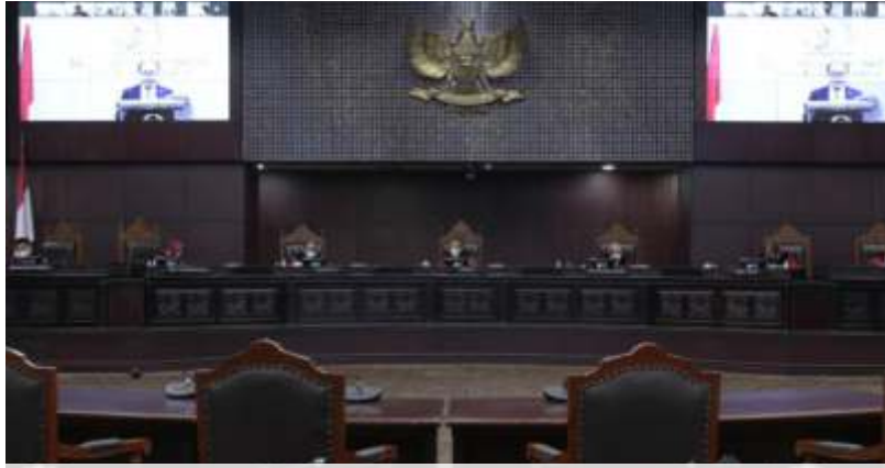
MK menggelar sidang lanjutan pengujian Undang-Undang Nomor 1 Tahun 1946 tentang Kitab Undang-Undang Hukum Pidana dengan agenda mendengarkan keterangan dari DPR secara daring, Senin (24/10/2022).

JAKARTA- Di dalam Rancangan Undang-Undang Kitab Undang-Undang Hukum Pidana (RUU KUHP) dikabarkan terdapat peningkatan waktu masa daluwarsa (kedaluwarsa) kasus dari yang semula 18 tahun menjadi 20 tahun. Hal itu terungkap saat Mahkamah Konstitusi (MK) menggelar sidang lanjutan pengujian Undang-Undang Nomor 1 Tahun 1946 tentang Kitab Undang-Undang Hukum Pidana dengan agenda mendengarkan keterangan dari DPR secara daring, Senin (24/10/2022).