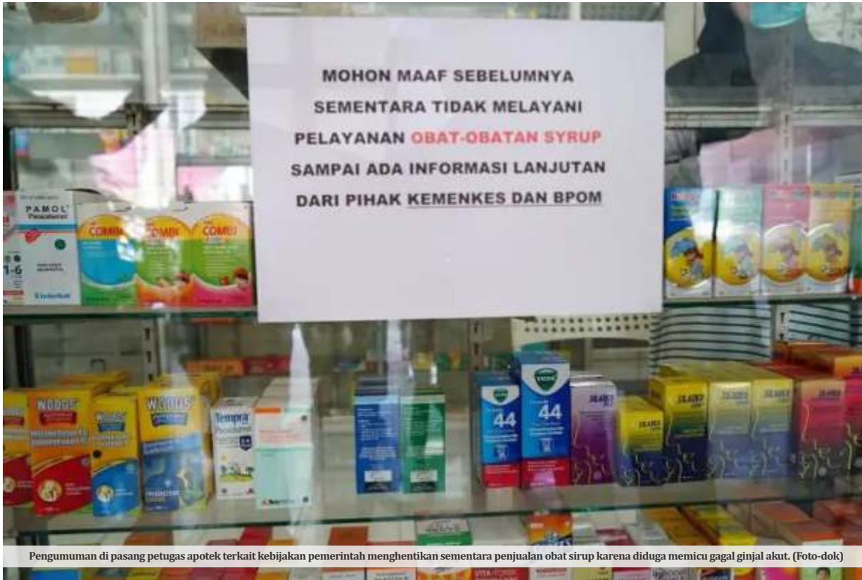
Pengumuman di pasang petugas apotek terkait kebijakan pemerintah menghentikan sementara penjualan obat sirup karena diduga memicu gagal ginjal akut.

JAKARTA - Presiden Jokowi memanggil Kepala BPOM Penny Lukito dan Menkes Budi Gunadi Sadikin terkait kasus ginjal misterius pada anak. Usai ratas, Penny memberikan keterangan kepada wartawan. Ia menyebut ada 2 industri farmasi yang kini sedang diproses untuk dipidana.