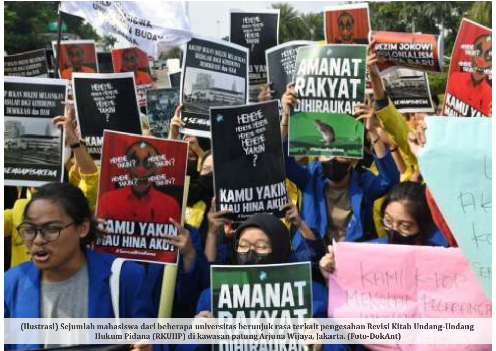
(Ilustrasi) Sejumlah mahasiswa dari beberapa universitas berunjuk rasa terkait pengesahan Revisi Kitab Undang-Undang Hukum Pidana (RKUHP) di kawasan patung Arjuna Wijaya, Jakarta.

Pemerintah dan DPR sepakat tidak mengkriminalisasi perbuatan lesbian, gay, biseksual, dan transgender (LGBT). Dalam draf sebanyak 624 pasal itu, tidak ada pasal yang