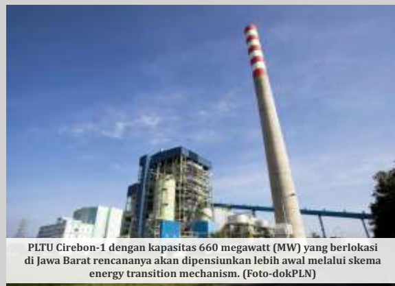
PLTU Cirebon-1 dengan kapasitas 660 megawatt (MW) yang berlokasi di Jawa Barat rencananya akan dipensiunkan lebih awal melalui skema energy transition mechanism.

Selain itu, PLTU Tanjung Jati B Unit 1-4 di Jepara, Jawa Tengah, juga dikabarkan akan dipensiunkan setelah perusahaan raksasa asal Jepang, Sumitomo Corporation, resmi melepas secara dini seluruh aset PLTU