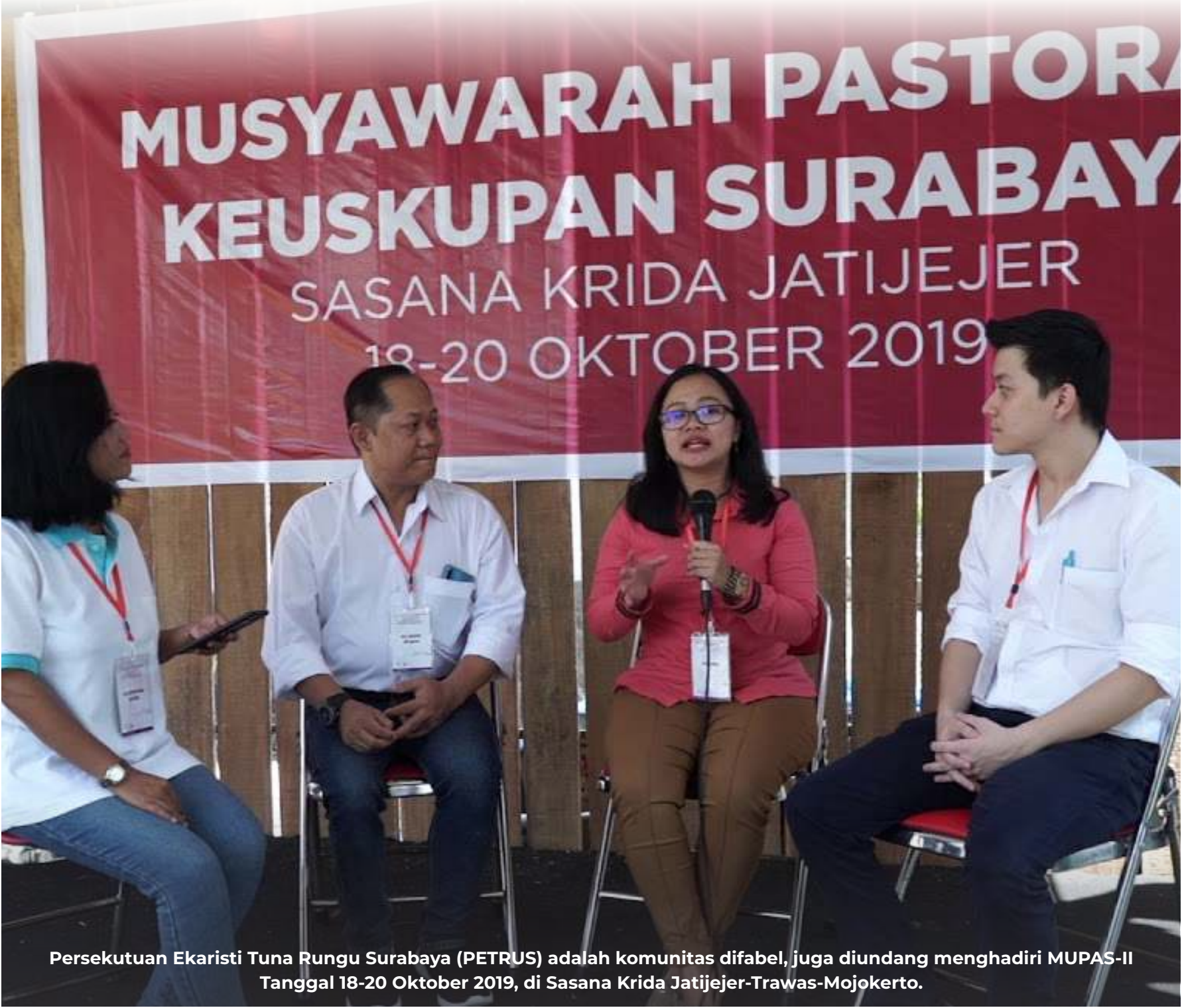
Persekutuan Ekaristi Tuna Rungu Surabaya (PETRUS) adalah komunitas difabel, juga diundang menghadiri MUPAS-II Tanggal 18-20 Oktober 2019, di Sasana Krida Jatijejer-Trawas-Mojokerto.

13,78 atau paling rendah di antara 142 negara yang termasuk dalam daftar. Angka itu juga berbanding lurus dengan indeks keamanan Qatar yang menunjukkan angka 86,22 atau yang terbaik di antara negara-negara lainnya. (Berbagai Sumber)