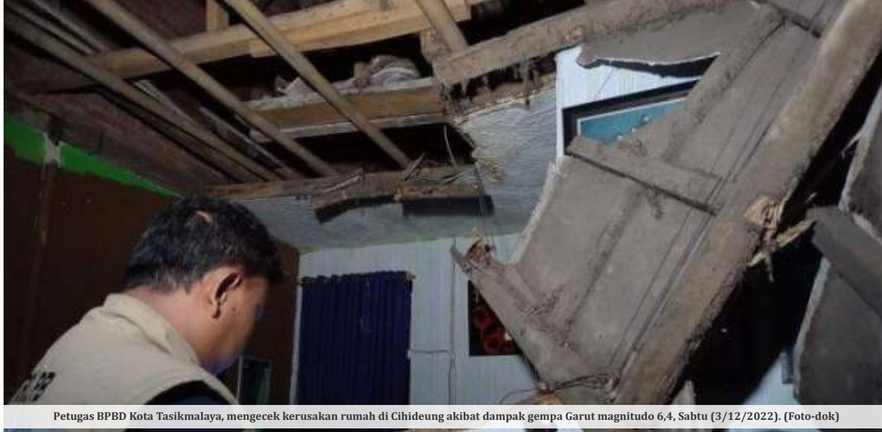
Petugas BPBD Kota Tasikmalaya, mengecek kerusakan rumah di Cihideung akibat dampak gempa Garut magnitudo 6,4, Sabtu (3/12/2022).

JAKARTA - Badan Meteorologi Klimatologi dan Geofisika (BMKG) mencatat sejumlah fenomena gempa yang mengguncang 4 wilayah di Indonesia pada Minggu (4/12). Hingga Pukul 19.16 WIB sedikitnya ada 22 wilayah yang terguncang gempa bumi.