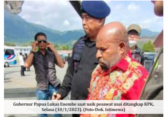
Gubernur Papua Lukas Enembe saat naik pesawat usai ditangkap KPK, Selasa (10/1/2023). (Foto-Dok. Istimewa)

pemberitahuan, seakan-akan seperti diculik, kami pengacara juga tidak tahu," katanya.