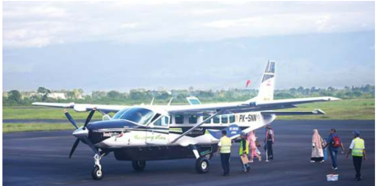
Pesawat dari Susi Air yang digunakan untuk penerbangan Jember-Sumenep.

Kemudian dari Bandara Notohadinegoro dengan rute Jember-Sumenep berangkat pada pukul 12.54 WIB dan diprediksi tiba di Bandara Trunojoyo pada pukul 13.34 WIB