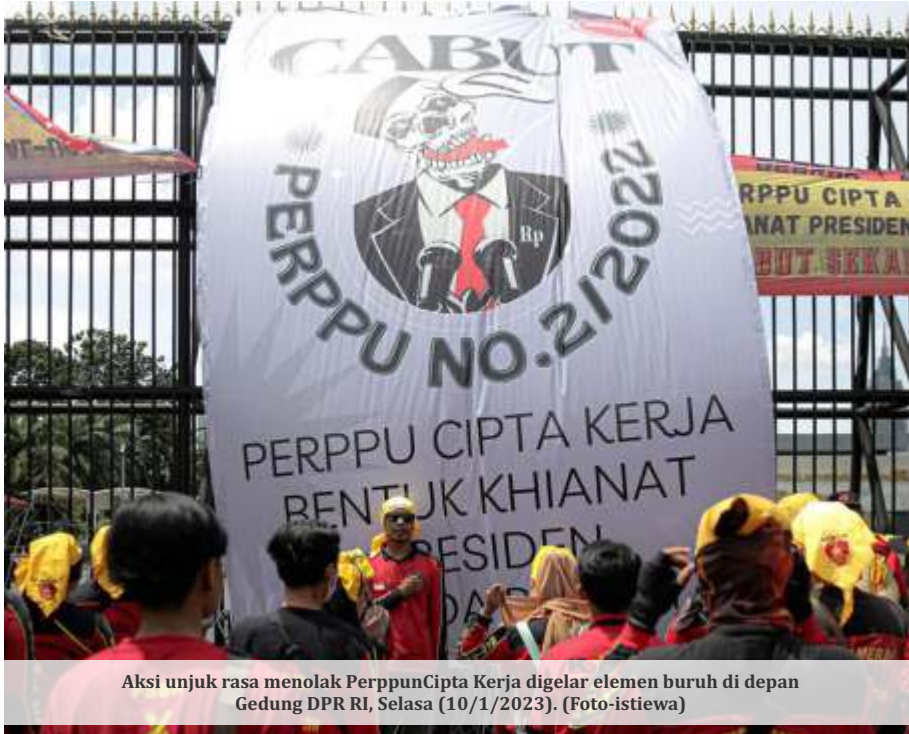
Aksi unjuk rasa menolak Perppu Cipta Kerja digelar elemen buruh di depan Gedung DPR RI, Selasa (10/1/2023).

JAKARTA - Dewan Perwakilan Rakyat (DPR) telah menerima surat dari pemerintah terkait dengan dua Peraturan Pemerintah Pengganti Undang-undang (Perppu). Yakni Perppu tentang Pemilu dan Perppu tentang Cipta Kerja.