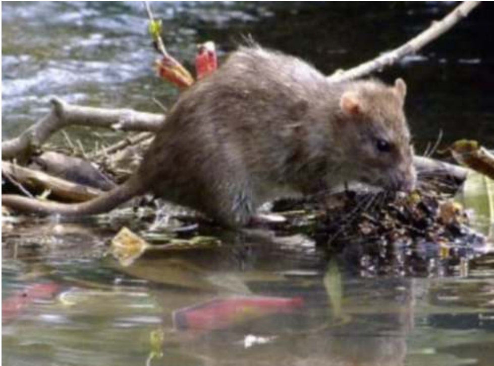
(Ilustrasi) Wabah Leptospirosis ditularkan oleh binatang ternak berkaki empat dan berasal dari kencing tikus

TULUNGAGUNG - Sedikitnya tiga orang meninggal dan tiga lainnya sembuh dengan pengawasan ketat akibat wabah leptospirosis yang menjangkit di sejumlah wilayah di Kabupaten Tulungagung, Jawa Timur selama dua bulan terakhir.