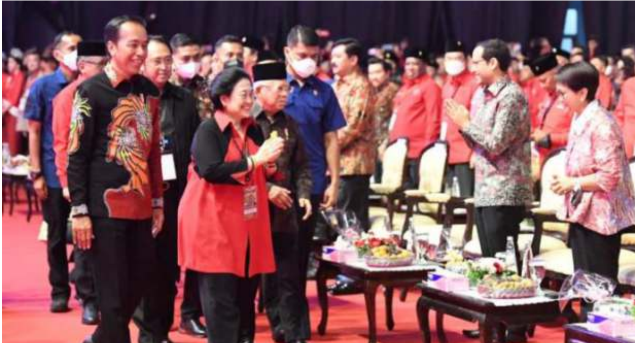
Ketua Umum PDI Perjuangan (PDIP) Megawati Soekarnoputri tersenyum sumringah saat menyapa para kader bersama Presiden Joko Widodo (Jokowi) dan Wakil Presiden Ma'ruf Amin dalam peringatan Hari Ulang Tahun (HUT) ke-50 PDI Perjuangan di JiExpo Kemayoran, Jakarta Pusat pada Selasa (10/1/2023).

JAKARTA -Tak ada kejutan sosok calon presiden (capres) yang diumumkan Ketua Umum (Ketum) Megawati Soekarnoputri di gebyar HUT ke-50 PDIP hari ini. Namun dipastikan calon presiden yang bakal diusung PDIP untuk Pilpres 2024 berasal dari kader partai.