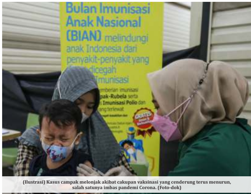
(Ilustrasi) Kasus campak melonjak akibat cakupan vaksinasi yang cenderung terus menurun, salah satunya imbas pandemi Corona.

JAKARTA -Para ahli telah memperingatkan bahwa campak sangat mudah menular dari orang ke orang. Individu yang rentan terpapar virus campak memiliki peluang 90 persen untuk terinfeksi. Selain itu, orang yang terinfeksi dapat menyebarkan virus ke mana saja antara 9 hingga 18 orang yang rentan.