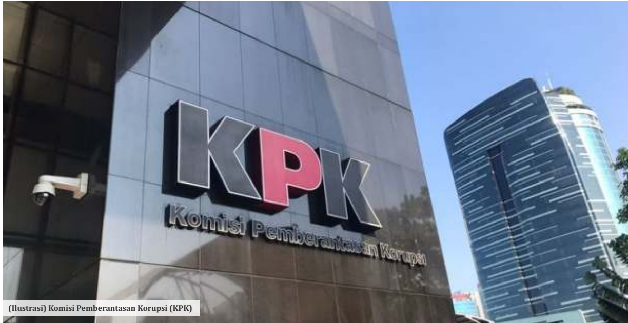
(Ilustrasi) Komisi Pemberantasan Korupsi (KPK)