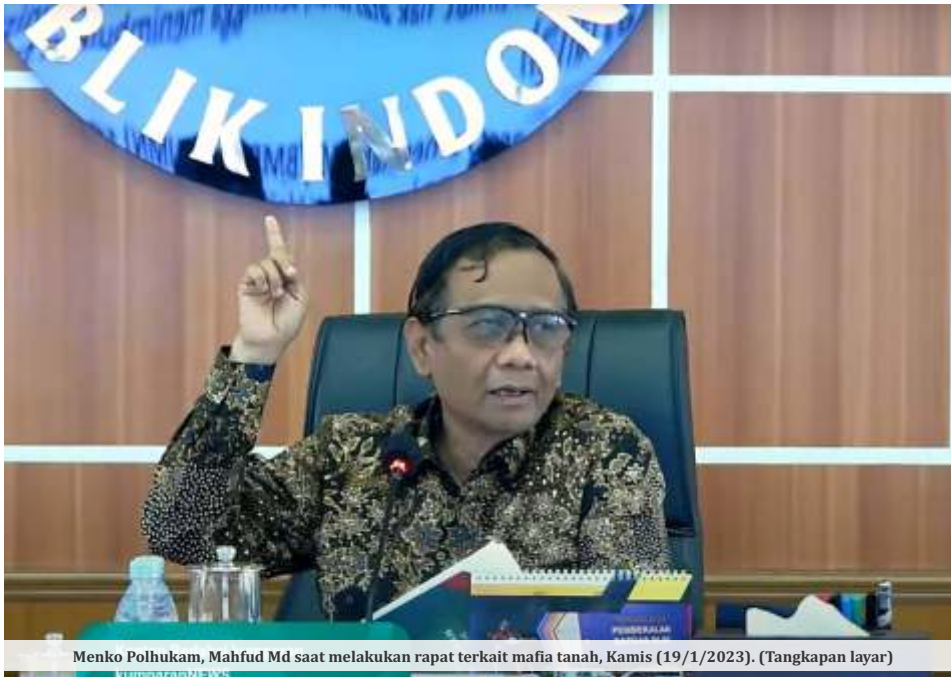
Menko Polhukam, Mahfud Md saat melakukan rapat terkait mafia tanah, Kamis (19/1/2023).

JAKARTA - Menko Polhukam, Mahfud MD menyebut masalah mafia tanah terkadang melibatkan 'orang gede'. Hal ini disampaikan saat menggelar rapat kasus-kasus mafia tanah bersama sejumlah tokoh dan pejabat negara, antara lain Eros Djarot, Denny Indrayana, Anwar Abbas, pejabat Kejagung hingga Kabareskrim Polri Komjen Agus Andrianto di Kantor Kemenko Polhukam di Jakarta, Kamis (19/1/2023).