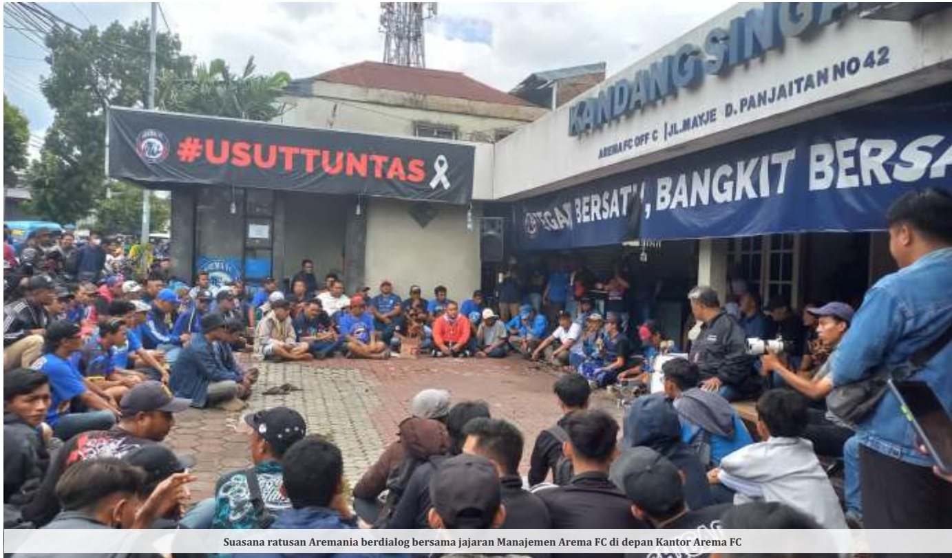
Suasana ratusan Aremania berdialog bersama jajaran Manajemen Arema FC di depan Kantor Arema FC

MALANG - Ratusan Aremania dan jajaran manajemen Arema FC sepakat klub kebanggaan warga Malang ini tetap eksis. Hal ini menepis wacana dari manajemen Arema FC untuk membubarkan tim berjuluk singo edan ini.