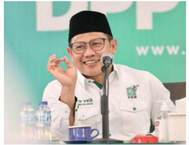
Ketua Umum Partai Kebangkitan Bangsa (PKB) Muhaimin Iskandar