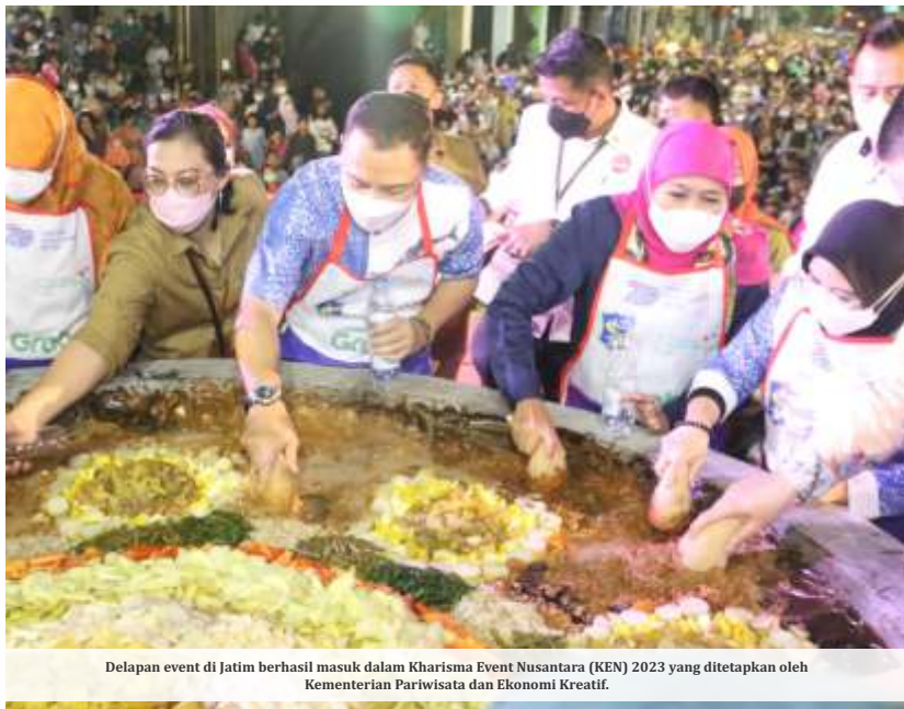
Delapan event di Jatim berhasil masuk dalam Kharisma Event Nusantara (KEN) 2023 yang ditetapkan oleh Kementerian Pariwisata dan Ekonomi Kreatif.

SURABAYA - Gubernur Jawa Timur (Jatim) Khofifah Indar Parawansa meyakini jumlah wisatawan domestik dan luar negeri ke Jawa Timur bakal membludak di tengah isu resesi global. Apalagi, baru-baru ini ada delapan event Jawa Timur yang berhasil masuk dalam Kharisma Event Nusantara (KEN) 2023 yang ditetapkan oleh Kementerian Pariwisata dan Ekonomi Kreatif.