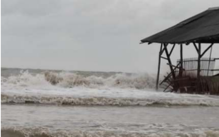
(Ilustrasi) - Potensi terjadi gelombang tinggi akibat bencana hidrometeorologi yang diprediksi hingga Maret 2023

SURABAYA - Gubernur Jawa Timur (Jatim) Khofifah Indar Parawansa mengimbau masyarakat untuk meningkatkan kewaspadaan terhadap potensi bencana hidrometeorologi yang mengancam seluruh wilayah Jatim. Imbauan tersebut merujuk pada prediksi BMKG Juanda yang menyebut adanya potensi peningkatan cuaca ekstrem di Jatim pada 27 Januari hingga 2 Februari 2023.