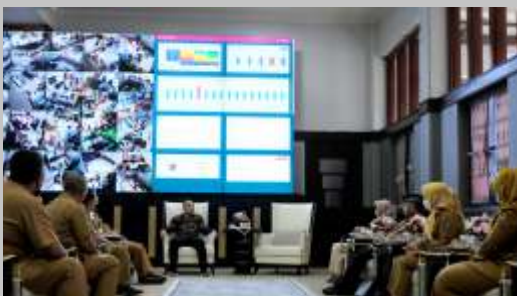
Wali Kota Surabaya Eri Cahyadi saat pertemuan bersama guru SD-SMP negeri dan swasta, di ruang kerja Kantor Balai Kota, Senin (6/2/2023).

SURABAYA - Wali Kota Surabaya Eri Cahyadi menggelar pertemuan bersama guru SD-SMP negeri dan swasta, di ruang kerja Kantor Balai Kota, Senin (6/2/2023). Dalam kesempatan itu, ia memberikan pengarahan melalui zoom kepada para guru, untuk bersikap adil kepada muridnya. Selain itu ditegaskannya, agar semua menghindari pungutan liar (Pungli)