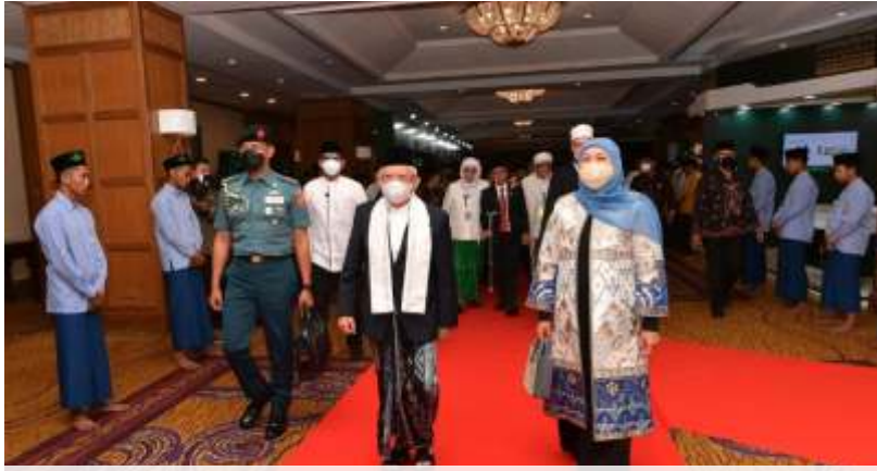
Wakil Presiden, Ma'ruf Amin, bersama Gubernur Jawa Timur, Khofifah Indar Parawansa, setelah Mukhtamar Internasional Fikih Peradaban 1 di Hotel Shangri La, Surabaya, Senin (6/2/2023).

SURABAYA - Wakil Presiden RI, Ma'ruf Amin, mengartikan Persatuan Bangsa Bangsa (PBB) memberikan kesetaraan antar anggota. Dengan demikian akan mampu bentuk hubungan antar bangsa yang penuh perdamaian dan keharmonisan.