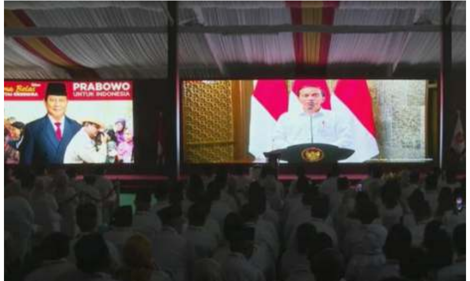
Tangkapan layar Youtube Gerindra TV saat menayangkan video ucapan Jokowi di HUT Gerindra, Senin (6-2-2023).

"Saya jenderal, saya ikut berkali-kali dalam aksi-aksi pertempuran. Saya melihat pemimpin yang bisa ambil keputusan dan pemimpin yang tidak bisa ambil keputusan. Beliau (Jokowi) adalah pemimpin yang bisa ambil keputusan dan keputusannya berani, kadang-kadang melawan tekanan dari mana-mana," ucap Prabowo. "Ini harus kita akui dan saya