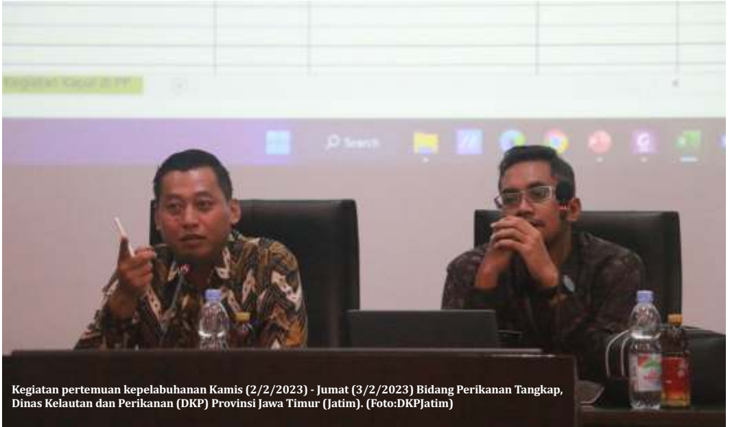
Kegiatan pertemuan kepelabuhanan Kamis (2/2/2023) - Jumat (3/2/2023) Bidang Perikanan Tangkap, Dinas Kelautan dan Perikanan (DKP) Provinsi Jawa Timur (Jatim).

SURABAYA -Dinas Kelautan dan Perikanan (DKP) Provinsi Jawa Timur (Jatim) melalui Bidang Perikanan Tangkap menggelar pertemuan kepelabuhanan pada Kamis (2/2/2023) hingga Jumat (3/2/2023) bertempat di ruang pertemuan DKP Provinsi Jatim. Pertemuan ini dihadiri oleh Kepala Bidang Perikanan Tangkap, Kepala Unit Pelaksana Teknis Pelabuhan Perikanan Pantai (UPT PPP) serta Koordinator Instalasi Pelabuhan Perikanan Pantai (IPPP) lingkup DKP Provinsi Jatim.