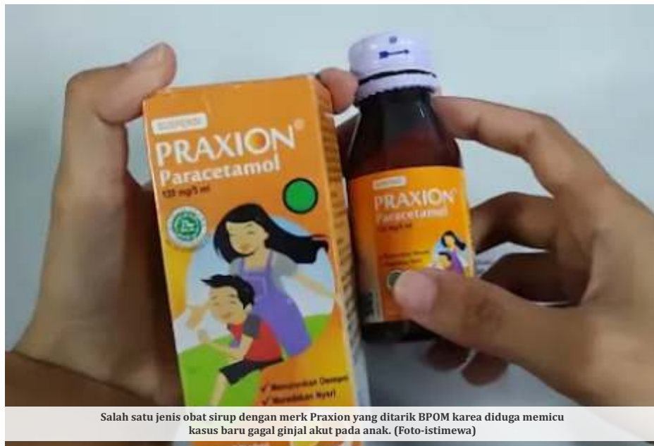
Salah satu jenis obat sirup dengan merk Praxion yang ditarik BPOM karena diduga memicu kasus baru gagal ginjal akut pada anak.

Kemenkes sejak awal menyatakan bahwa kasus gagal ginjal akut yang