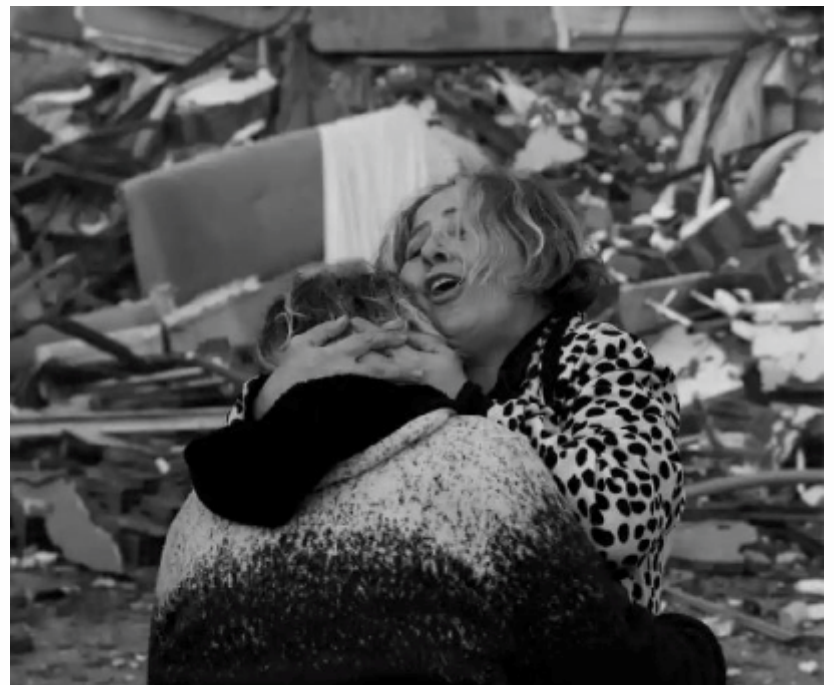
Warga saling berpelukan mengungkapkan kepedihan melihat huniannya hancur di Hatay, Turkiye, Selasa (7/2/2023) akibat gempa bumi yang terjadi Senin (6/2/2023).

Sedikitnya 20.000 orang dikabarkan tewas dan puluhan ribu lainnya luka-luka di 10 provinsi di Turkiye akibat dua gempa besar yang mengguncang wilayah selatan negara itu, Senin (6/2/2023). Pada Senin pagi, gempa berkekuatan magnitudo 7,7 melanda distrik Pazarcik di provinsi Kahramanmaraş dan mengguncang hebat sejumlah provinsi lain, termasuk Gaziantep, Sanliurfa, Diyarbakir, Adana, Adiyaman, Malatya, Ormaniye, Hatay dan Kilis. Kemudian pada pukul 13.24 waktu setempat (17.24 WIB) gempa berkekuatan magnitudo 7,6 berpusat di distrik Elbistan Kahramanmaraş mengguncang wilayah itu. (reuter,afp,anadolu,wid/dya)