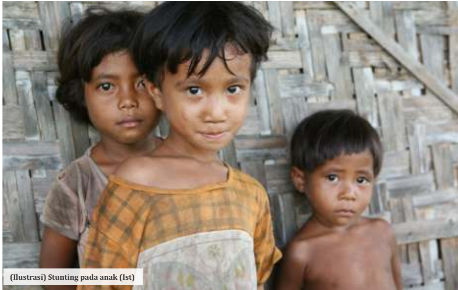
(Ilustrasi) Stunting pada anak (Ist)

JEMBER - Kabupaten Jember menduduki kasus tertinggi angka penderita stunting di Jawa Timur. Pemkab Jember sendiri mengungkap sejumlah penyebab tingginya stunting. Mulai dari angka pernikahan dini, hingga budaya memberi asupan makanan pada bayi dianggap menjadi salah satu faktor penyebab kasus stunting.