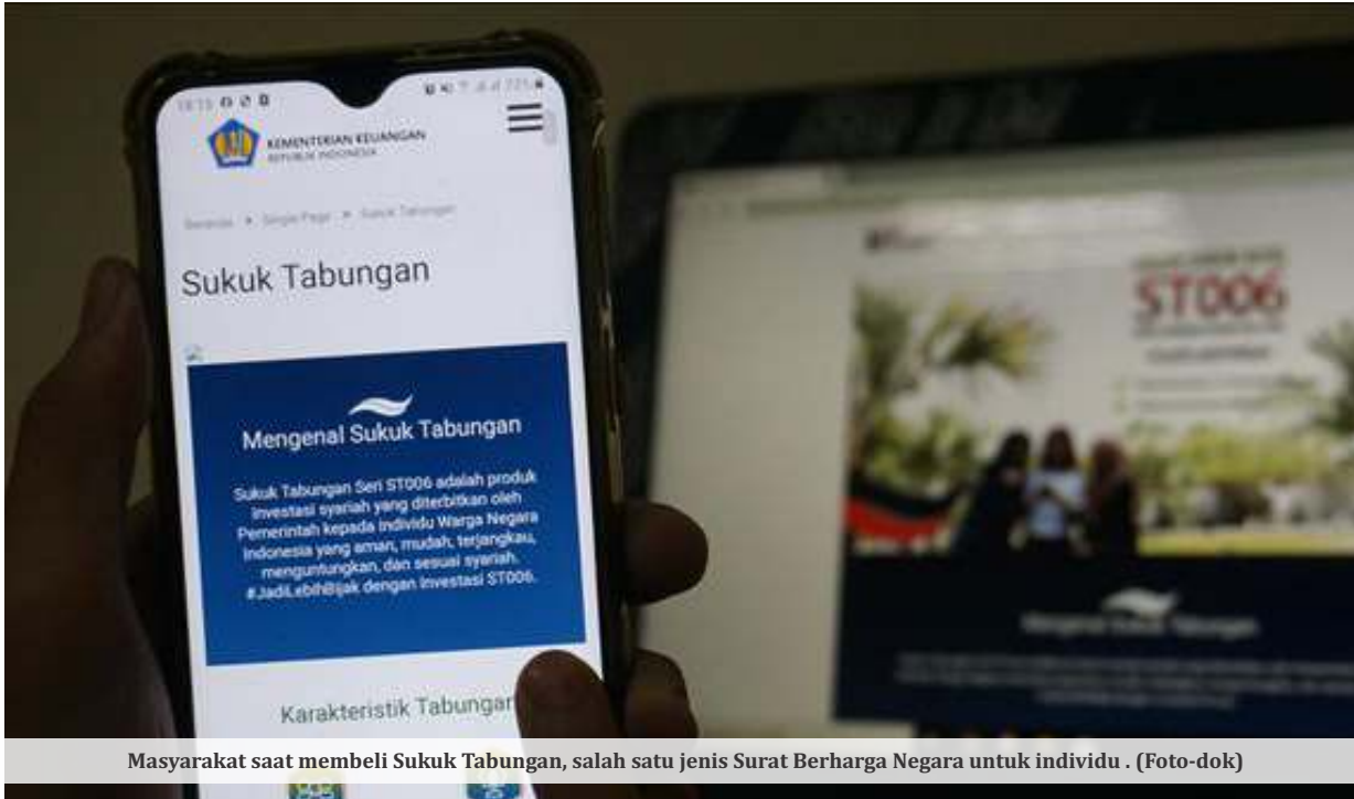
Masyarakat saat membeli Sukuk Tabungan, salah satu jenis Surat Berharga Negara untuk individu.

JAKARTA - Pemerintah menargetkan pembiayaan utang tahun ini sebesar Rp 696,4 triliun. Kebutuhan penarikan utang itu diperlukan untuk menutupi defisit APBN di 2023. Para wakil rakyat mengingatkan berdasarkan Undang-Undang, pinjaman yang membebani keuangan negara harus melalui persetujuan DPR RI.