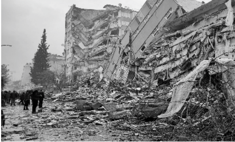
Warga melihat huniannya hancir Selasa (7/2/2023) yang roboh akibat gempa bumi yang terjadi Senin (6-2-2023).

ANKARA - Hingga Selasa (7/2/2023) terdapat sebanyak 104 warga negara Indonesia (WNI) sudah tidak memiliki tempat tinggal yang layak akibat gempa Turkiye. Mereka akan segera dievakuasi ke Ankara.