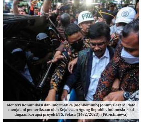
Menteri Komunikasi dan Informatika (Menkominfo) Johnny Gerard Plate menjalani pemeriksaan oleh Kejaksaan Agung Republik Indonesia soal dugaan korupsi proyek BTS, Selasa (14/2/2023).

Johnny Plate se usai pemeriksaan mengatakan telah menjawab setiap pertanyaan penyidik mengenai kasus ini. Dia mengatakan menjawab