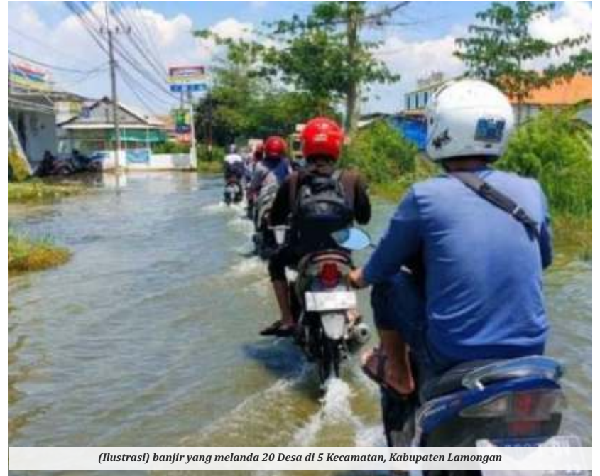
(Ilustrasi) banjir yang melanda 20 Desa di 5 Kecamatan, Kabupaten Lamongan