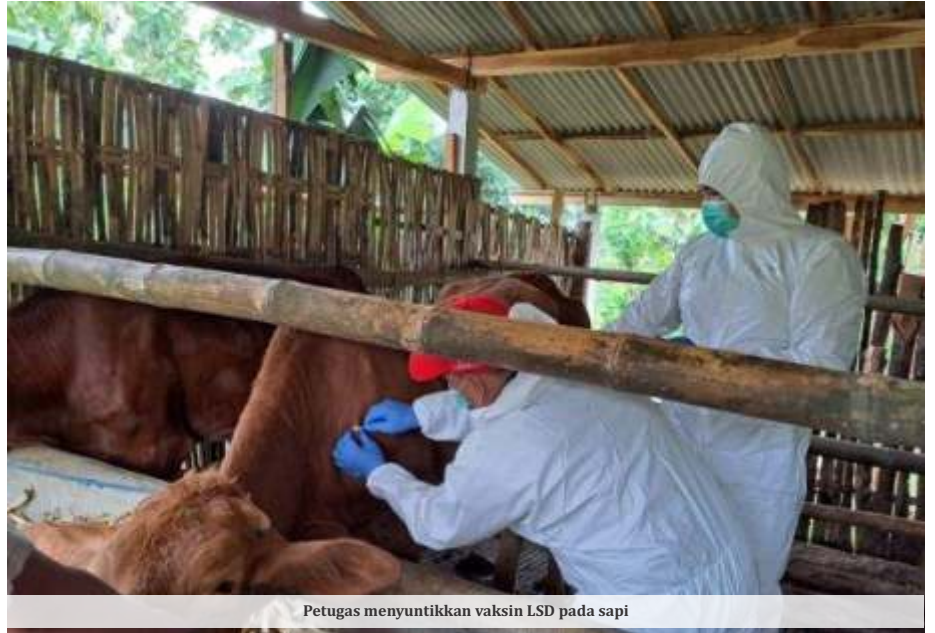
Petugas menyuntikkan vaksin LSD pada sapi