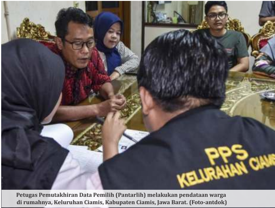
Petugas Pemutakhiran Data Pemilih (Pantarlih) melakukan pendataan warga di rumahnya, Kelurahan Ciamis, Kabupaten Ciamis, Jawa Barat.

JAKARTA - Usai mereda setelah mayoritas partai politik (parpol) di parlemen menyatakan menolak memakai sistem tertutup, 'putaran kedua' kedua terjadi. Hal ini disulut pernyataan Anggota Komisi III DPR Benny K. Harman yang mengaku mendengar kabar bila Pemilu 2024 diputuskan coblos gambar partai.