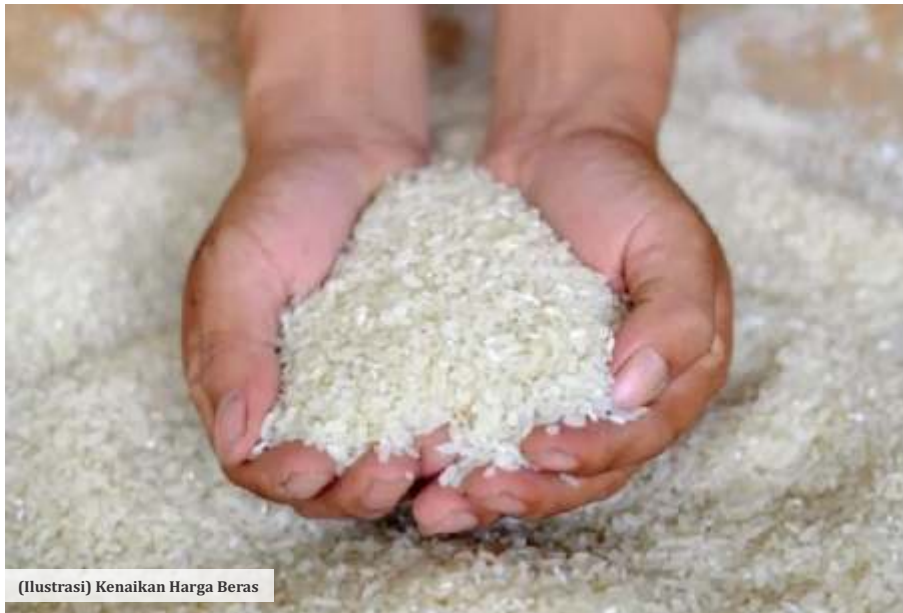
(Ilustrasi) Kenaikan Harga Beras

"Sedangkan yang kita distribusikan ini kemasan 5 kg. Kalau banyak repacker lagi kita bisa lebih banyak lagi mendistribusikan ke konsumen dan pedagang," imbuhnya.