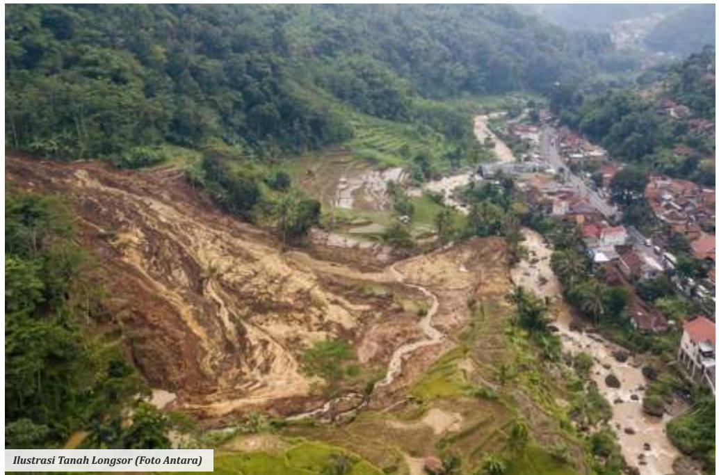
Ilustrasi Tanah Longsor

Sementara itu, Gatot Soebroto Kepala Pelaksana (Kalaksa) BPBD Jawa Timur (Jatim) mengingatkan masyarakat yang tinggal di wilayah langganan banjir dan wilayah berpotensi mengalami bencana