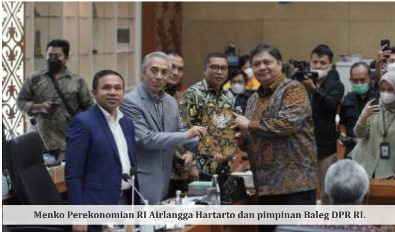
Menko Perekonomian RI Airlangga Hartarto dan pimpinan Baleg DPR RI.

JAKARTA - DPR RI telah menyetujui Rancangan Undang-Undang tentang Penetapan Peraturan Pemerintah Pengganti Undang-Undang (Perpu) Nomor 2 Tahun 2022 tentang Cipta Kerja atau yang dikenal sebagai Cipta Kerja (Ciptaker) untuk dilanjutkan ke pembicaraan tingkat II alias dibawa ke rapat paripurna. Keputusan ini ditekan dalam rapat badan legislasi (baleg) DPR dan DPD RI bersama pemerintah yang digelar Rabu (15/2/2023).