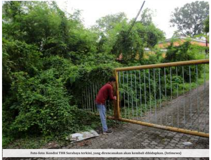
Foto-foto: Kondisi THR Surabaya terkini, yang direncanakan akan kembali dihidupkan. (Istimewa)

kebudayaan yang di dalamnya terdapat seni tradisional, pertunjukan hingga teknologi tradisional. Saya pikir ke depan THR bisa menjadi tempat penghasil Pendapatan Asli Daerah Surabaya yang cukup besar," tutur