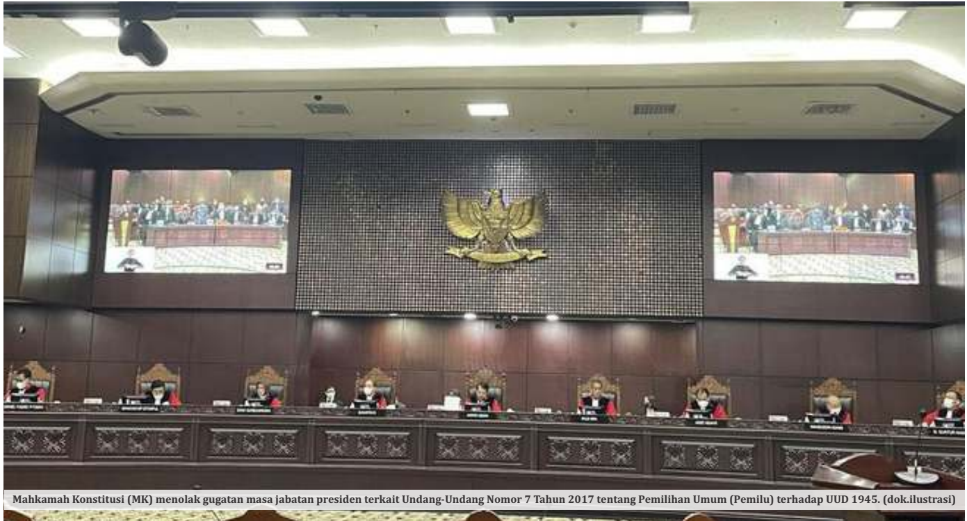
Mahkamah Konstitusi (MK) menolak gugatan masa jabatan presiden terkait Undang-Undang Nomor 7 Tahun 2017 tentang Pemilihan Umum (Pemilu) terhadap UUD 1945. (dok.ilustrasi)

Sebelumnya, 2 pasal yang sama juga digugat ke MK oleh Ketua Umum Partai Berkarya, Muchdi Purwoprandjono, dalam perkara nomor 117/PUU-XX/2022 pada November 2022. Dalam amar putusannya, majelis hakim MK menolak permohonan Muchdi untuk seluruhnya. (wid,rls,ant/dya)