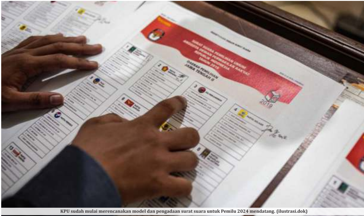
KPU sudah mulai merencanakan model dan pengadaan surat suara untuk Pemilu 2024 mendatang. (ilustrasi.dok)

JAKARTA - Mahkamah Konstitusi (MK) memutuskan mantan terpidana dapat mencalonkan diri sebagai calon anggota DPD setelah jeda 5 tahun usai menjalani masa pidana. KPU RI akan merevisi Peraturan KPU (PKPU) Nomor 10 Tahun 2022.