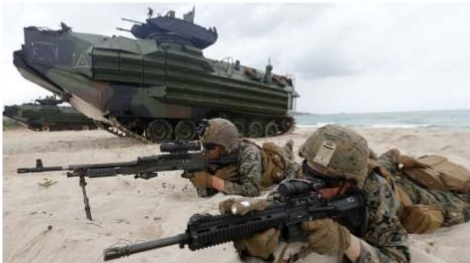
Thailand dan Amerika Serikat memulai latihan militer pada hari Selasa (28/2/2023) yang melibatkan lebih dari 7.000 personel dan pasukan dari 30 negara.

Meski tidak memiliki pasukan militer atau tentara, sebagai gantinya Jepang memiliki Pasukan Bela Diri (Japan Self-Defense Force/SDF) yang dibentuk pada 1954. SDF terbagi ke dalam tiga pasukan, yakni Pasukan Bela Diri Barat (GSDF), Pasukan Bela Diri Maritim (MSDF), dan Pasukan Bela Diri Udara (ASDF). Tujuan