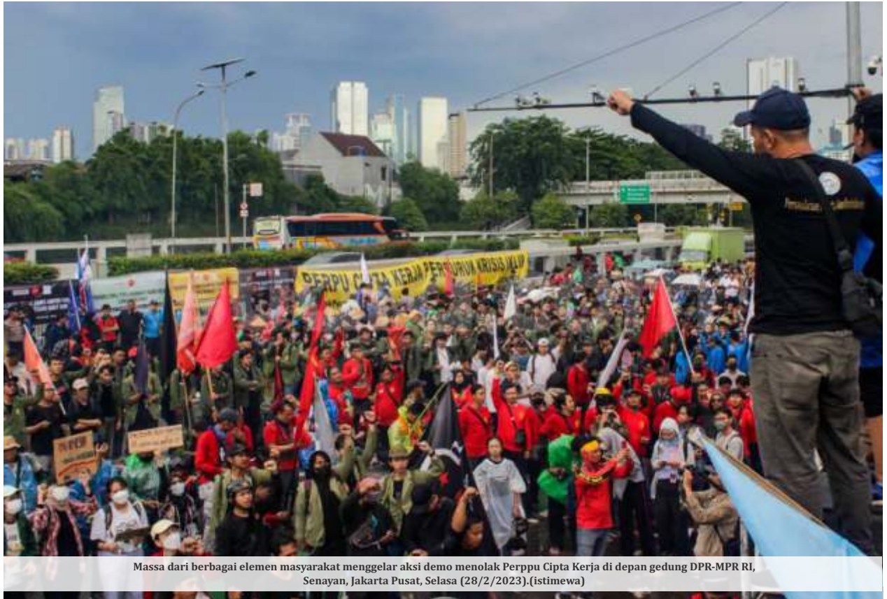
Massa dari berbagai elemen masyarakat menggelar aksi demo menolak Perppu Cipta Kerja di depan gedung DPR-MPR RI, Senayan, Jakarta Pusat, Selasa (28/2/2023).

Sedangkan, pada mini fraksi Baleg sendiri, Nurdin menjelaskan dari sembilan fraksi, ada tujuh yang setuju Perppu Cipta Kerja disahkan menjadi UU. Sedangkan, dua fraksi menolak. Tujuh fraksi itu: PDI Perjuangan (PDIP), Golkar, Gerindra, NasDem, Partai Kebangkitan Bangsa (PKB), Partai Amanat Nasional (PAN), dan