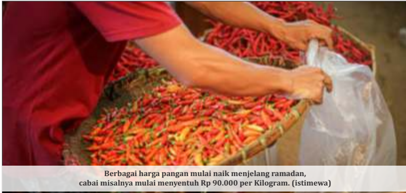
Berbagai harga pangan mulai naik menjelang ramadan, cabai misalnya mulai menyentuh Rp 90.000 per kilogram.

JAKARTA - Ikatan Pedagang Pasar Indonesia (Ikappi) mengingatkan, terkait fase - fase kenaikan harga pangan jelang puasa dan lebaran 2023. Kondisi di pasar, meski bulan ramadan masih sekitar 10 hari lagi, namun beberapa komoditas sudah mulai naik harga.