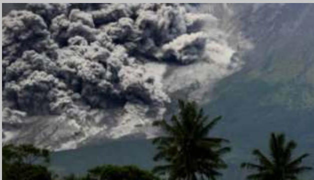
Gunung Merapi mengalami erupsi pada Sabtu (11/3/2023) siang. Akibat kondisi ini, sejumlah wilayah di Jawa Tengah (Jateng) diguyur hujan abu vulkanik.

SLEMAN —Masyarakat tengah dihebohkan dengan awan berbentuk Mbah Petruk di atas Gunung Merapi pada Minggu, (12/3/2023) pagi. Gumpalan awan hitam itu memiliki bentuk yang menyerupai tokoh pewayangan Jawa, Petruk, dengan hidung panjang yang khas.