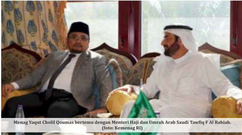
Menag Yaqut Cholil Qoumas bertemu dengan Menteri Haji dan Umrah Arab Saudi Tawfiq F Al Rabiah.

JAKARTA - Harapan masyarakat tidak terlalu menunggu lama keberangkatan ke Tanah Suci mendapat angin segar. Menteri Agama (Menag) Yaqut Cholil Qoumas bertemu Menteri Haji dan Umrah Arab Saudi, Tawfiq F Al Rabiah di Jeddah, Arab Saudi. Keduanya membahas persiapan penyelenggaraan ibadah haji, termasuk terkait tambahan kuota jamaah haji Indonesia.