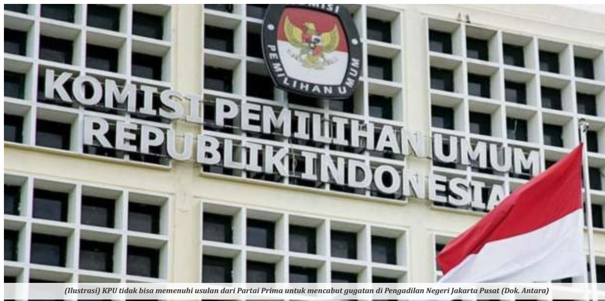
(Ilustrasi) KPU tidak bisa memenuhi usulan dari Partai Prima untuk mencabut gugatan di Pengadilan Negeri Jakarta Pusat

JAKARTA - Anggota Komisi Pemilihan Umum (KPU) Idham Holic menegaskan bahwa pihaknya tidak bisa memenuhi usulan dari Partai Prima untuk mencabut gugatan di Pengadilan Negeri Jakarta Pusat jika mereka diloloskan oleh KPU menjadi peserta Pemilu Serentak 2024. Menurut Idham, proses mediasi KPU dengan calon parpol peserta pemilu hanya bisa dilakukan dalam proses sengketa di Bawaslu.