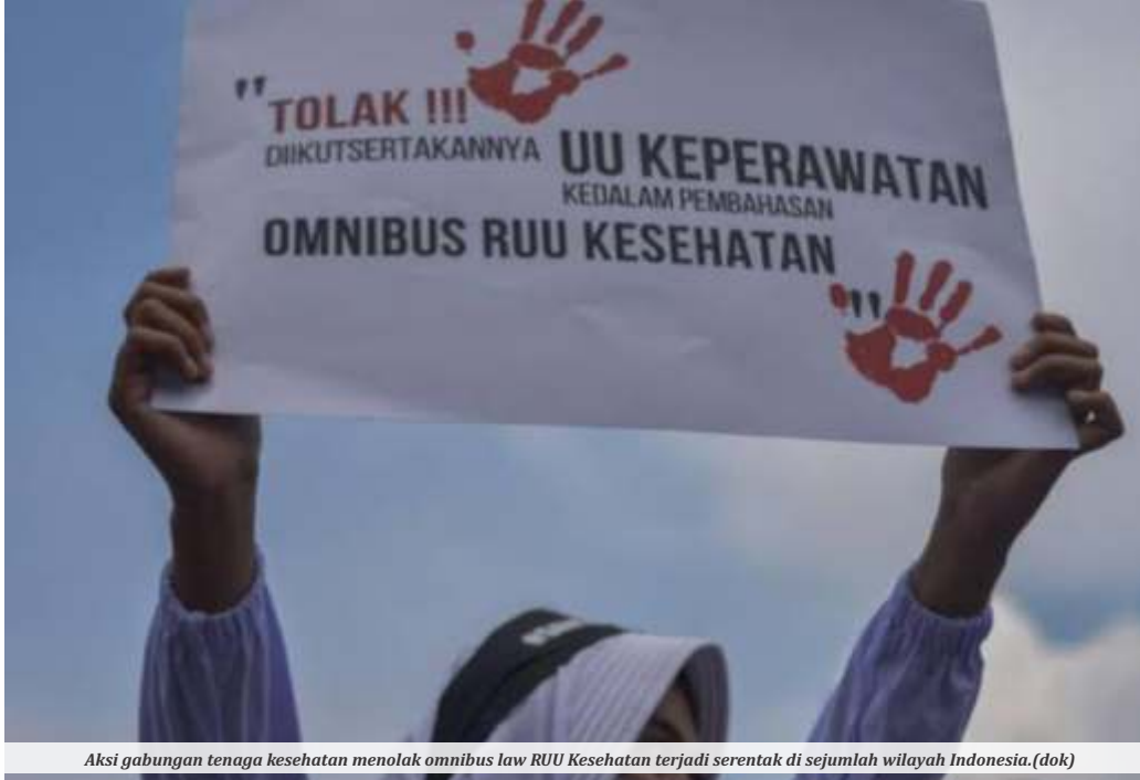
Aksi gabungan tenaga kesehatan menolak omnibus law RUU Kesehatan terjadi serentak di sejumlah wilayah Indonesia.

JAKARTA - Dewan Perwakilan Rakyat (DPR) telah resmi mengirimkan draft RUU Kesehatan kepada pemerintah untuk dibahas bersama. Hal itu dilakukan setelah RUU yang masih berpolemik tersebut disahkan sebagai inisiatif DPR dalam sidang paripurna pada bulan Februari lalu.