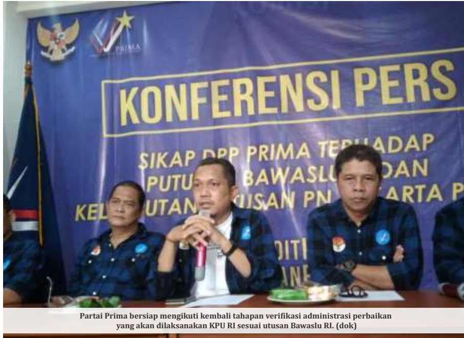
Partai Prima bersiap mengikuti kembali tahapan verifikasi administrasi perbaikan yang akan dilaksanakan KPU RI sesuai putusan Bawaslu RI.

Putusan itu memerintahkan KPU untuk memberikan kesempatan pada Prima menyampaikan dokumen perbaikan paling lama 10x24 jam. "Tindakan KPU menetapkan Prima tidak memenuhi syarat administrasi parpol merupakan substansi yang diatur dalam UU Pemilu," terang Afif. "Maka pokok perselisihan yang dipermasalahkan terbukti sebagai perselisihan yang menjadi wewenang