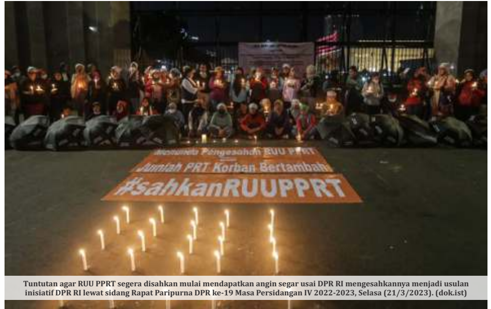
Tuntutan agar RUU PPRT segera disahkan mulai mendapatkan angin segar usai DPR RI mengesahkannya menjadi usulan inisiatif DPR RI lewat sidang Rapat Paripurna DPR ke-19 Masa Persidangan IV 2022-2023, Selasa (21/3/2023).

Di sisi lain, masuknya RUU PPRT menjadi inisiatif DPR RI sesuai harapan Presiden Joko Widodo. Sebelumnya, Jokowi berharap agar RUU PPRT segera ditetapkan menjadi UU. Untuk merealisasikan harapan-