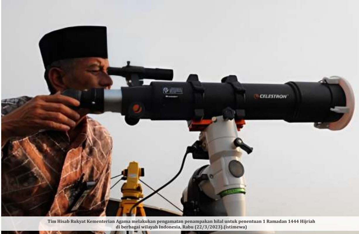
Tim Hisab Rukyat Kementerian Agama melakukan pengamatan penampakan hilal untuk penentuan 1 Ramadan 1444 Hijriah di berbagai wilayah Indonesia, Rabu (22/3/2023).

JAKARTA - Presiden Joko Widodo memberikan arahan agar pelaksanaan buka puasa bersama selama Ramadan 1444 Hijriah ditiadakan. Arahan tersebut tertuang dalam Surat Sekretaris Kabinet Nomor 38/Seskab/DKK/03/2023 tentang arahan terkait penyelenggaraan buka puasa bersama yang diteken Sekretaris Kabinet Pramono Anung pada 21 Maret 2023.