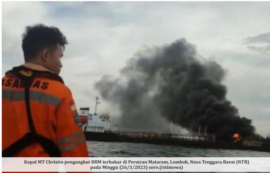
Kapal MT Christin pengangkut BBM terbakar di Perairan Mataram, Lombok, Nusa Tenggara Barat (NTB) pada Minggu (26/3/2023) sore.

MATARAM - Kapal MT Christin terbakar di Perairan Mataram, Lombok, Nusa Tenggara Barat (NTB) pada Minggu (26/3/2023) sore. Kapal MT Christin ini adalah kapal pengangkut BBM yang disewa oleh Pertamina.