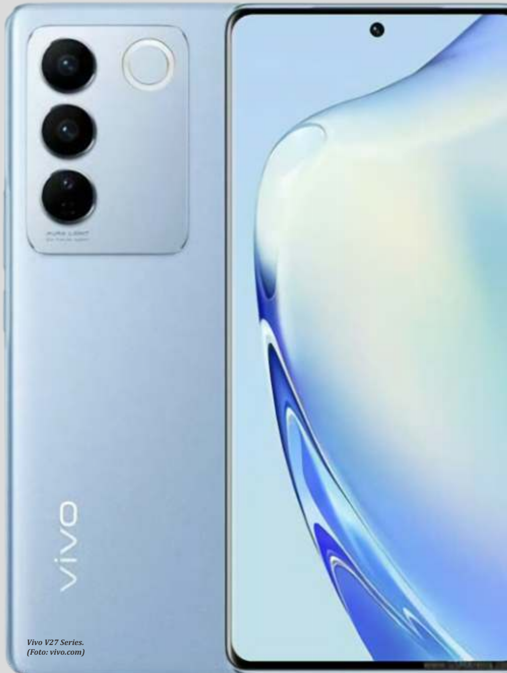
Vivo V27 Series.