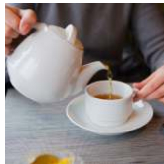
Perhatikan cara konsumsi kopi dan teh