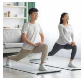
Konsumsi vitamin dan olahraga ringan