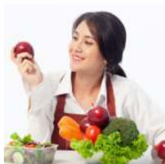
Berbuka dan sahur dengan makanan yang mengandung antioksidan