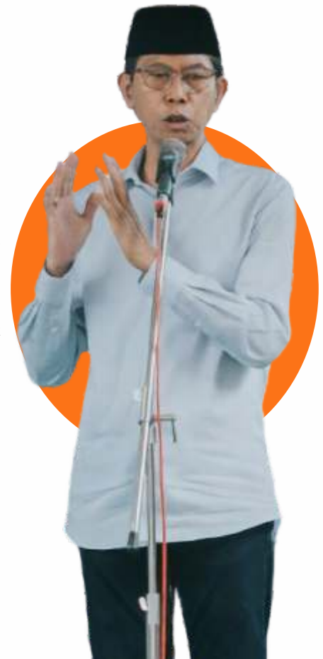
ADI SUTARWIJONO, KETUA DPRD KOTA SURABAYA

“Kita berharap ekonomi Surabaya tumbuh di atas 7 persen. Kesejahteraan masyarakat semakin dirasakan meningkat, terutama di kalangan wong cilik. Pelayanan publik semakin mudah. Surabaya semakin maju, semakin tumbuh bergairah, semakin guyub rukun dalam semangat gotong royong,” kata Adi. (ADV,mira/dya)