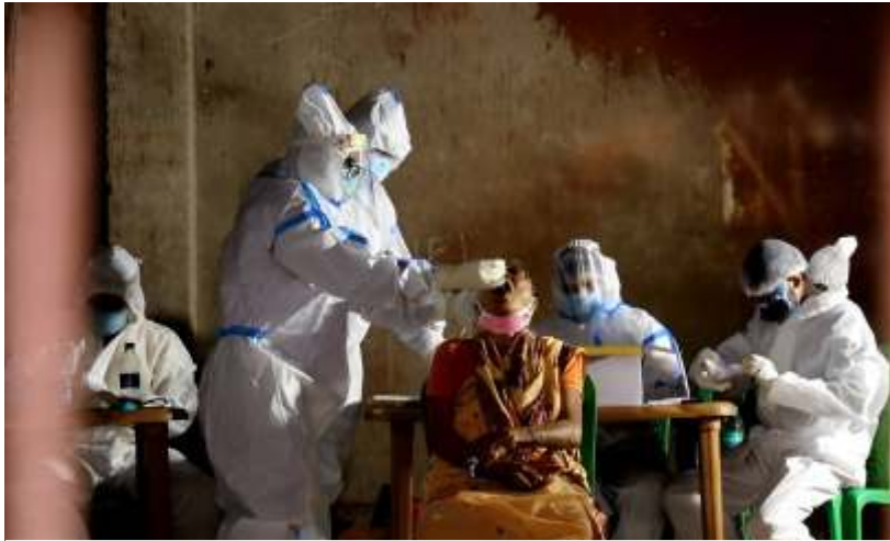
India mencatat 3.016 kasus baru Covid-19 dalam 24 jam terakhir, sehingga memasifkan kembali tes PCR dan vaksinasi.

JAKARTA - Subvarian Omicron XBB 1.16 atau Arcturus tengah disorot dunia. Subvarian ini disebut-sebut menjadi 'biang kerok' kenaikan kasus harian COVID-19 di India yang mulanya 300 kasus menjadi 1.000 kasus per Kamis (30/3/2023). Di samping itu, subvarian ini juga sudah terdeteksi di negara-negara tetangga seperti Singapura dan Brunei Darussalam. Hal ini membuat masyarakat khawatir subvarian ini bakal masuk ke +62.