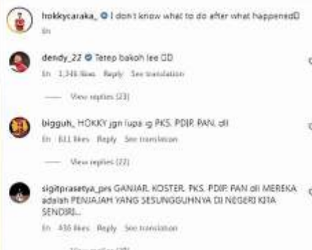
Pemain Timnas Indonesia U-20 ramai-ramai bercuit di media sosial Ganjar yang dianggap sebagai salah satu penyebab keputusan FIFA membatalkan Indonesia sebagai tuan rumah Piala Dunia U-20 2023. (dok)

JAKARTA-FIFA telah resmi membatalkan Indonesia sebagai tuan rumah Piala Dunia U-20 2023. Sayangnya, pemerintah sudah mengeluarkan anggaran sekitar Rp 1,4 triliun untuk persiapan pertandingan tersebut. Potensi nilai ekonomi dari sektor wisata hingga perdagangan sekitar Rp 188 triliun pun menguap.