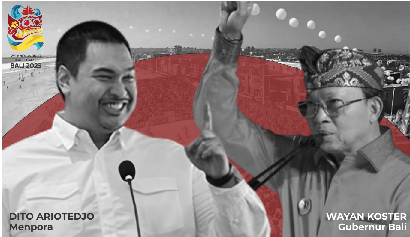
DITO ARIOTEDJO Menpora

Permenlu ini menjadi perbincangan usai Ketua DPR Puan Maharani mengatakan pembatalan Piala Dunia U-20 di RI karena Indonesia tak punya hubungan luar negeri dengan Israel. Namun, ia tak menjelaskan secara spesifik peraturan yang dimaksud. (wid,rls,mer,rep/dya)