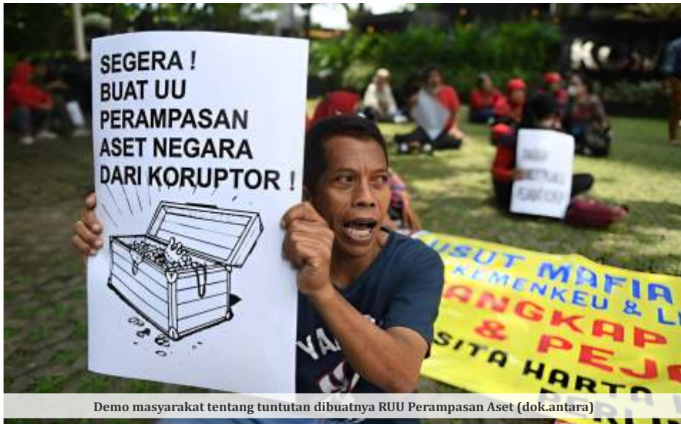
Demo masyarakat tentang tuntutan dibuatnya RUU Perampasan Aset

JAKARTA - Presiden Joko Widodo (Jokowi) mendorong agar RUU Perampasan Aset segera disahkan. Saat ini pembahasan RUU tersebut mandek di DPR RI tiga tahun sejak diajukan oleh pemerintah.