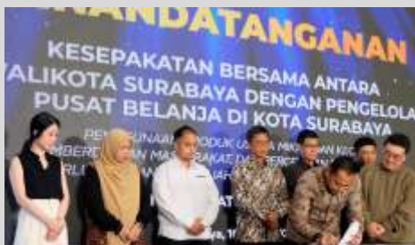
Wali Kota Surabaya Eri Cahyadi saat menandatangani MoU dengan 32 pengelola pusat belanja di Hotel Sheraton, Senin (10/4/2023).

SURABAYA -Wali Kota Surabaya Eri Cahyadi mendorong pengelola pusat belanja meningkatkan produk dalam negeri, penyerapan tenaga kerja, dan pengentasan kemiskinan. Salah satu strategi yang dilakukan Pemerintah Kota (Pemkot) adalah melakukan kesepakatan dengan 32 pengelola pusat belanja di Hotel Sheraton, Senin (10/4/2023).