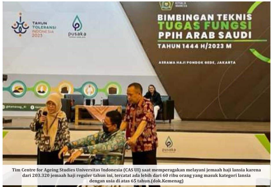
Tim Centre for Ageing Studies Universitas Indonesia (CAS UI) saat memperagakan melayani jamaah haji lansia karena dari 203.320 jamaah haji reguler tahun ini, tercatat ada lebih dari 60 ribu orang yang masuk kategori lansia dengan usia di atas 65 tahun.

Melihat komposisi jamaah lansia mencapai 30,2 persen inilah, kemenag, kementerian kesehatan untuk kali pertama menggelar bimbingan teknis bagi 1.243 petugas haji, selama 10 hari (7-16 April 2023) di Jakarta Timur. "Untuk kali pertama dalam sejarah penyelenggaraan haji, lansia jadi tema utama pelayanan haji, san untuk kali pertama ada bimtek terintegrasi antara petugas ibadah, operasional, perlindungan dan kementerian bimtek bersama," kata Kepala Bidang Humas Haji Kemenag M