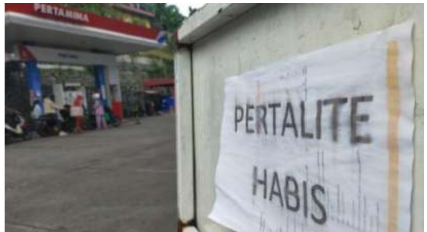
(Ilustrasi) Tanpa pembatasan pembelian, subsidi untuk BBM tahun ini diprediksi naik tajam terkait makin panjangnya libur Ramadan 2023.

Namun, penjualan untuk Solar subsidi justru diprediksi bakal mengalami penurunan. Hal tersebut terjadi lantaran pada hari raya Idul Fitri, pemerintah biasanya akan melarang kendaraan jenis