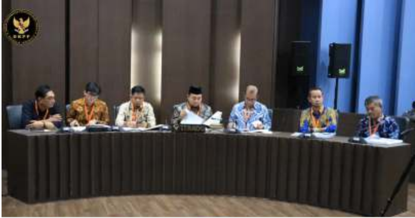
DKPP memeriksa 19 anggota KPU dari tingkat pusat, provinsi, dan kabupaten Senin (10/4/2023) terkait dengan dugaan kecurangan dalam proses verifikasi partai politik calon peserta Pemilu 2024.

JAKARTA -Dewan Kehormatan Penyelenggara Pemilu (DKPP) memeriksa 19 anggota KPU dari tingkat pusat, provinsi, dan kabupaten dalam perkara nomor 53-PKE-DKPP/III/2023, Senin (10/4/2023). Perkara ini berkaitan dengan dugaan kecurangan dalam proses verifikasi partai politik calon peserta Pemilu 2024 yang membuat beberapa partai politik bisa lolos verifikasi.