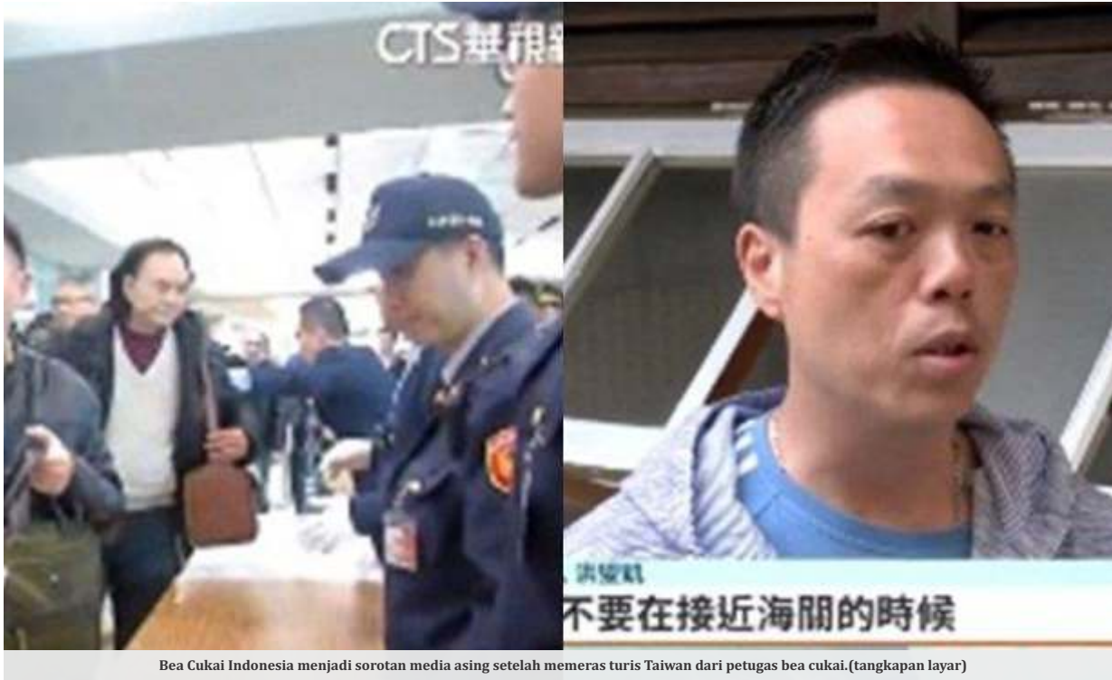
Bea Cukai Indonesia menjadi sorotan media asing setelah memeras turis Taiwan dari petugas bea cukai. (tangkap layar)

JAKARTA - Bea Cukai Indonesia kembali menjadi sorotan, bahkan kini sampai ke dunia internasional. Sebuah media asing mengulas kelakuan oknum diduga petugas bea cukai yang melakukan pemerasan terhadap turis Taiwan di Bali.