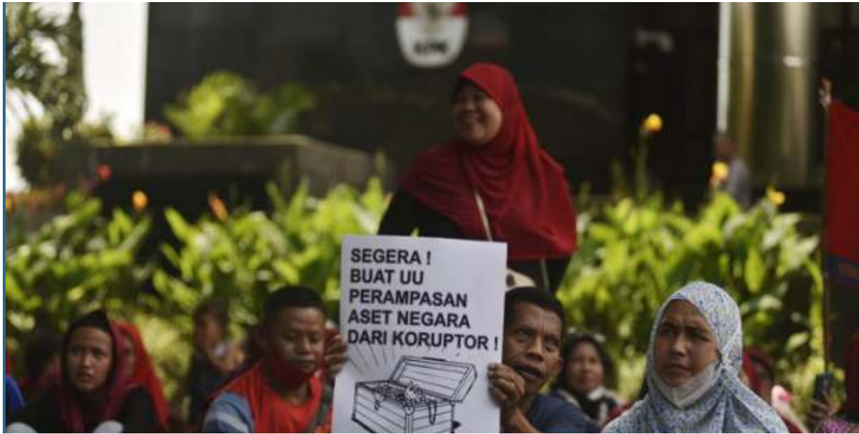
(Ilustrasi) Presiden Jokowi mendorong DPR segera menyelesaikan Rancangan Undang-Undang (RUU) Perampasan Aset. (dok)

JAKARTA - Untuk kesekian kalinya, Presiden Joko Widodo (Jokowi) mendorong RUU Perampasan Aset segera diselesaikan. Jokowi menegaskan UU ini sangat penting.