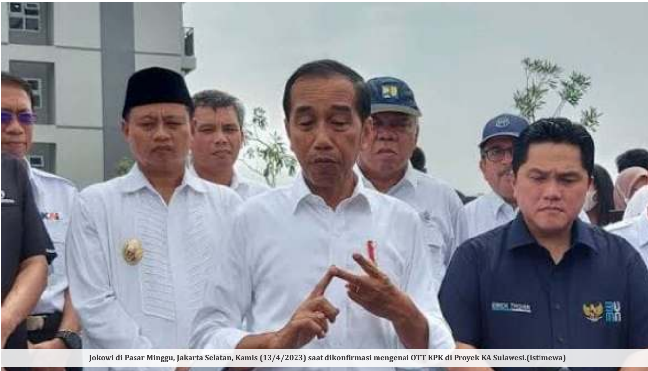
Jokowi di Pasar Minggu, Jakarta Selatan, Kamis (13/4/2023) saat dikonfirmasi mengenai OTT KPK di Proyek KA Sulawesi.

JAKARTA - Presiden Joko Widodo (Jokowi) angkat suara mengenai operasi tangkap tangan (OTT) oleh Komisi Pemberantasan Korupsi (KPK) pada proyek Kereta Api Trans-Sulawesi. Diketahui, ada dugaan kasus suap terhadap pejabat pembuat komitmen pada jalur kereta di Makassar yang diresmikan dirinya pada Maret lalu.