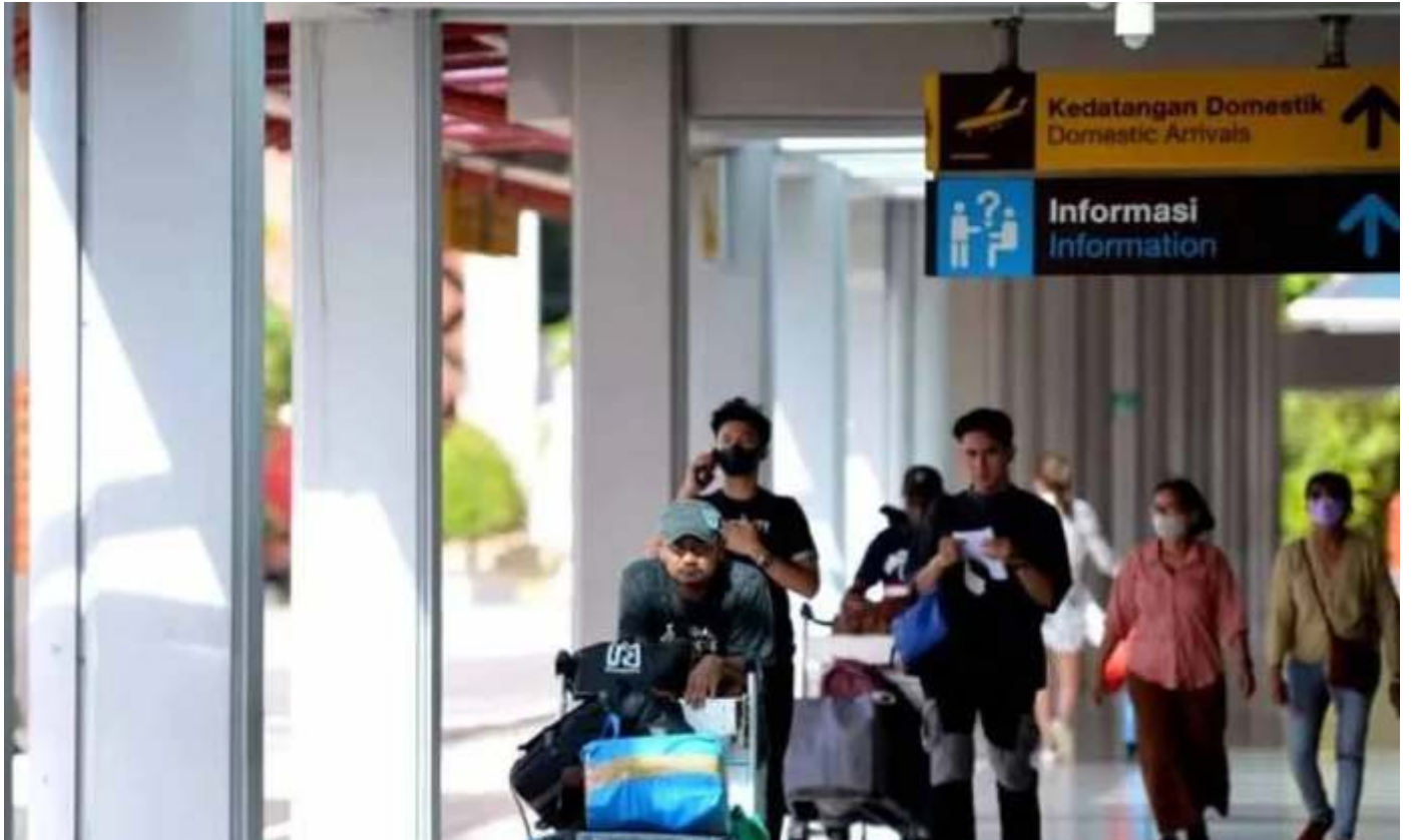
Jelang mudik lebaran 2023 kasus baru corona naik lagi. Masyarakat diimbau tetap tertib bermasker.

Kabar baiknya, gejala yang dikeluhkan terbilang ringan yakni batuk hingga nyeri otot. "Pasien berangkat ke India tanggal 13 Maret 2023 dan pulang ke Indonesia tanggal 18 Maret kembali ke Indonesia. Sampai di Jakarta mengalami gejala flu, badan sakit semua, keringat dingin, leher gatal dan