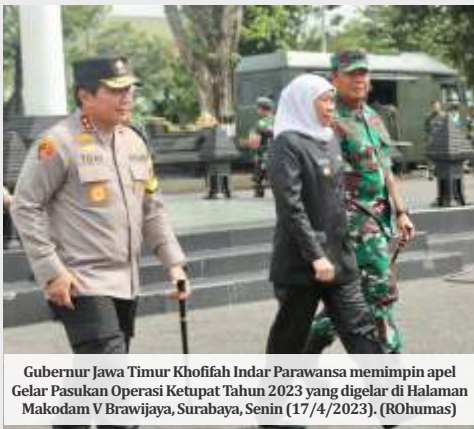
Gubernur Jawa Timur Khofifah Indar Parawansa memimpin apel Gelar Pasukan Operasi Ketupat Tahun 2023 yang digelar di Halaman Makodam V Brawijaya, Surabaya, Senin (17/4/2023).

SURABAYA -Ditlantas Polda Jatim mencatat ada tujuh titik ruas jalan tol di Jatim yang rawan kecelakaan dan harus diperhatikan saat mudik lebaran 2023. Pemetaan itu didapat berdasarkan hasil analisis dan evaluasi kejadian kecelakaan pada periode 2021 dan 2022.