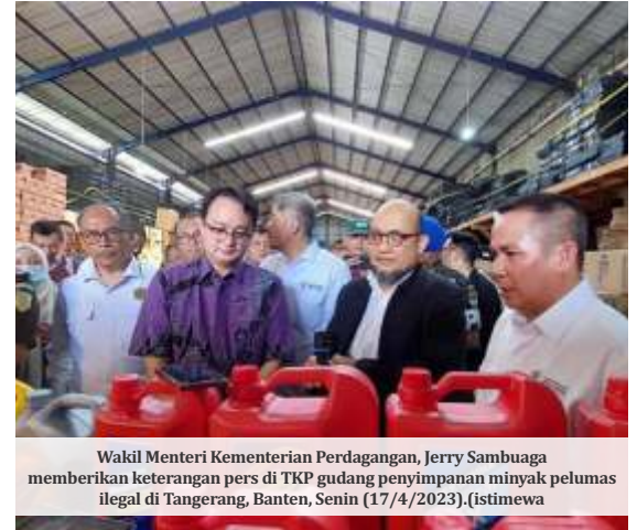
Wakil Menteri Perdagangan, Jerry Sambuaga memberikan keterangan pers di TKP gudang penyimpanan minyak pelumas ilegal di Tangerang, Banten, Senin (17/4/2023).