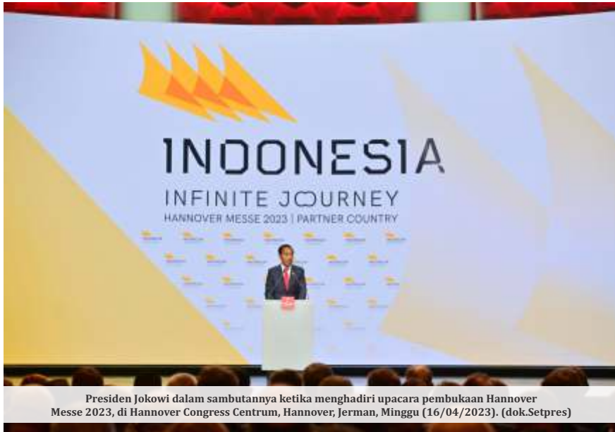
Presiden Jokowi dalam sambutannya ketika menghadiri upacara pembukaan Hannover Messe 2023, di Hannover Congress Centrum, Hannover, Jerman, Minggu (16/04/2023).

JAKARTA - Istana membenarkan bila Pemerintah akan terus menguatkan komitmen transformasi energi terbarukan dengan menutup seluruh Pembangkit Listrik Tenaga Uap (PLTU) berbahan bakar batu bara pada 2050. Hal ini meluruskan pernyataan Presiden Joko Widodo (Jokowi) saat membuka agenda pameran industri Hannover Messe di Jerman yang mengatakan penghentian semua PLTU tahun 2025.