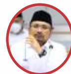
YAQUT CHOLIL QOUMAS Menteri Agama

"Saya mengimbau kepada seluruh umat Islam untuk menghormati perbedaan pendapat hukum. Apabila di kalangan masyarakat terjadi perbedaan penyelenggaraan sholat 'Idul Fitri, hendaknya hal tersebut direspons dan disikapi secara bijak, dengan saling menghormati pilihan pendapat keagamaan masing-masing individu."