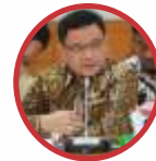
ACE HASAN SYADZILY Wakil Ketua Komisi VIII DPR RI

"Saya mengimbau kepada seluruh umat Islam untuk menghormati perbedaan pendapat hukum. Apabila di kalangan masyarakat terjadi perbedaan penyelenggaraan sholat 'Idul Fitri, hendaknya hal tersebut direspons dan disikapi secara bijak, dengan saling menghormati pilihan pendapat keagamaan masing-masing individu."