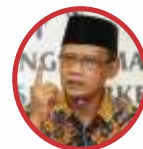
HAEDAR NASHIR Ketua Umum PP Muhammadiyah

"Perbedaan penetapan Idul Fitri yang kemungkinan berbeda, tidak boleh disikapi secara berlebihan. Kita sudah memiliki pengalaman soal perbedaan penetapan 1 Syawal itu."