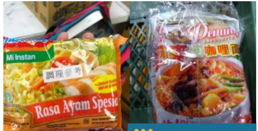
Kementerian Kesehatan Taiwan menemukan zat etilen oksida (EtO) yang menyebabkan kanker di dua produk mi instan yaitu "Ah Lai White Curry Noodles" dari Malaysia (kanan) dan Indomie rebus Rasa Ayam Spesial dari Indonesia (kiri).

Tulus melanjutkan, jika hasil audit BPOM nantinya menunjukkan nihil produk yang beredar seperti di Taiwan hingga Malaysia, uji sampling juga perlu dilakukan pada produk di luar produksi batch tersebut, yang tersebar di Tanah Air.