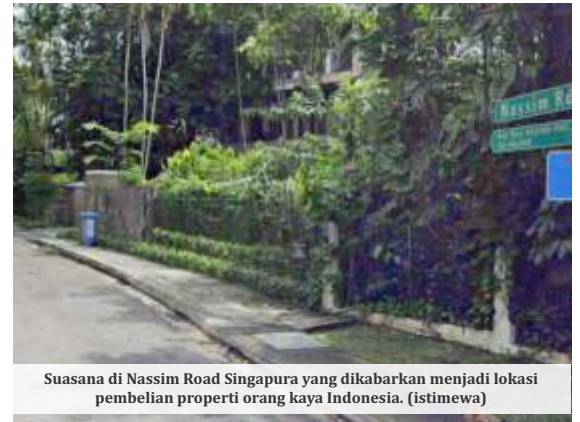
Suasana di Nassim Road Singapura yang dikabarkan menjadi lokasi pembelian properti orang kaya Indonesia.

punya daya pikat kuat bagi orang-orang kaya Indonesia, terutama karena lokasinya yang dekat dan mudah dijangkau dari Jakarta. Negeri Singa itu bisa dijangkau dari Jakarta dengan penerbangan kurang dari dua jam.