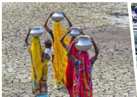
Kesulitan air bersih hingga aspal meleleh akibat udara panas ekstrem melanda India dan dikabarkan telah menyebabkan belasan orang tewas.