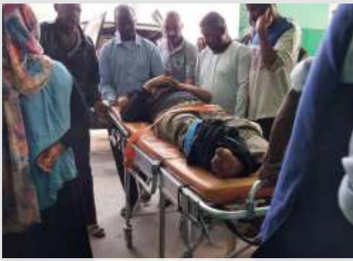
Salah satu bus evakuasi WNI dari Sudan kecelakaan, 3 orang terluka dan telah dibawa ke rumah sakit Kota Port Sudan.

JAKARTA - Salah satu bus yang dipakai untuk mengevakuasi warga negara Indonesia (WNI) di Sudan mengalami kecelakaan, Rabu (26/4/2023). Akibat kecelakaan ini, 3 orang dikabarkan terluka.