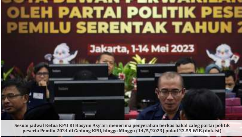
Sesuai jadwal Ketua KPU RI Hasyim Asy'ari menerima penyerahan berkas bakal caleg partai politik peserta Pemilu 2024 di Gedung KPU, hingga Minggu (14/5/2023) pukul 23.59 WIB.

JAKARTA-KPU RI menutup masa pendaftaran calon legislatif (caleg) DPR RI, DPRD, dan DPD Pemilu 2024 pada Minggu (14/5/2023). Berbagai kalangan pun berada dalam daftar bakal caleg tersebut. Ada deretan nama kepala daerah hingga kepala desa. Beberapa pun telah memutuskan untuk mengundurkan diri dari jabatannya.