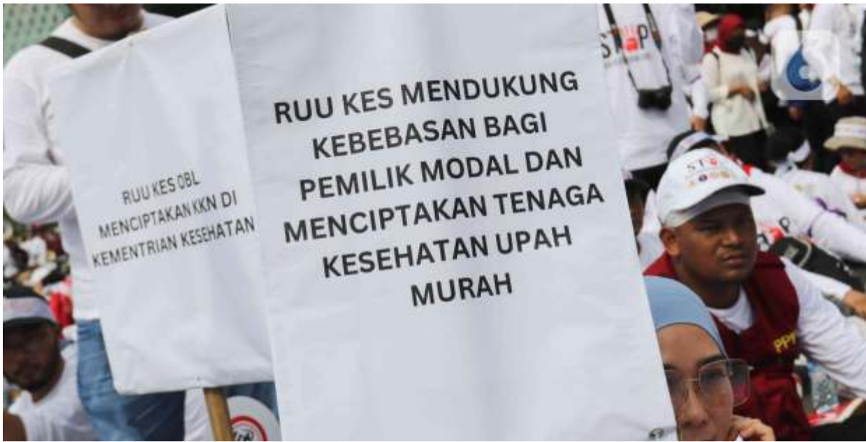
(Ilustrasi) Tenaga kesehatan memprotes RUU Kesehatan yang dinilai merugikan, namun pemerintah mengklaim aturan tersebut untuk memperkuat perlindungan hukum bagi nakes. (dok.ist)

JAKARTA-Rancangan Undang-Undang (RUU) Kesehatan mendapat banyak penolakan dari berbagai pihak termasuk organisasi profesi tenaga kesehatan. Berbeda dengan klaim Kementerian Kesehatan (Kemenkes), aturan tersebut justru menguatkan perlindungan hukum bagi tenaga kesehatan (nakes).