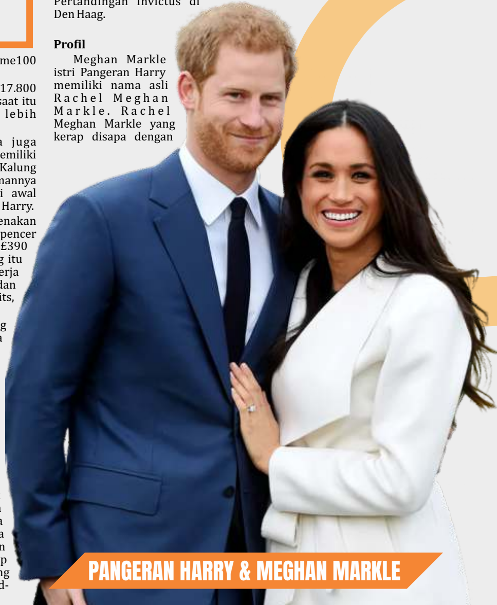
PANGERAN HARRY & MEGHAN MARKLE

Markle sangat dekat dengan ibunya. Ibunya seorang keturunan afrika amerika, sedangkan ayahnya keturunan amerika kulit putih. Sehingga dia memiliki warna kulit setengah hitam setengah putih (berbagai sumber)