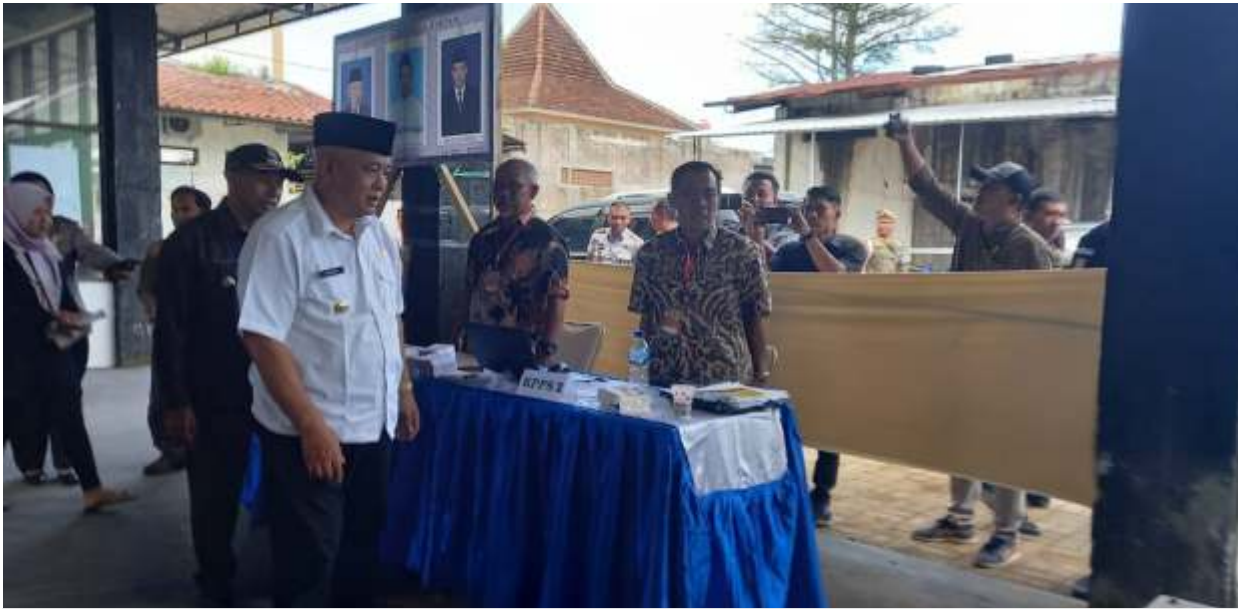
Bupati Malang, Sanusi saat meninjau TPS 1 Desa Panggungrejo, Kecamatan Kepanjen, Kabupaten Malang.

MALANG - Pemilihan Kepala Desa (Pilkades) secara serentak di 56 desa se-Kabupaten Malang telah dilaksanakan Minggu (14/5/2023). Pelaksanaan pesta demokrasi tingkat desa ini dilaporkan berjalan aman, lancar dan tertib. Namun demikian, dari hasil sementara diketahui banyak calon petahana yang malah tumbang dari pesaingnya.