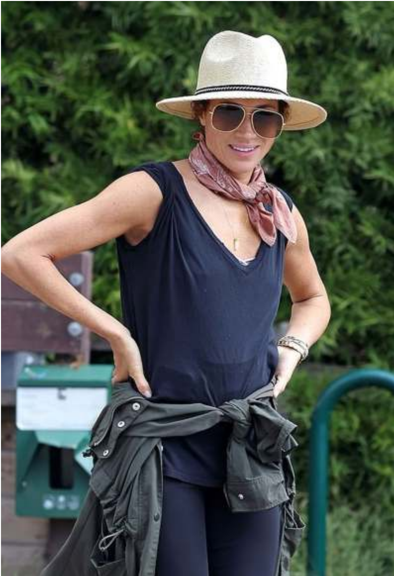
Meghan Markle Hiking Pakai Gelang Putri Diana Rp 2,8 M

Sabtu, 16 Mei 2023. Istri Pangeran Harry itu memilih tetap berada di Amerika Serikat untuk merayakan ulang tahun anak pertamanya, Pangeran Archie. Bersamaan dengan penobatan, dia hiking atau mendaki di California.