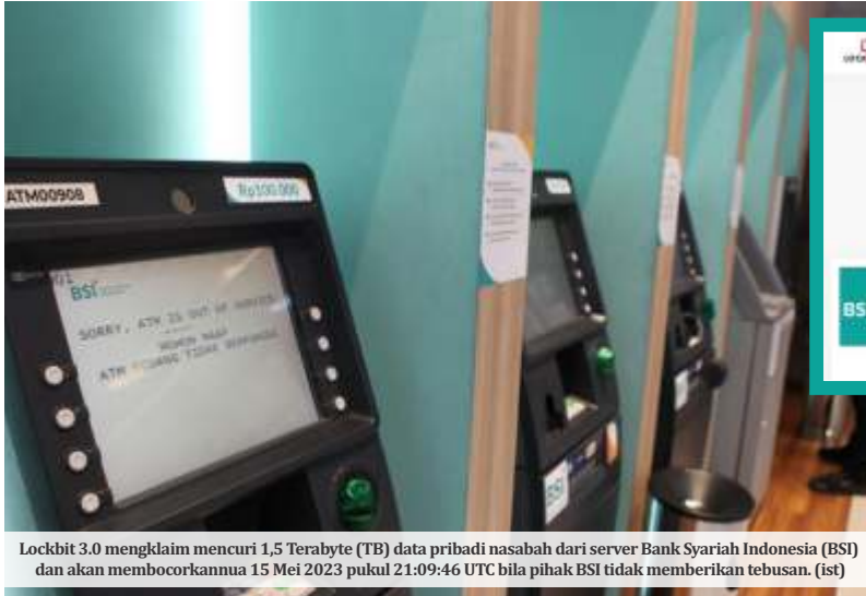
Lockbit 3.0 mengklaim mencuri 1,5 Terabyte (TB) data pribadi nasabah dari server Bank Syariah Indonesia (BSI) dan akan membocorkannya 15 Mei 2023 pukul 21:09:46 UTC bila pihak BSI tidak memberikan tebusan. (ist)