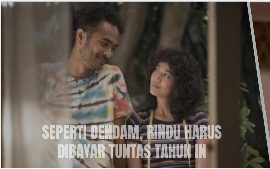
SEPERTI DENDAM, RINDU HARUS DIBAYAR TUNTAS TAHUN INI