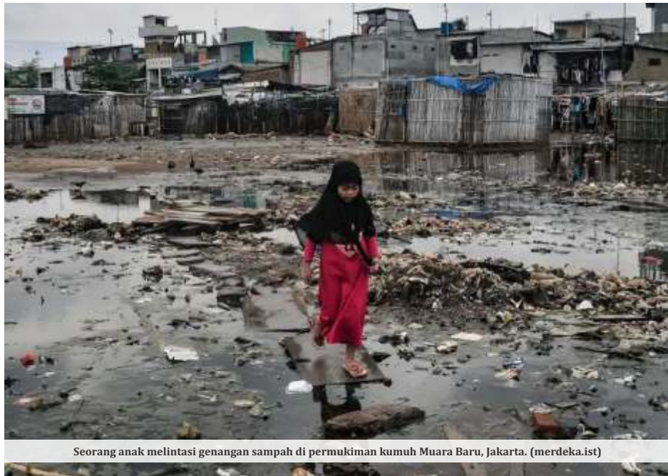
Seorang anak melintasi genangan sampah di permukiman kumuh Muara Baru, Jakarta.

JAKARTA - Presiden Joko Widodo (Jokowi) menargetkan pertumbuhan ekonomi pada 2024 berada di kisaran 5,3-5,7%. Hal itu tertuang dalam Kerangka Ekonomi Makro (KEM) dan Pokok-pokok Kebijakan Fiskal (PPKF) tahun 2024. Kalangan ekonom pun menilai angka tersebut terlalu tinggi.