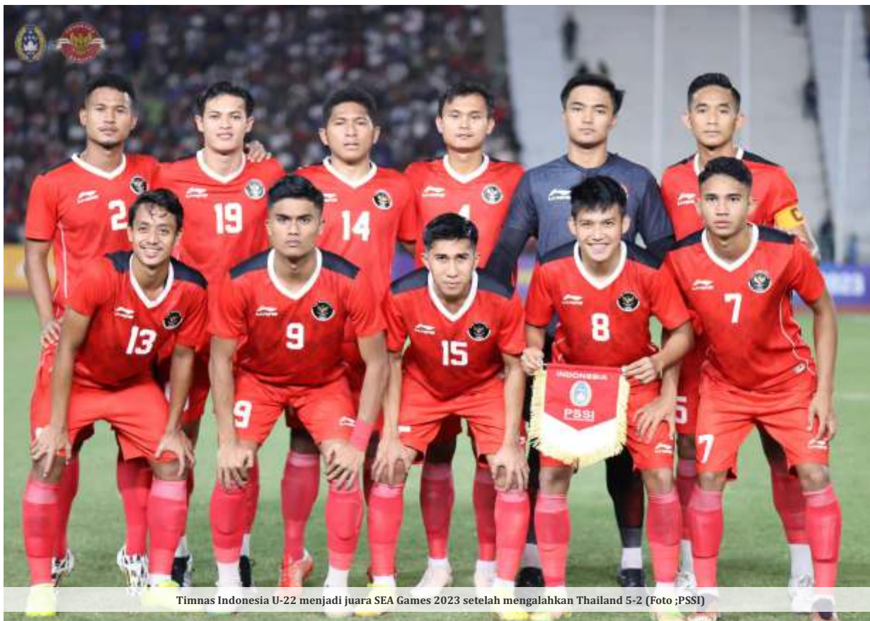
Timnas Indonesia U-22 menjadi juara SEA Games 2023 setelah mengalahkan Thailand 5-2

KAMBOJA – Pertandingan babak final untuk cabang olah raga sepak bola putra SEA Games 2023 akhirnya dimenangkan timnas U-22 Indonesia mengalahkan Thailand dengan skor 5-2 di Stadion Nasional Olimpiade, Phnom Penh, Selasa (16/5/2023) malam.