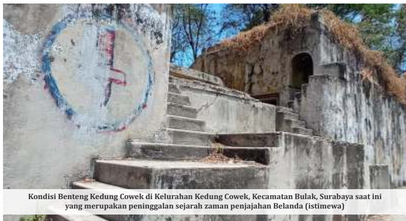
Kondisi Benteng Kedung Cowek di Kelurahan Kedung Cowek, Kecamatan Bulak, Surabaya saat ini yang merupakan peninggalan sejarah zaman penjajahan Belanda