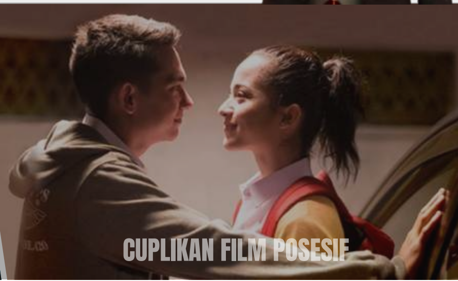
CUPLIKAN FILM POSESIF