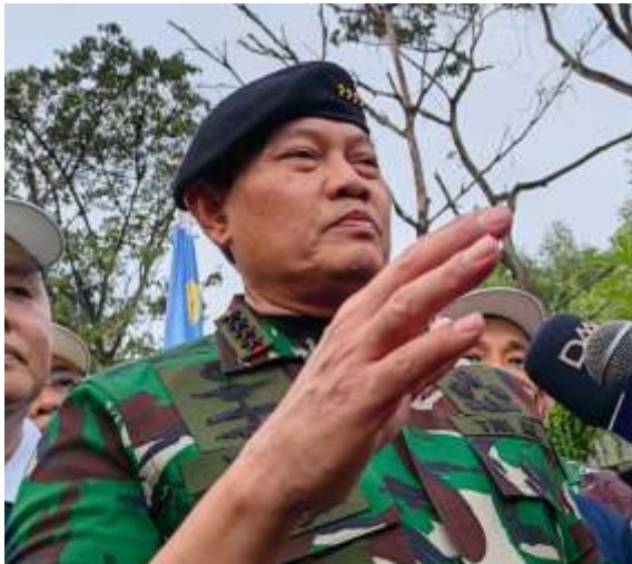
Panglima TNI Laksamana Yudo Margono bingung, draf revisi UU TNI yang belum final, tetapi sudah mencuat ke publik.

JAKARTA - Meski baru sebatas usulan, revisi Undang-undang Nomor 34 tahun 2004 tentang Tentara Nasional Indonesia (UU TNI) yang muncul tiba-tiba memicu kekhawatiran. Pasalnya, perubahan berpotensi memberikan ruang lebih banyak bagi TNI menduduki jabatan sipil bisa membuka ruang kembalinya Dwifungsi ABRI. DPR RI hingga Presiden Joko Widodo (Jokowi) meminta publik tidak reaktif terkait rencana itu.