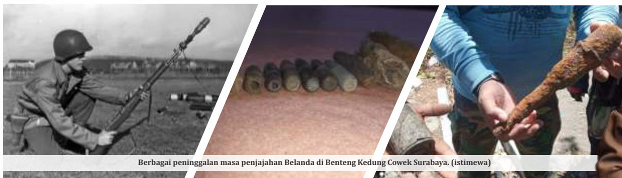
Berbagai peninggalan masa penjajahan Belanda di Benteng Kedung Cowek Surabaya.

Pimpinan DPRD ini memahami bahwa salah satu kendala utama bisa jadi perkara finansial. Namun kendala ini bisa diatasi dan bukan perkara sulit karena bisa dicarikan solusi bersama. Ada kenaikan TNI yang memberi ruang kepada Pemkot Surabaya dan pihak ketiga untuk menjadikan Benteng Kedung Cowek menjadi Wisata kejuangan. (adv/*dya)