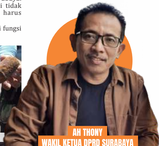
AH THONY WAKIL KETUA DPRD SURABAYA