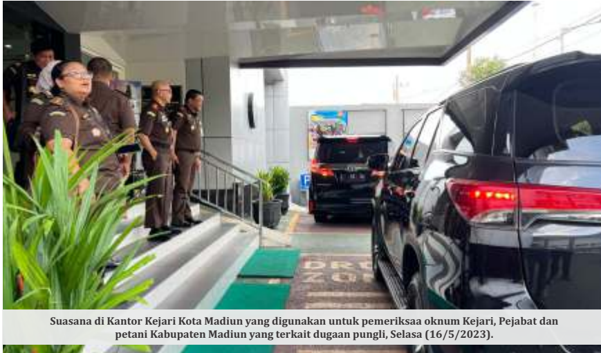
Suasana di Kantor Kejari Kota Madiun yang digunakan untuk pemeriksaa oknum Kejari, Pejabat dan petani Kabupaten Madiun yang terkait dugaan pungli, Selasa (16/5/2023).

MADIUN - Tim penyidik dari Kejaksaan Agung (Kejagung) RI dan Kejaksaan Tinggi (Kejati) Jawa Timur memeriksa sejumlah pejabat dari Kejaksaan Negeri (Kejari) Kabupaten Madiun, Pejabat Pemerintah Kabupaten Madiun, Petani tebu, dan pelapor dalam kasus dugaan pungli (pungutan liar) serta pemerasan yang dilakukan oleh