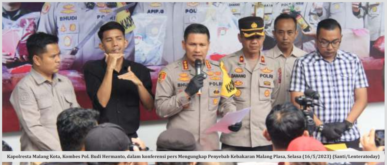
Kapolresta Malang Kota, Kombes Pol. Budi Hermanto, dalam konferensi pers Mengungkap Penyebab Kebakaran Malang Plasa, Selasa (16/5/2023)

gunakan Gas Chromatography–Mass Spectrometry (GC-MS), tidak ditemukan adanya bahan bakar hidrokarbon atau pelarut yang mudah menyala,” tambahnya.