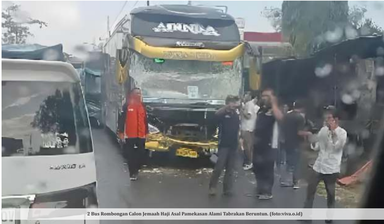
2 Bus Rombongan Calon Jamaah Haji Asal Pamekasan Alami Tabrakan Beruntun.

SURABAYA - Dua bus yang mengantarkan keberangkatan rombongan jamaah haji asal Kabupaten Pamekasan mengalami kecelakaan beruntun di Jalan Raya Tanah Merah, Bangkalan, Madura, Jawa Timur, Rabu (24/5/2023).