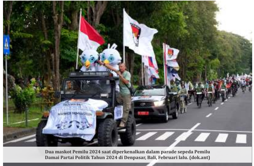
Dua maskot Pemilu 2024 saat diperkenalkan dalam parade sepeda Pemilu Damai Partai Politik Tahun 2024 di Denpasar, Bali, Februari lalu.

Mahfud mengatakan partai politik juga saling menggugat karena merasa dicurangi. Dia mengatakan gugatan itu terkait dengan perolehan suara. "Misalnya partai a menggugat b, b menggugat c, c menggugat f. Saling menggugat gitu karena merasa dicurangi. Siapa, yang curang biasanya pesertanya membayar orang di TPS. Memalsu suara perjalanan dari TPS ke kelurahan, dari