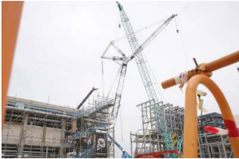
PT Freeport Indonesia (PTFI) melaporkan progres pembangunan smelter tembaga baru di kawasan industri Java Integrated Industrial and Port Estate (JIPE) Gresik mencapai 64% hingga kuartal I 2023.

JAKARTA- Anggota Komisi VII DPR menuding ada 'bandar' yang mempengaruhi peraturan di sektor pertambangan. Khususnya Peraturan Pemerintah (PP) Nomor 26 tahun 2022 tentang Jenis dan Tarif atas Jenis Penerimaan Negara Bukan Pajak yang Berlaku pada Kementerian Energi dan Sumber Daya Manusia.