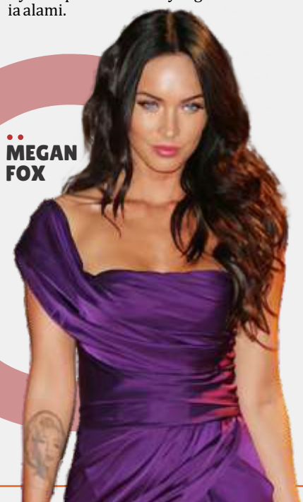
•• MEGAN FOX