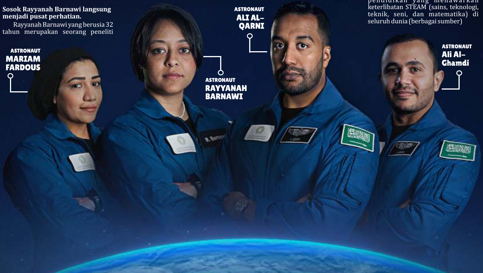
ASTRONAUT MARIAM FARDOUS