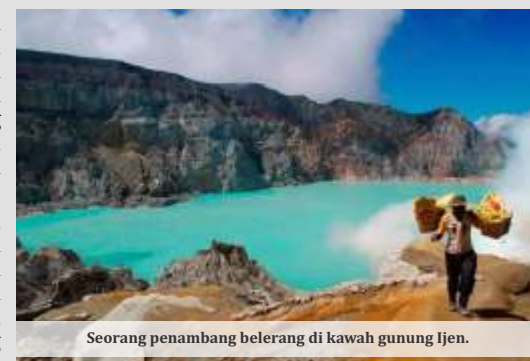
Seorang penambang belerang di kawah gunung Ijen.

peluang pendanaan menjadi semakin lebar karena keberadaan Ijen yang sudah menjadi UGGp semakin dikenal luas di level global, dan membuka peluang investasi bagi para calon investor yang akan berinvestasi di Ijen.