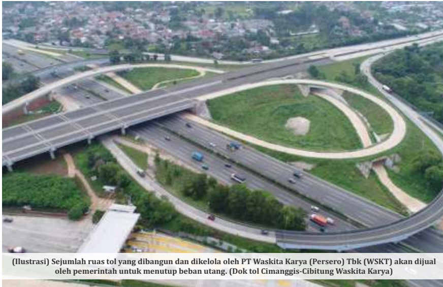
(Ilustrasi) Sejumlah ruas tol yang dibangun dan dikelola oleh PT Waskita Karya (Persero) Tbk (WSKT) akan dijual oleh pemerintah untuk menutup beban utang. (Dok tol Cimanggis-Cibitung Waskita Karya)

JAKARTA - Persoalan utang turut menjadi kritikan santer yang disuarakan oleh banyak pihak. Termasuk, kebijakan utang tersembunyi (hidden debt) di masa Presiden Joko Widodo naik drastis, dan sangat berdampak pada perekonomian dalam negeri.