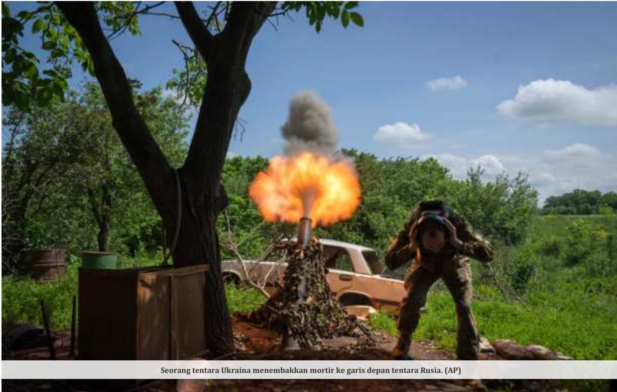
Seorang tentara Ukraina menembakkan mortir ke garis depan tentara Rusia.

KIEV - Menteri Pertahanan RI Prabowo Subianto mengusulkan proposal perdamaian untuk mengakhiri perang Rusia-Ukraina. Sayangnya, saran tersebut langsung ditolak oleh Ukraina.