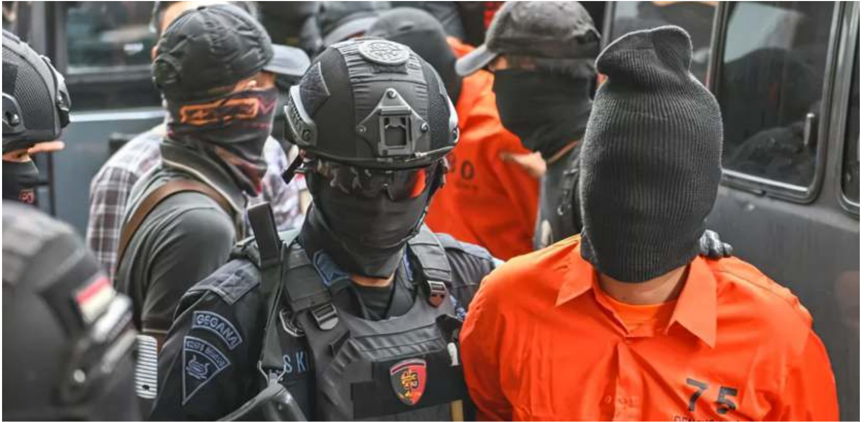
(Ilustrasi) Densus 88 Antiteror menangkap terduga teroris.

SURABAYA - Tim Detasemen Khusus (Densus) 88 Antiteror Polri menangkap tiga terduga teroris dalam operasi penegakan hukum dalam rangka mencegah tindak pidana terorisme di wilayah Jawa Timur dan Nusa Tenggara Barat.