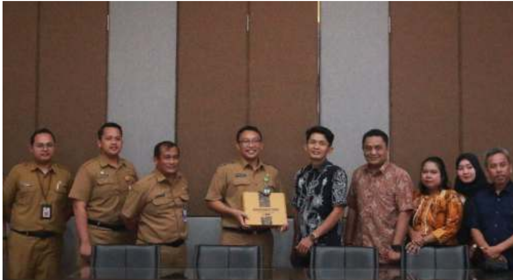
Diskusi mengenai potensi kelautan dan perikanan antara Dinas Kelautan dan Perikanan Provinsi Jawa Timur dengan Komisi III DPRD Kabupaten Pacitan saat melakukan kunjungan kerja, Selasa (16/5/2023).