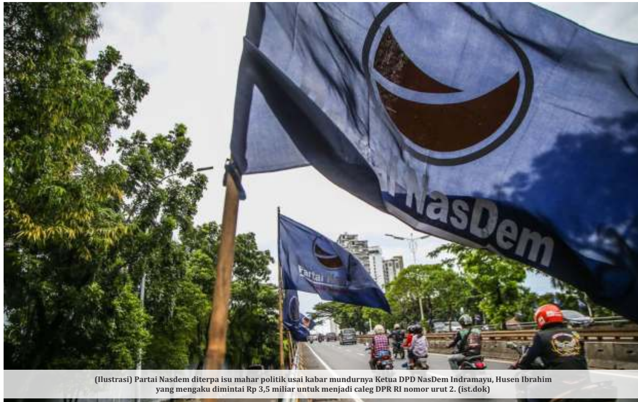
(Ilustrasi) Partai Nasdem diterpa isu mahar politik usai kabar mundurnya Ketua DPD NasDem Indramayu, Husen Ibrahim yang mengaku dimintai Rp 3,5 miliar untuk menjadi caleg DPR RI nomor urut 2. (ist.dok)

BANDUNG -Saat banyak pihak deg-degan menanti keputusan MK terkait sistem Pemilu 2024, kabar mahar politik untuk mendapatkan nomor urut terdepan mencuat dari Indramayu. Ketua DPD NasDem Indramayu, Husen Ibrahim, dikabarkan mundur karena diduga dimintai uang Rp 3,5 miliar untuk menjadi caleg DPR RI nomor urut 2.