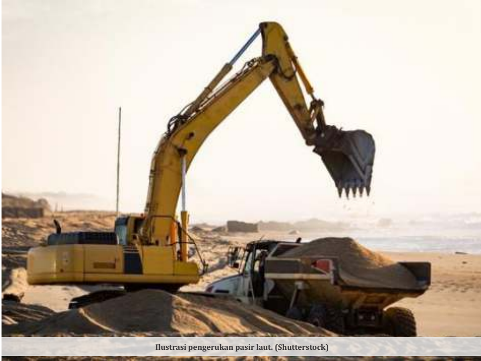
Ilustrasi pengerukan pasir laut.

SURABAYA - Pembukaan kembali ekspor pasir laut lewat Peraturan Pemerintah (PP) Nomor 26 Tahun 2023 akan membawa berbagai dampak, mulai dari dampak terhadap lingkungan hingga dampak ekonomi. Termasuk, dampak positif dan negatif yang akan ditimbulkan.