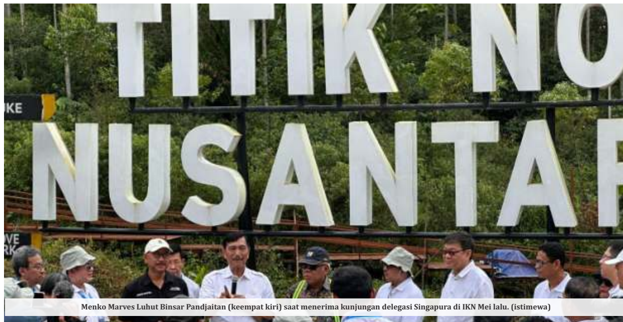
Menko Marves Luhut Binsar Pandjaitan (keempat dari kiri) saat menerima kunjungan delegasi Singapura di IKN Mei lalu.

JAKARTA - Tugas Menteri Koordinator bidang Kemaritiman dan Investasi (Menko Marves) Luhut Binsar Pandjaitan makin bertumpuk. Terbaru, dia resmi memimpin satuan tugas percepatan perolehan tanah dan investasi Ibu Kota Negara (IKN) Nusantara.