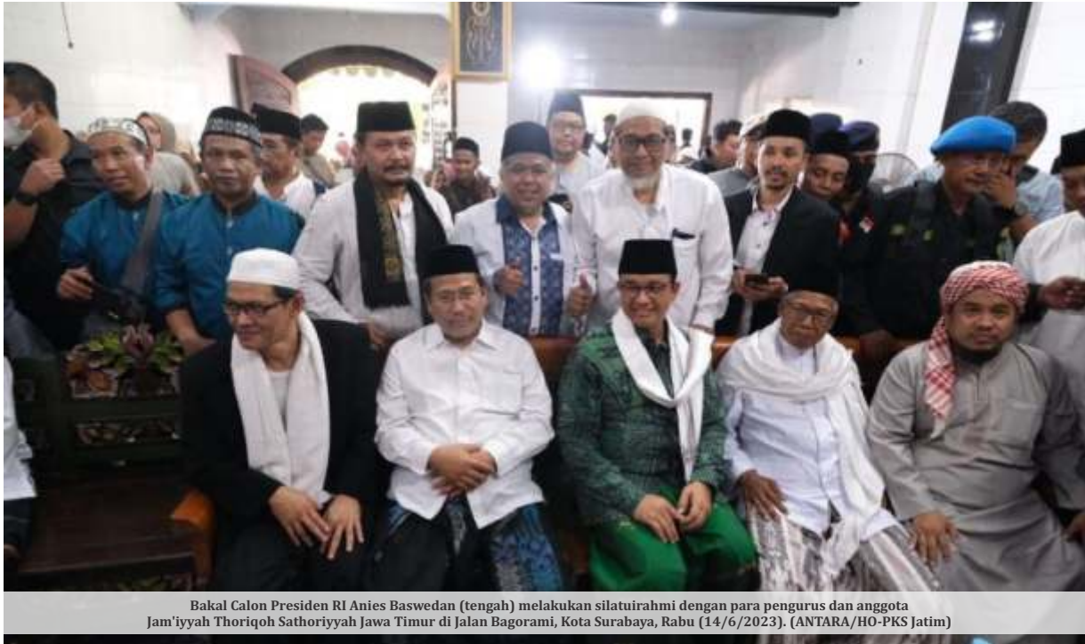
Bakal Calon Presiden RI Anies Baswedan (tengah) melakukan silaturahmi dengan para pengurus dan anggota Jam'iyah Thoriqoh Sathoriyyah Jawa Timur di Jalan Bagorami, Kota Surabaya, Rabu (14/6/2023).

SURABAYA - Bacapres Anies Baswedan mendapat dukungan dari Jam'iyah Thoriqoh Syathoriyah An Nadhliyah dan Bu Nyai pengasuh pondok pesantren (ponpes) se-Jatim. Hal itu tertuang saat kunjungan ke Kota Surabaya, Rabu (14/6/2023).