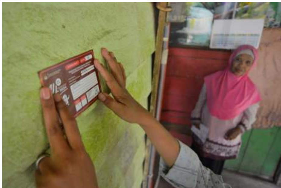
(Ilustrasi) Petugas Pemutakhiran Data Pemilih (Pantarlih) merupakan ujung tombak KPU dalam melakukan pemutakhiran dan pendaftaran Pemilih.

"Kalau memang merasa punya problem kan seharusnya mereka tinggal panggil KPU. Jadikan tindakan KPU sebagai tindakan pelanggaran pemilu," ujarnya.