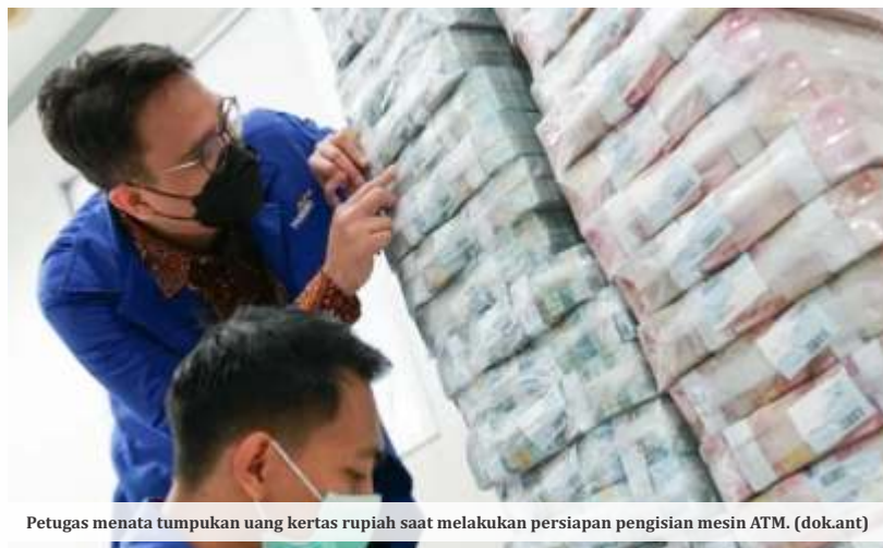
Petugas menata tumpukan uang kertas rupiah saat melakukan persiapan pengisian mesin ATM.

JAKARTA -Kementerian Keuangan (Kemenkeu) membenarkan utang pemerintah saat ini mencapai tingkat tertinggi sejak Indonesia merdeka pada 1945. Namun ditegaskan, Indonesia tak pernah mengalami gagal bayar utang atau default sepanjang sejarah.