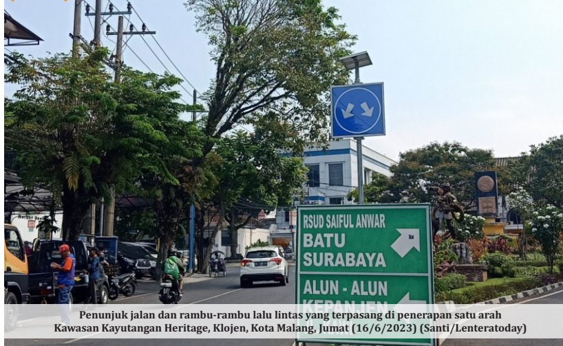
Penunjuk jalan dan rambu-rambu lalu lintas yang terpasang di penerapan satu arah Kawasan Kayutangan Heritage, Klojen, Kota Malang, Jumat (16/6/2023)