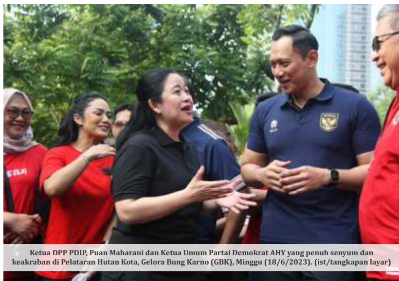
Ketua DPP PDIP, Puan Maharani dan Ketua Umum Partai Demokrat AHY yang penuh senyum dan keakraban di Pelataran Hutan Kota, Gelora Bung Karno (GBK), Minggu (18/6/2023).

JAKARTA -Ketua DPP PDIP, Puan Maharani bertemu dengan Ketua Umum Partai Demokrat, Agus Harimurti Yudhoyono (AHY) di Hutan Kota Plataran, Senayan, Jakarta, pagi tadi (18/6/2023). Demokrat sendiri mengakui ini menjadi langkah rekonsiliasi setelah hampir 20 tahun 'kebekuan'. Namun kalangan pengamat menilai ada juga kemungkinan hanya basa-basi politik.