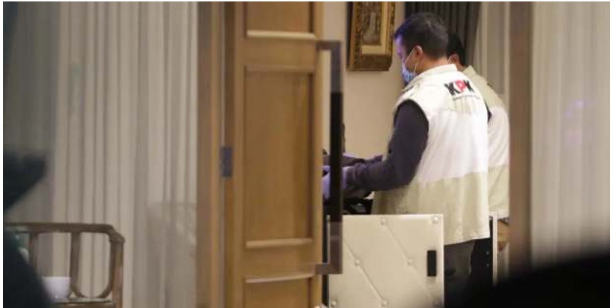
Penyidik KPK saat mengeledah kantor Kementerian ESDM terkait dugaan korupsi tunjangan kinerja (Tukin) beberapa waktu lalu. (dok.ist)

Adapun naiknya penyidikan kasus tersebut dibenarkan oleh pihak pelapor. "Benar. Saya dapat kabar itu saat diperiksa hari Senin di Polda Metro," kata Wakil Ketua Lembaga Pengawasan, Pengawalan, dan