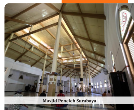
Masjid Peneleh Surabaya

Salah satu yang menjadi potensi persoalan nantinya adalah jika dalam satu masjid ada lebih dari satu marbot. Untuk itu harus dibuat ketentuan dan persyaratan detail sebagai penerima insentif agar masuk dalam kajian. (ADV)