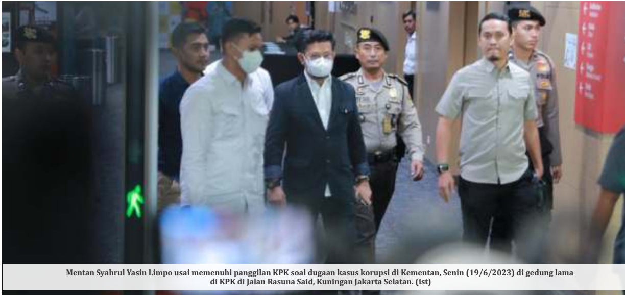
Mentan Syahrul Yasin Limpo usai memenuhi panggilan KPK soal dugaan kasus korupsi di Kementan, Senin (19/6/2023) di gedung lama di KPK di Jalan Rasuna Said, Kuningan Jakarta Selatan. (ist)

JAKARTA - Komisi Pemberantasan Korupsi (KPK) membantah mengistimewakan Menteri Pertanian Syahrul Yasin Limpo yang diperiksa di gedung KPK C1, Senin (19/6/2023). Ditegaskan, pemeriksaan tak dilakukan di gedung Merah Putih karena alasan teknis semata.