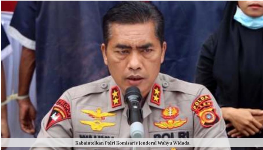
Kabinteltam Polri Komaris Jenderal Wahyu Widada.

SURABAYA – Untuk mengantisipasi gangguan keamanan dan ketertiban masyarakat menjelang dan saat Pemilihan Umum (Pemilu) 2024, Polri dalam hal ini Badan Intelijen dan Keamanan (Baintelkam) menyusun indeks potensi kerawanan jelang Pemilu 2024. Hasilnya, Jawa Timur (Jatim) dan Papua masuk dalam kategori sangat rawan.