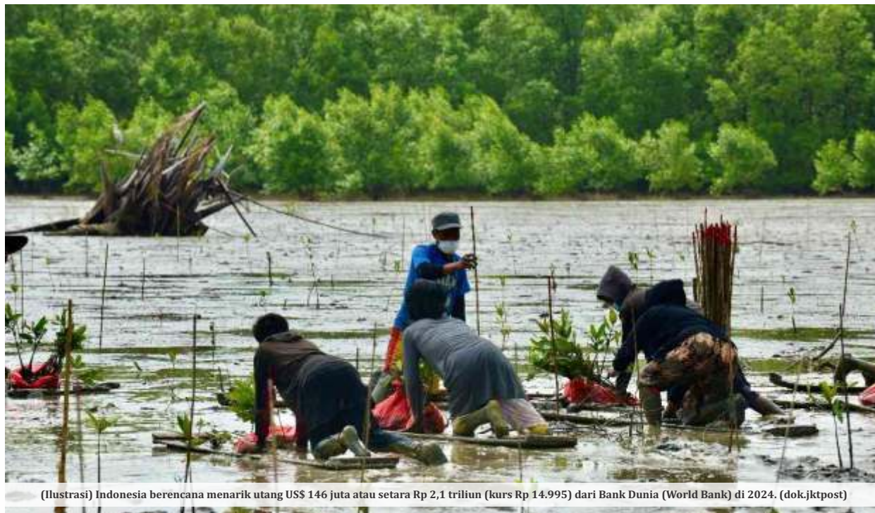
(Ilustrasi) Indonesia berencana menarik utang US$ 146 juta atau setara Rp 2,1 triliun (kurs Rp 14.995) dari Bank Dunia (World Bank) di 2024.

JAKARTA- Komisi XI DPR RI mengkritik pemerintahan yang berencana menarik utang US$ 146 juta atau setara Rp 2,1 triliun (kurs Rp 14.995) dari Bank Dunia (World Bank) di 2024. Pinjaman tersebut rencananya untuk program Mangrove for Coastal Resilience (M4CR).