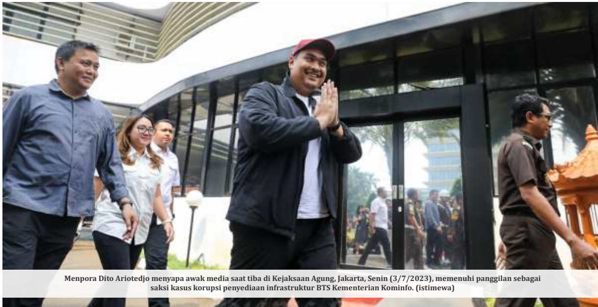
Menpora Dito Ariotedjo menepa awak media saat tiba di Kejaksaan Agung, Jakarta, Senin (3/7/2023), memenuhi panggilan sebagai saksi kasus korupsi penyedia infrastruktur BTS Kementerian Kominfo.

JAKARTA -Nama Menteri Pemuda dan Olahraga Dito Ariotedjo terseret dalam kasus dugaan korupsi proyek BTS Bakti Kominfo. Dalam kasus itu, mantan Menkominfo sekaligus politisi NasDem, Johnny G Plate, didakwa menerima aliran uang hingga Rp 17 miliar.