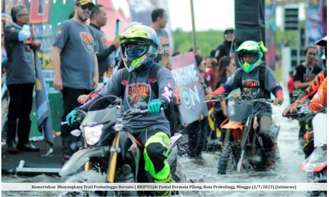
Kemeriahan Bhayangkara Trail Probolinggo Bersatu (BRIPTU) di Pantai Permata Pilang, Kota Probolingg, Minggu (2/7/2023). (istimewa)

PROBOLINGGO- Dalam rangka menguatkan sport tourism (wisata olahraga) di Provinsi Jawa Timur (Jatim), Dinas Kebudayaan dan Pariwisata (Disbudpar) Jatim bekerjasama dengan Polres Probolinggo Kota menggeber Bhayangkara Trail Probolinggo Bersatu (BRIPTU). Acara dilangsungkan di Pantai Permata Pilang, Kota Probolingg, Minggu (2/7/2023).