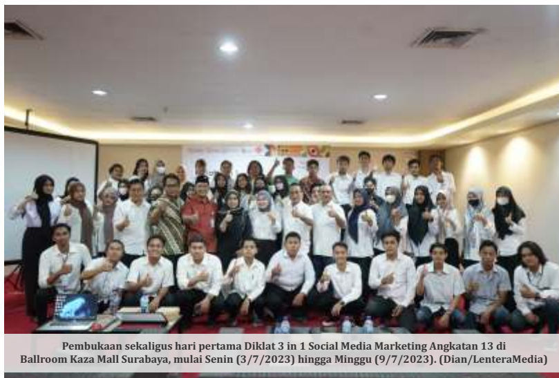
Pembukaan sekaligus hari pertama Diklat 3 in 1 Social Media Marketing Angkatan 13 di Ballroom Kaza Mall Surabaya, mulai Senin (3/7/2023) hingga Minggu (9/7/2023).

Meskipun diklat ini hanya berlangsung selama 7 hari ke depan, namun ia tidak ingin hubungannya dengan peserta hanya terjalin selama sepekan. Akan ada kelompok atau komunitas yang dibangun, sehingga