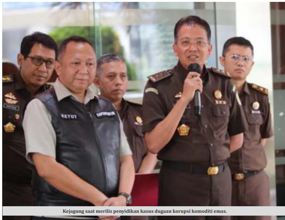
Kejagung saat merilis penyidikan kasus dugaan korupsi komoditi emas.

Untuk diketahui, PT UBS singkatan PT Untung Bersama Sejahtera,