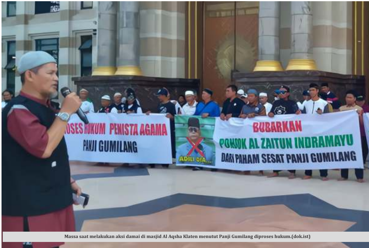
Massa saat melakukan aksi damai di masjid Al Aqsha Klaten menuntut Panji Gumilang diproses hukum.

JAKARTA -Pusat Pelaporan dan Analisis Transaksi Keuangan (PPATK) mengakui telah membekukan ratusan rekening terkait dengan pemimpin Pondok Pesantren Al Zaytun, Panji Gumilang. Mengejutkannya, ditemukan sekitar 256 rekening milik Panji Gumilang yang menggunakan enam nama berbeda.