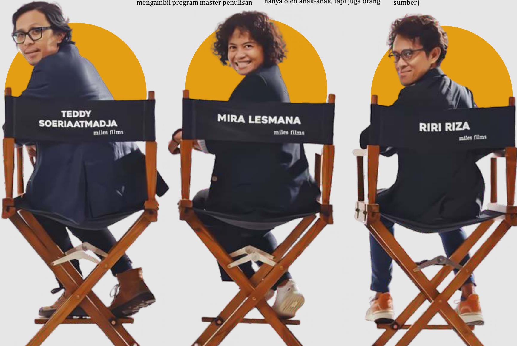
Sosok di balik layar Petualangan Sherina 2

Film Petualangan Sherina dan Ada Apa Dengan Cinta juga menjadi tanda kebangkitan kembali perfilman Indonesia. Sama seperti Ada Apa Dengan Cinta, Petualangan Sherina juga akan dibuat sekuelnya (berbagai sumber)