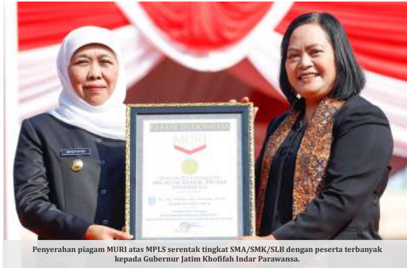
Penyerahan piagam MURI atas MPLS serentak tingkat SMA/SMK/SLB dengan peserta terbanyak kepada Gubernur Jatim Khofifah Indar Parawansa.

"Penguatan karakter dibutuhkan agar siswa taat pada Allah, Tuhan Yang Maha Kuasa, taat kepada orang tua dan taat kepada guru. Bahkan Rasulullah juga bersabda, bukan umatku kalau yang muda tidak