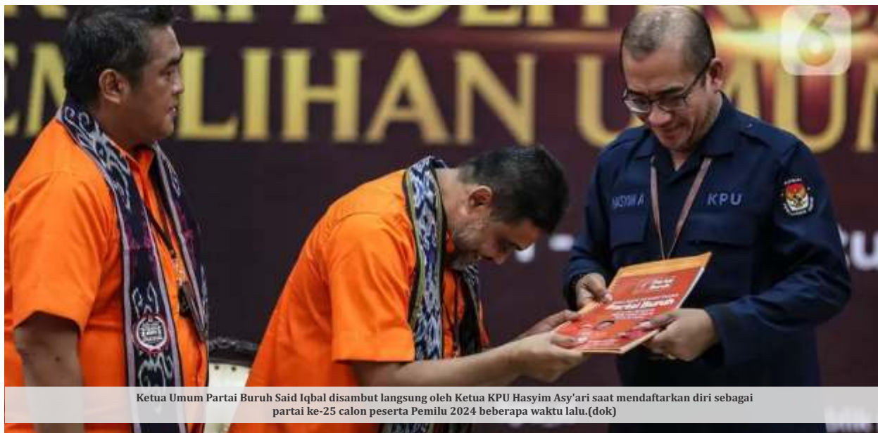
Ketua Umum Partai Buruh Said Iqbal disambut langsung oleh Ketua KPU Hasyim Asy'ari saat mendaftarkan diri sebagai partai ke-25 calon peserta Pemilu 2024 beberapa waktu lalu.

JAKARTA – Komisi Pemilihan Umum (KPU) meminta Partai Buruh untuk fokus mengurus dokumen persyaratan bakal calon anggota legislatif (caleg). Hal ini disampaikan merespons Partai Buruh yang menuding KPU RI dan KPU daerah tidak sinkron dalam proses penyusunan daftar calon sementara (DCS).