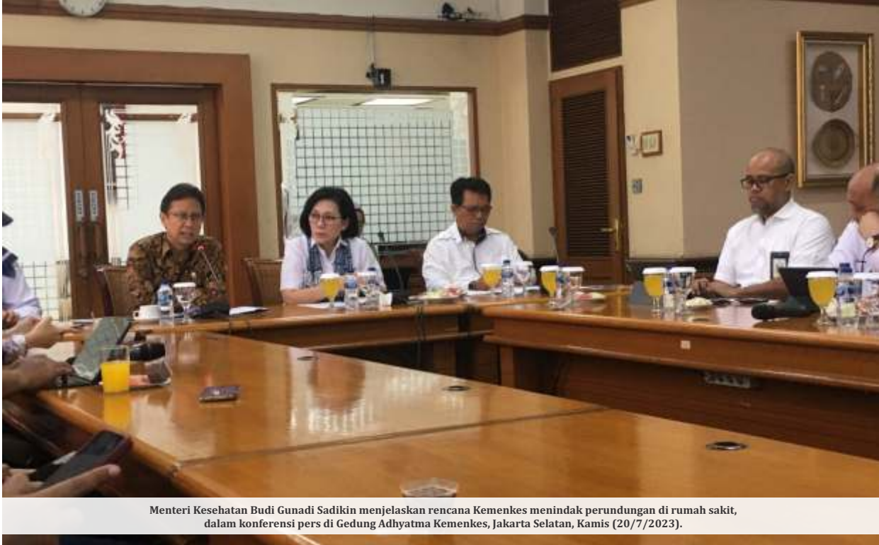
Menteri Kesehatan Budi Gunadi Sadikin menjelaskan rencana Kemenkes menindak perundungan di rumah sakit, dalam konferensi pers di Gedung Adhyatma Kemenkes, Jakarta Selatan, Kamis (20/7/2023).

JAKARTA- Menteri Kesehatan (Menkes) Budi Gunadi Sadikin mengatakan kasus bullying atau perundungan dalam program pendidikan dokter spesialis (PPDS) sudah terjadi puluhan tahun. Perundungan senior terhadap dokter junior sudah dianggap sebagai 'tradisi'.