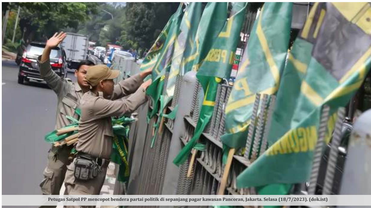
Petugas Satpol PP mencopot bendera partai politik di sepanjang pagar kawasan Pancoran, Jakarta. Selasa (18/7/2023).

JAKARTA - Tudingan ada aliran dana korupsi dari proyek pengadaan infrastruktur jaringan internet 4G ke partai politik membuat gerah. Diketahui, kasus tersebut menyeret Sekjen DPP Partai NasDem.