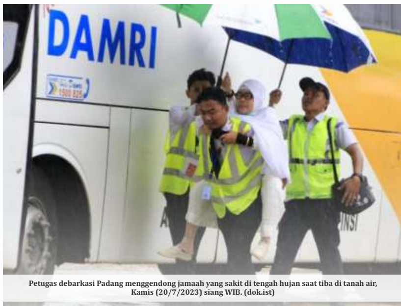
Petugas debarokasi Padang menggendong jamaah yang sakit di tengah hujan saat tiba di tanah air, Kamis (20/7/2023) siang WIB.

Ke depan, Kemenag dan Kemenkes akan memfokuskan masalah istitha'ah kesehatan. Bagi jamaah haji yang tidak lolos tes kesehatan, tidak diperkenankan untuk berangkat dan melunasi biaya perjalanan ibadah haji (Bipih).