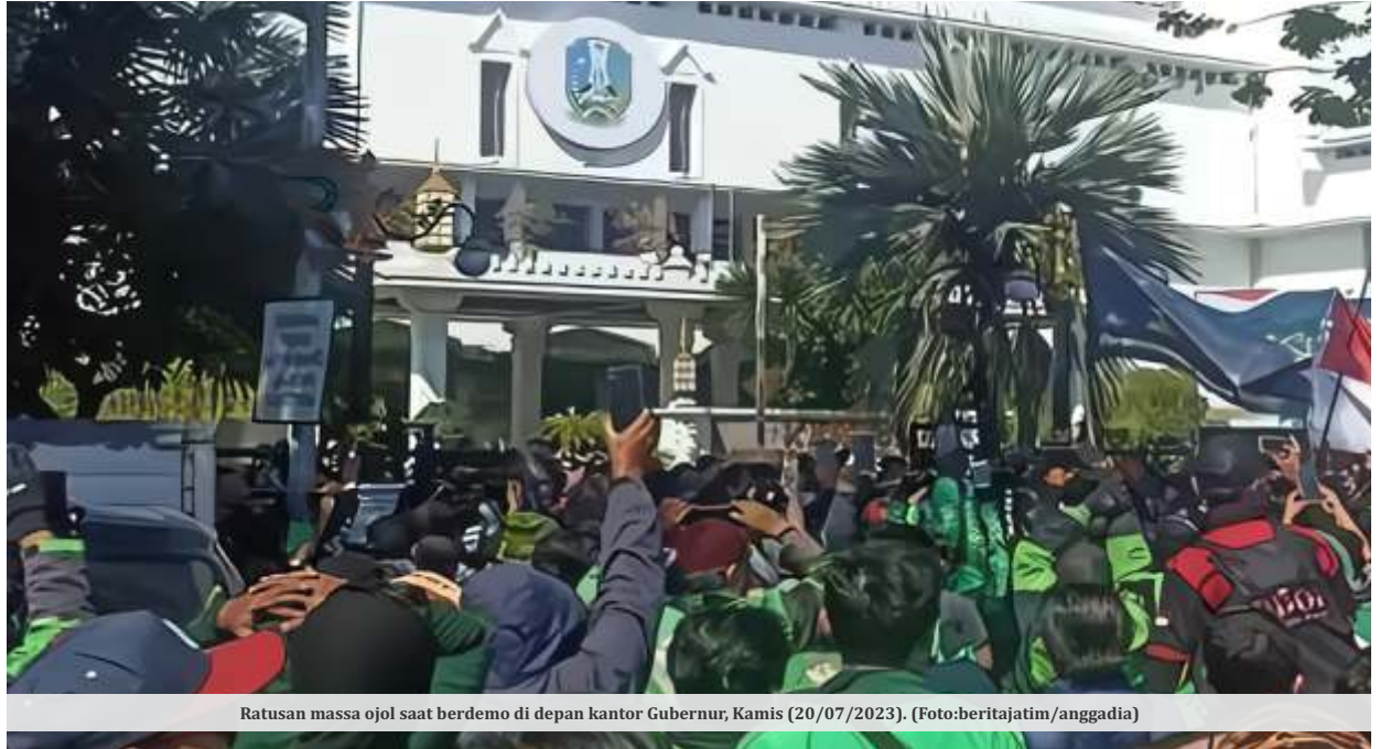
Ratusan massa ojol saat berdemo di depan kantor Gubernur, Kamis (20/07/2023).