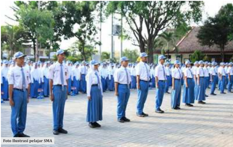
Foto Ilustrasi pelajar SMA

SURABAYA – Pemprov Jawa Timur mengambil keputusan tegas terkait polemik penjualan seragam SMAN di Tulungagung yang harganya mahal. Gubernur Jawa Timur, Khofifah Indar Parawansa, mengatakan telah memecat kepala SMA tersebut.