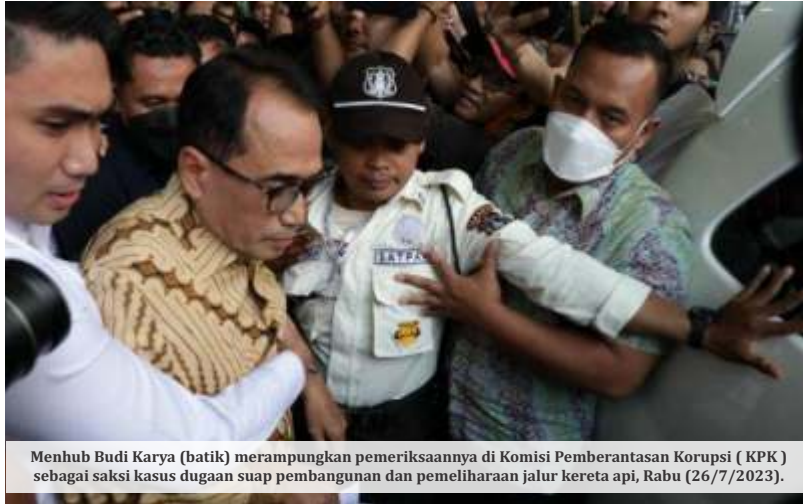
Menhub Budi Karya (batik) merampungkan pemeriksaannya di Komisi Pemberantasan Korupsi (KPK) sebagai saksi kasus dugaan suap pembangunan dan pemeliharaan jalur kereta api, Rabu (26/7/2023).

KPK mengapresiasi kehadiran Menteri Perhubungan Budi Karya Sumadi sebagai saksi. "Kami mengapresiasi kehadiran tiap saksi yang dipanggil tim penyidik KPK sehingga akan menjadi jelas dan terang perbuatan para tersangka yang saat ini sedang dilakukan proses penyidikannya," ujar Kepala Bagian Pemberitaan KPK Ali Fikri di Gedung Pusat Edukasi Antikorupsi C1 atau Kantor Dewas KPK, Jakarta, Rabu