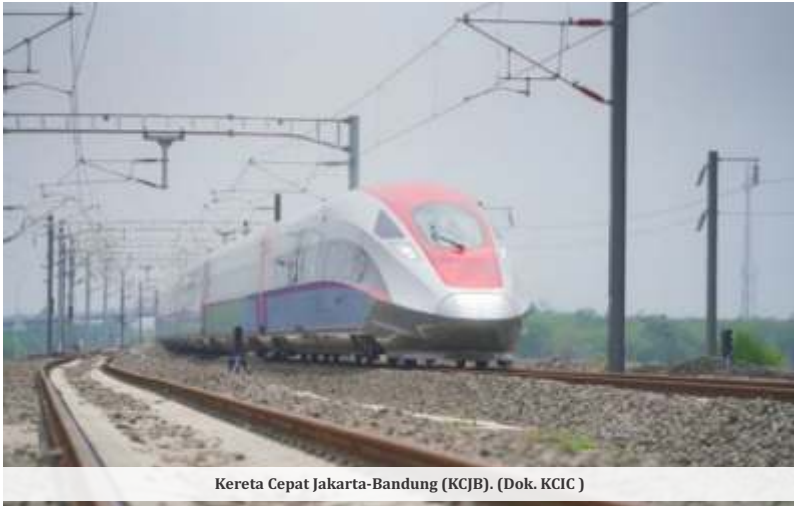
Kereta Cepat Jakarta-Bandung (KCJB).

JAKARTA - Pemerintah melalui Komite Percepatan Penyediaan Infrastruktur Prioritas (KPPIP) telah memutuskan untuk membatalkan proyek Kereta Cepat Jakarta-Surabaya dari Proyek Strategis Nasional (PSN). Ada sejumlah alasan yang bikin mega proyek tersebut dihentikan alias tak lanjut, salah satunya mahal.