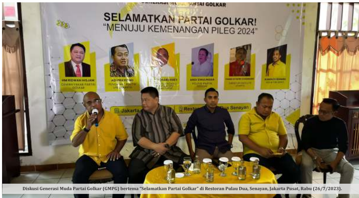
Diskusi Generasi Muda Partai Golkar (GMPG) bertema "Selamatkan Partai Golkar" di Restoran Pulau Dua, Senayan, Jakarta Pusat, Rabu (26/7/2023).

JAKARTA-Ketua DPP Partai Golkar Dave Laksono membantah keterlibatan Airlangga Hartarto dalam keributan yang terjadi pada agenda diskusi Generasi Muda Partai Golkar (GMPG) bertajuk 'Selamatkan Partai Golkar! Menuju Kemenangan Pileg 2024'. Agenda yang berlangsung di Restoran Pulau Dua, Senayan, Jakarta Pusat, Rabu (26/7/2023) dinilai liar karena tak dijadwalkan Sekretaris Jenderal.