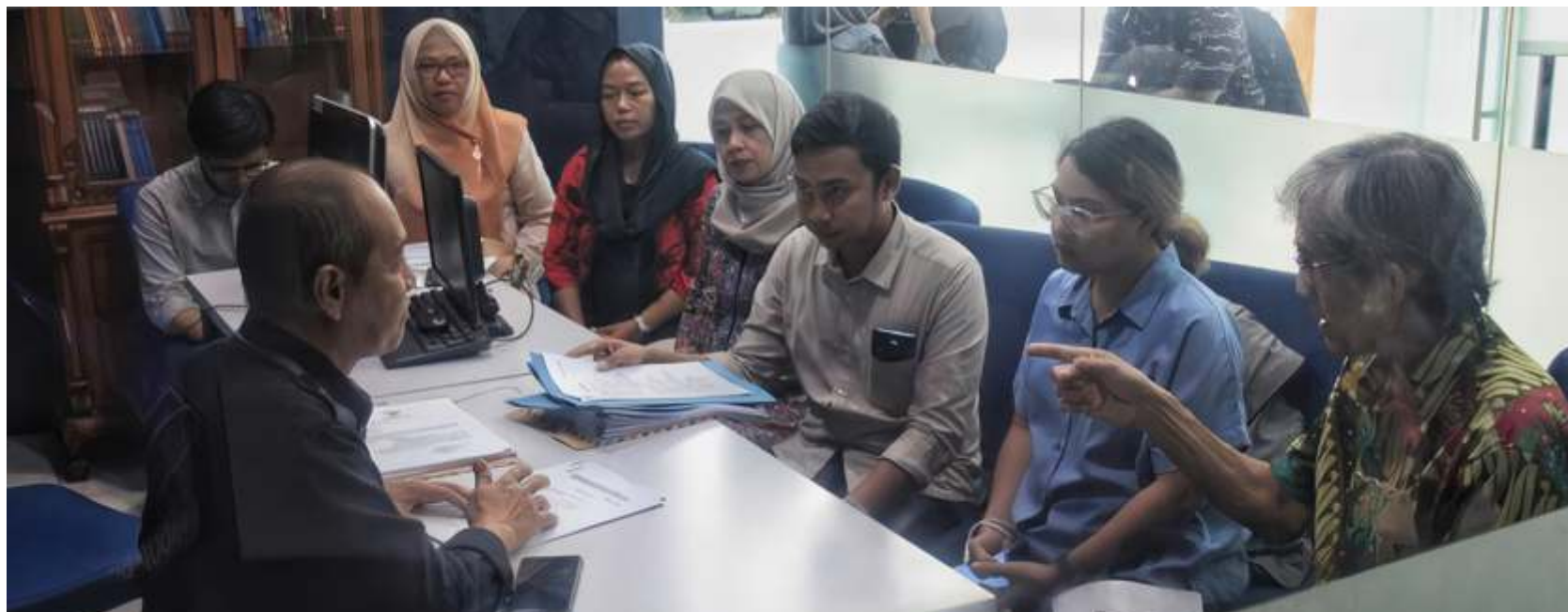
Masyarakat Peduli Keterwakilan Perempuan mengadakan Peraturan KPU (PKPU) nomor 10/2023 khususnya pasal 8 ayat (2) ke DKPP, Selasa (15/8/2023).

JAKARTA -Lagi-lagi Komisi Pemilihan Umum (KPU) dilaporkan ke Dewan Kehormatan Penyelenggara Pemilu (DKPP). Terbaru, sejumlah elemen masyarakat dan pemerhati Pemilu yang tergabung dalam Masyarakat Peduli Keterwakilan Perempuan mengadakan Peraturan KPU (PKPU) nomor 10/2023 khususnya pasal 8 ayat (2). Mereka mengadukan KPU karena PKPU tersebut dianggap tidak sejalan dengan UU 7/2017 tentang Pemilu.