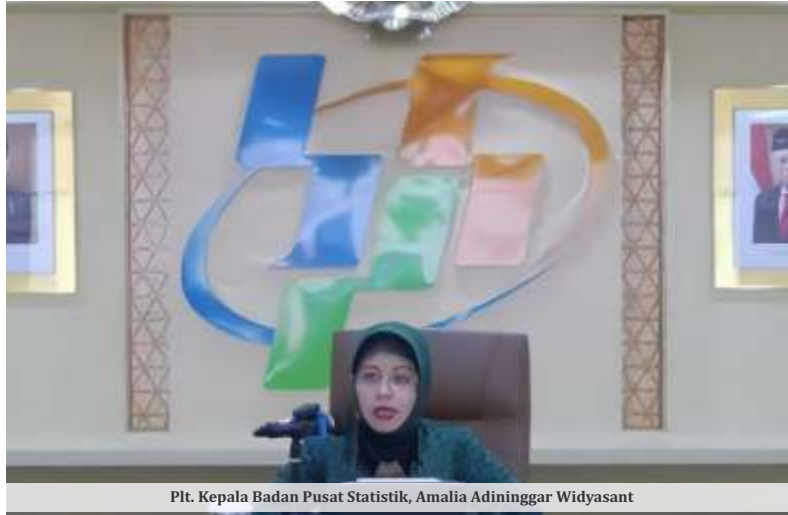
Plt. Kepala Badan Pusat Statistik, Amalia Adininggar Widyasanti

"Jadi artinya ekonomi kita di tengah-tengah ketidakpastian masih relatif resilien berdaya tahan dan masih solid," ucap wanita yang juga