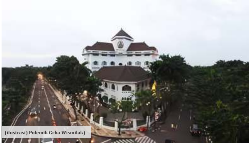
(ilustrasi) Polemik Grha Wismilak

SURABAYA – Kasus gedung wismilak terus bergulir, Polda Jatim mengaku sudah mengantongi tiga nama calon tersangka yang diduga melakukan pemalsuan akta otentik dan korupsi pada penerbitan Hak Guna Bangunan (HGB) tanah dan bangunan di Gedung Wismilak Surabaya.