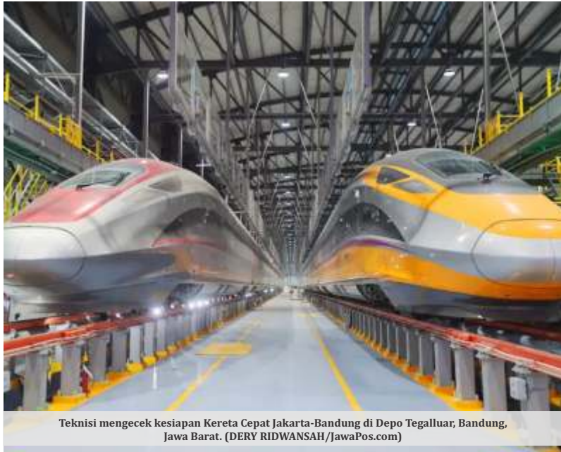
Teknisi mengecek kesiapan Kereta Cepat Jakarta-Bandung di Depo Tegalluar, Bandung, Jawa Barat.

JAKARTA - Ketua Bidang Perkeretaapian Masyarakat Transportasi Indonesia (MTI) Aditya Dwi Laksana membeberkan potensi pendapatan PT Kereta Cepat Indonesia China (KCIC). Pendapatan tersebut, kata dia, bisa menutupi biaya operasional dari Kereta Cepat Jakarta-Bandung (KCJB) tanpa harus mengandalkan subsidi pemerintah.