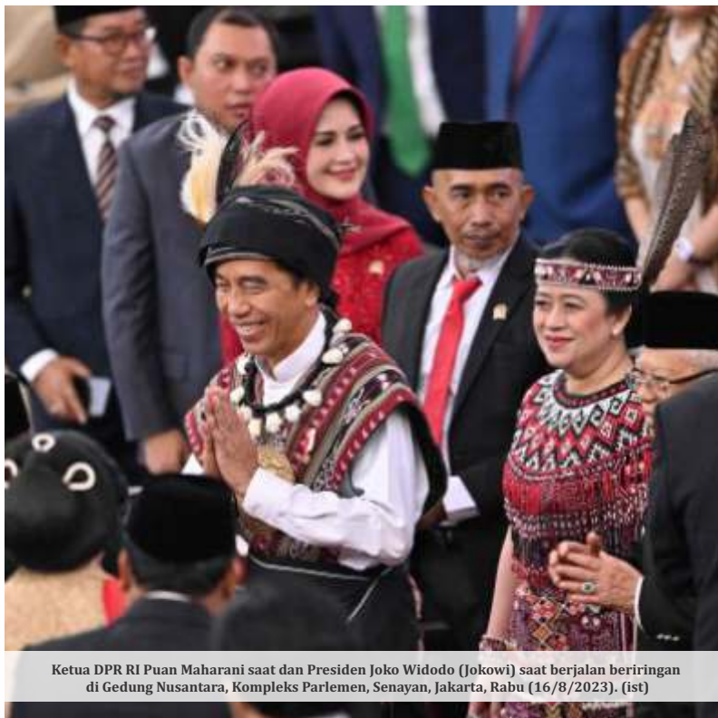
Ketua DPR RI Puan Maharani saat dan Presiden Joko Widodo (Jokowi) saat berjalan beringinan di Gedung Nusantara, Kompleks Parlemen, Senayan, Jakarta, Rabu (16/8/2023).

Ia enggan berkomentar lebih lanjut mengenai polemik tersebut dan