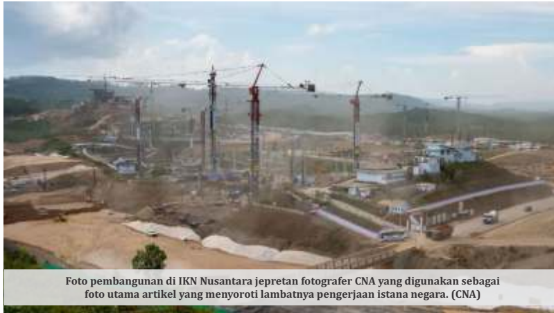
Foto pembangunan di IKN Nusantara jepretan fotografer CNA yang digunakan sebagai foto utama artikel yang menyoroti lambatnya pengerjaan istana negara. (CNA)

Diketahui, pemerintah menganggarkan Rp40,6 triliun untuk pembangunan Ibu Kota Negara Nusantara