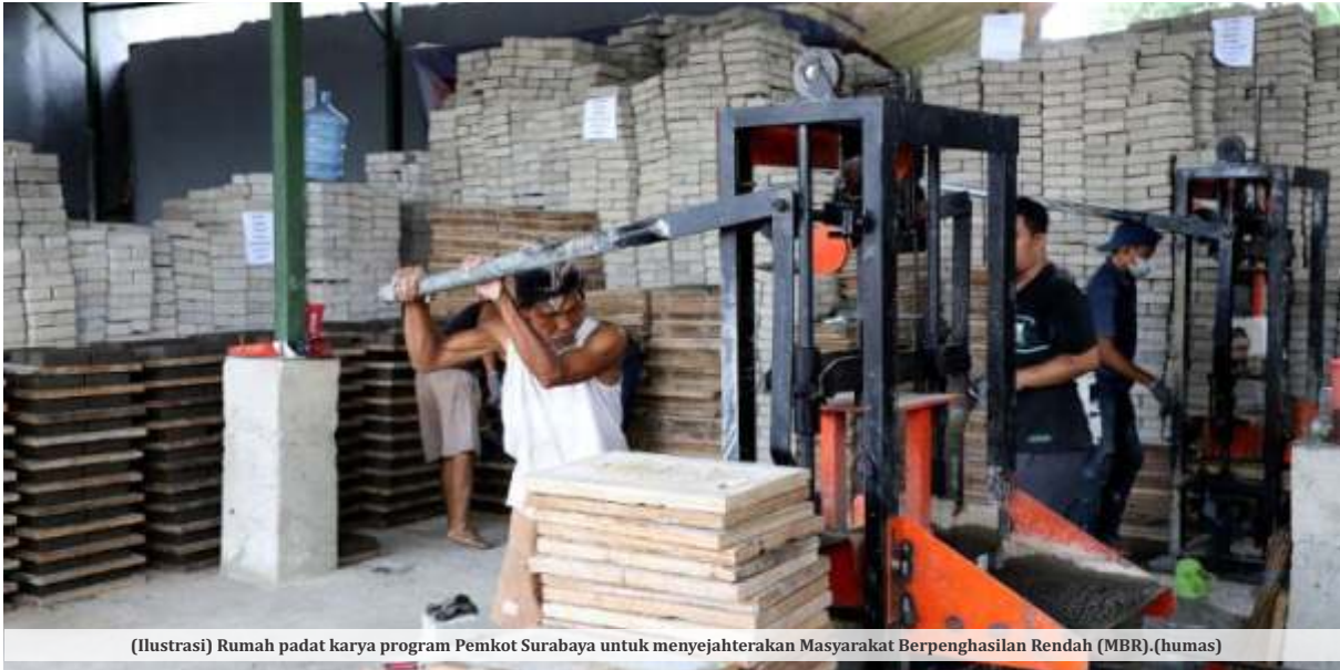
(Ilustrasi) Rumah padat karya program Pemkot Surabaya untuk menyejahterakan Masyarakat Berpenghasilan Rendah (MBR). (humas)

JAKARTA- Presiden Jokowi Widodo menargetkan angka kemiskinan turun dalam kisaran 6,5% hingga 7,5% pada tahun 2024 yang akan datang. Kalangan ekonom pun menilai hal itu terlalu ambisius. Pasalnya, ber-dasarkan daya yang ada, persentase penduduk miskin pada Maret 2023 sebesar 9,36% atau menurun 0,21% terhadap September 2022 dan menurun 0,18% terhadap Maret 2022.