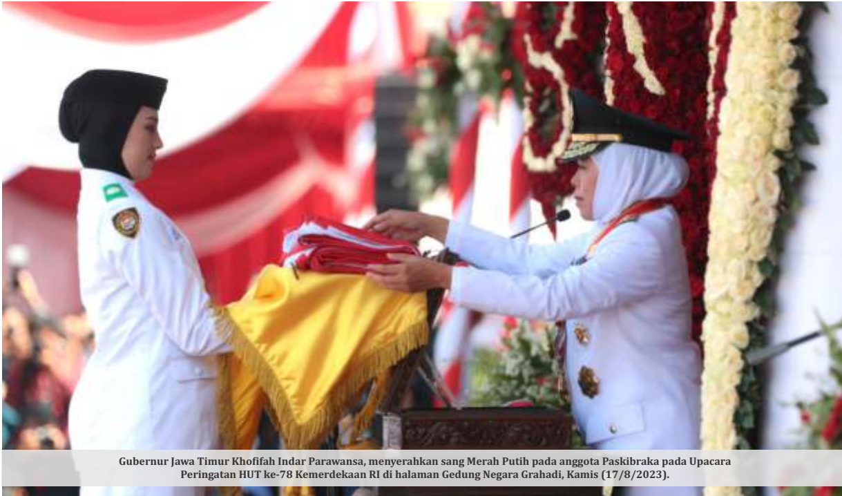
Gubernur Jawa Timur Khofifah Indar Parawansa, menyerahkan sang Merah Putih pada anggota Paskibraka pada Upacara Peringatan HUT ke-78 Kemerdekaan RI di halaman Gedung Negara Grahadi, Kamis (17/8/2023).

SURABAYA - Gubernur Jawa Timur Khofifah Indar Parawansa menyatakan optimismenya bahwa Provinsi Jawa Timur akan terus maju dan melaju menuju Indonesia Emas 2045. Optimisme tersebut sejalan dengan tema peringatan HUT ke-78 Kemerdekaan RI yakni 'Terus Melaju Untuk Indonesia Maju'.