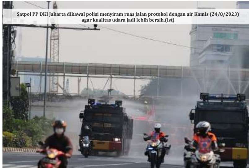
Satpol PP DKI Jakarta dikawal polisi menyiram ruas jalan protokol dengan air Kamis (24/8/2023) agar kualitas udara jadi lebih bersih. (ist)

Aplikasi pemantau kualitas udara Nafas Indonesia melaporkan tren yang 'cukup baik' Rabu (24/8/2023) sore pukul 17:26 WIB. Mayoritas wilayah DKI Jakarta dan sekitarnya berada di kategori kuning dan oranye. Kuning ditandai dengan kualitas udara moderat sementara oranye diartikan sensitif untuk sejumlah kelompok. Satu-satunya wilayah berwarna merah