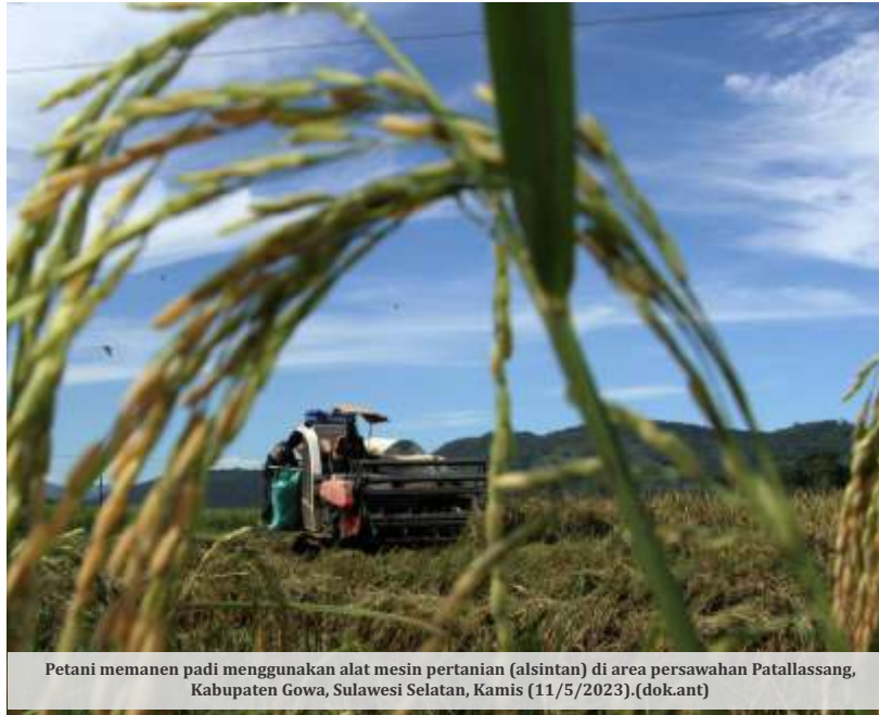
Petani memanen padi menggunakan alat mesin pertanian (alsintan) di area persawahan Patallassang, Kabupaten Gowa, Sulawesi Selatan, Kamis (11/5/2023).