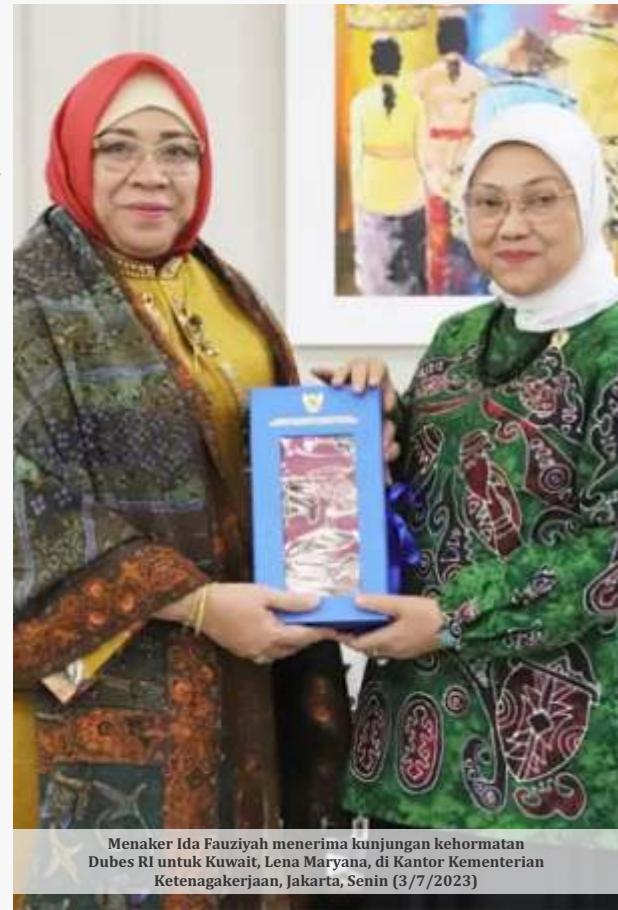
Menaker Ida Fauziyah menerima kunjungan kehormatan Dubes RI untuk Kuwait, Lena Maryana, di Kantor Kementerian Ketenagakerjaan, Jakarta, Senin (3/7/2023)