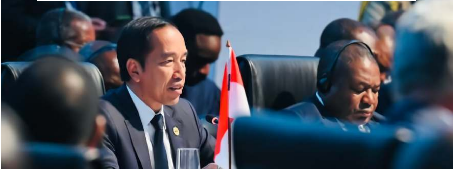
Presiden Joko Widodo (Jokowi) saat sesi BRICS-Africa Outreach and BRICS Plus Dialogue, Konferensi Tingkat Tinggi (KTT) BRICS ke-15 di Sandton Convention Center, Johannesburg, Republik Afrika Selatan, Kamis (24/8/2023).

PRETORIA- Presiden Republik Indonesia (RI) Joko Widodo (Jokowi) menghadiri forum Friends of BRICS Dialogue dalam rangkaian KTT BRICS di Afrika Selatan, Kamis (24/8/2023). Dalam sambutannya, Jokowi bicara soal kondisi dunia sekarang. Dia pun menyinggung soal hilirisasi di tanah air.