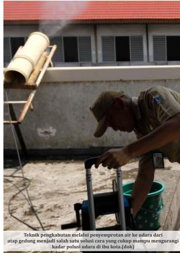
Teknik pengkabutan melalui penyemprotan air ke udara dari atap gedung menjadi salah satu solusi cara yang cukup mampu mengurangi kadar polusi udara di ibu kota. (dok)

Auriga Nusantara telah berhasil mengumpulkan beberapa fakta selama