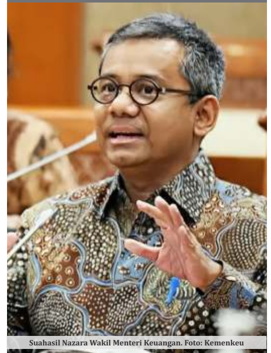
Suahasil Nazara Wakil Menteri Keuangan.

publik daerah yang penggunaannya telah ditentukan oleh pemerintah. (lut/ant/dya)