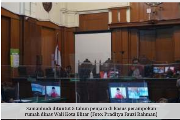
Samanhudi dituntut 5 tahun penjara di kasus perampokan rumah dinas Wali Kota Blitar

yang belum tertangkap ialah Huda untuk melakukan pencurian dengan kekerasan di rumah dinas walikota Blitar Santoso.