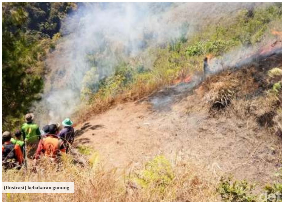
(Ilustrasi) kebakaran gunung

Saat ini, dirinya masih belum tahu apa yang menyebabkan kebakaran tersebut. Sampai Senin (4/9/2023) pukul 17.37 WIB, api masih belum padam. Asap putih dan coklat masih