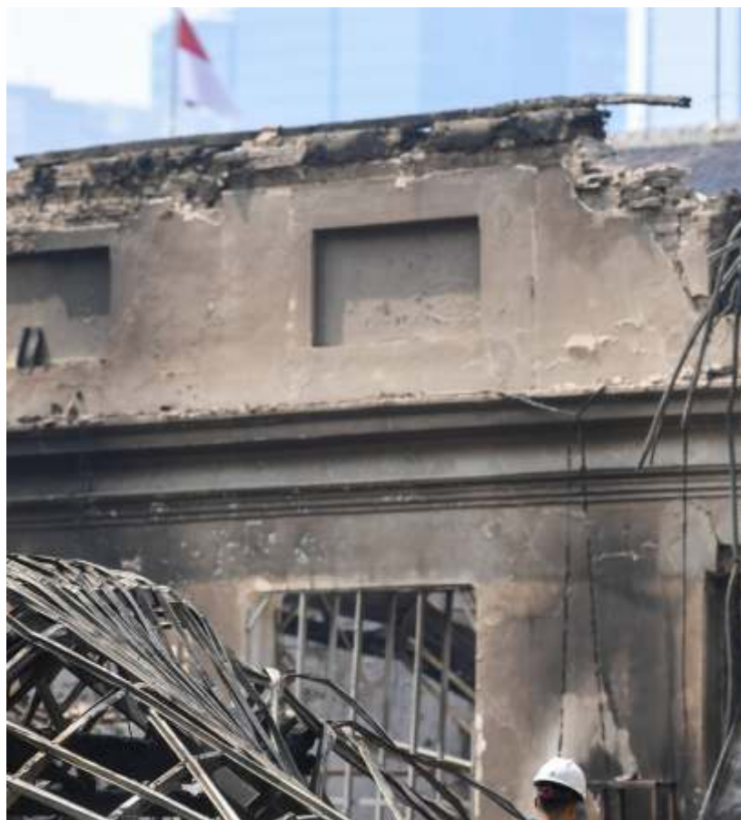
Anggota Laboratorium Forensik Polda Metro Jaya berjalan di area pasca kebakaran Museum Nasional atau Museum Gajah di Jakarta, Minggu (17/9/2023).

JAKARTA -Kebakaran di Museum Nasional sudah terkendali. Namun jumlah kerugian belum bisa diprediksi. Kebakaran melanda sebagian bangunan Museum Nasional atau Museum Gajah pada Sabtu (16/9/2023) pukul 20.08 WIB. Hanya dalam semalam, bangunan bersejarah itu hangus jadi abu.