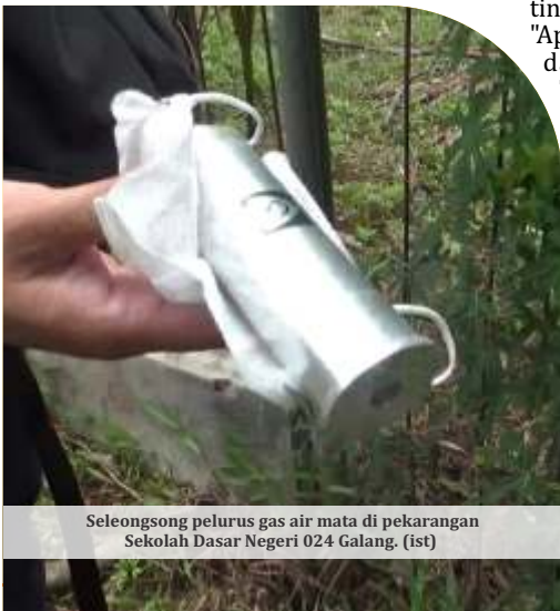
Selongsong peluru gas air mata di pekarangan Sekolah Dasar Negeri 024 Galang.