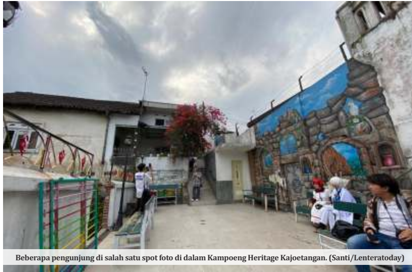
Beberapa pengunjung di salah satu spot foto di dalam Kampoeng Heritage Kajoetangan. (Santi/Lenteratoday)

"Jadi selama dua tahun itu kita benar-benar tutup tidak ada pengunjung atau wisatawan yang masuk. Setelah kita buka di tahun lalu tepatnya di bulan Juni 2022. Itu hanya ada 500