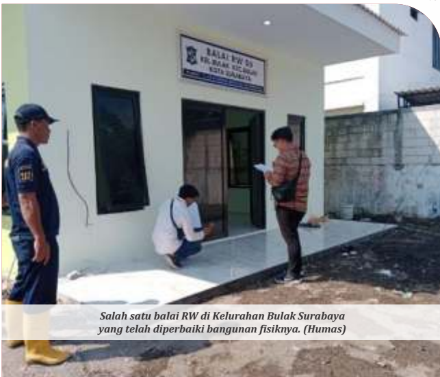
Salah satu balai RW di Kelurahan Bulak Surabaya yang telah diperbaiki bangunan fisiknya.

Jika dilakukan dengan maksimal, Reni yakin Surabaya akan terus bertumbuh jadi kota yang makin maju. IPM meningkat, kesejahteraan masyarakat terjamin. Tentu saja, visi Surabaya untuk gotong royong menjadi kota dunia yang maju, humanis, dan berkelanjutan bisa terwujud. (adv)