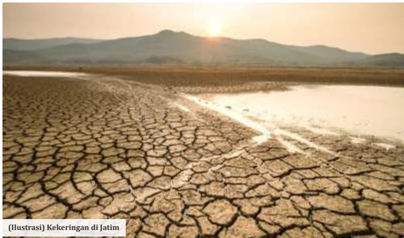
(Ilustrasi) Kekeringan di Jatim

Anung berpesan kepada seluruh masyarakat Jatim yang tinggal di daerah berstatus awas, siaga, maupun waspada kekeringan agar tetap melakukan langkah-langkah mitigasi untuk menghadapi kemungkinan