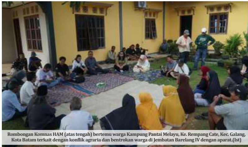
Rombongan Komnas HAM (atas tengah) bertemu warga Kampung Pantai Melayu, Ke. Rempang Cate, Kec. Galang, Kota Batam terkait dengan konflik agraria dan bentrokan warga di Jembatan Bareleng IV dengan aparat. (Ist)

Terlihat beberapa anggota Komnas HAM langsung mengamankan selongsong peluru gas air mata tersebut. "Itu (temuan selongsong peluru gas air mata) akan kami lakukan penyelidikan