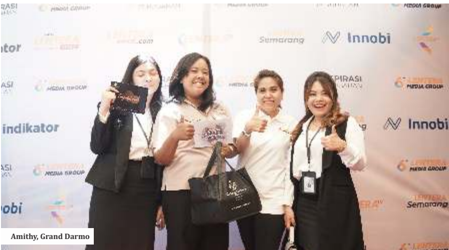
Amithy, Grand Darmo