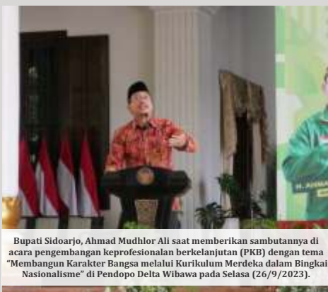
Bupati Sidoarjo, Ahmad Muhdlor Ali saat memberikan sambutannya di acara pengembangan keprofesionalan berkelanjutan (PKB) dengan tema "Membangun Karakter Bangsa melalui Kurikulum Merdeka dalam Bingkai Nasionalisme" di Pendopo Delta Wibawa pada Selasa (26/9/2023).

SIDOARJO - Bupati Sidoarjo Ahmad Muhdlor optimis akan mampu mencetak atlet unggul lewat sport science. Untuk itu, Pemkab Sidoarjo menggelar