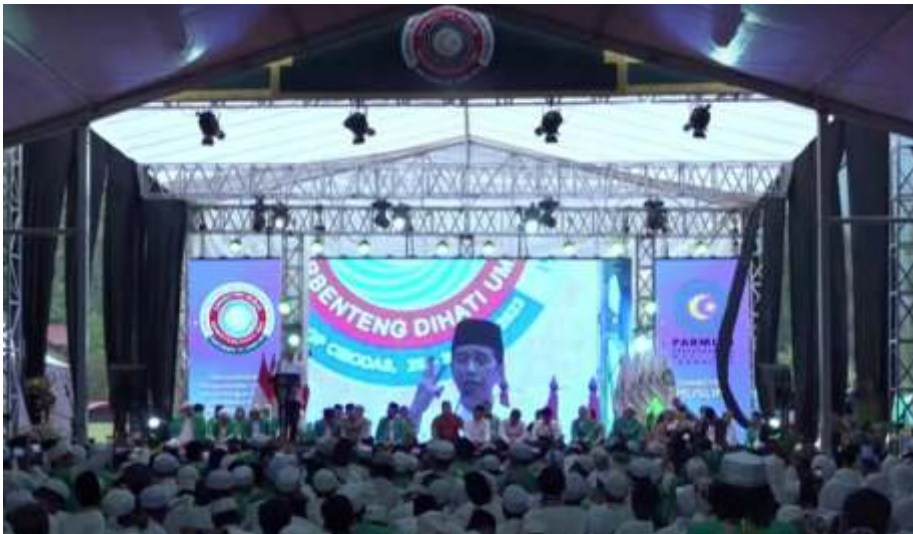
Presiden Joko Widodo menghadiri Pembukaan Jambore Nasional Dai Desa Madani Parmusi di Cianjur, Selasa (26/9/2023).

JAKARTA—Presiden menegaskan pentingnya pembangunan di desa. Sebab, pemerintah ingin membangun dari pinggiran. Ia mengungkapkan pemerintah menggelontorkan dana desa Rp 539 triliun sejak 2015 kepada 74.800 desa di seluruh Indonesia.