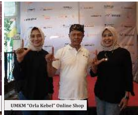
UMKM "Orla Kebel" Online Shop