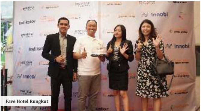
Fave Hotel Rungkut