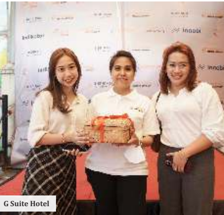
G Suite Hotel