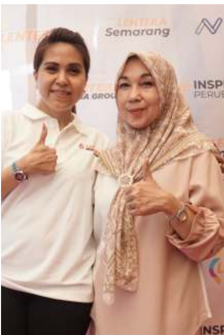
Praktisi Komunikasi dan Perhumasan