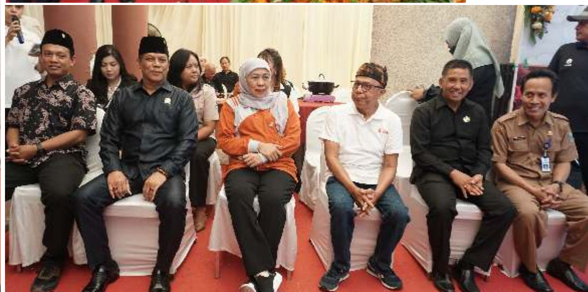
Kumpulan Foto-foto Gubernur Jawa Timur, Khofifah Indar Parawansa saat HUT ke-6 Lentera Media Group, Selasa (26/9/2023).