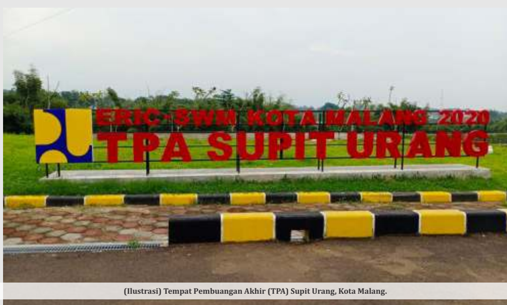
(Ilustrasi) Tempat Pembuangan Akhir (TPA) Supit Urang, Kota Malang.

MALANG - Dinas Lingkungan Hidup (DLH) Kota Malang tengah berencana untuk menghidupkan kembali potensi gas metan di Tempat Pembuangan Akhir (TPA) Supit Urang. Langkah ini