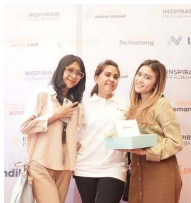
Artotel Town Square Surabaya