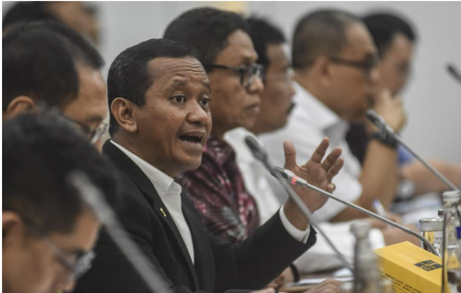
Menteri Investasi/Kepala Badan Koordinasi Penanaman Modal Republik Indonesia Bahlil Lahadalia saat Rapat Kerja dengan Komisi VI DPR RI di gedung Parlemen, Jakarta, Senin (2/10/2023).

JAKARTA—Debat sengit terjadi antara DPR RI dan Menteri Investasi/Kepala BKPM Bahlil Lahadalia saat Rapat Kerja Komisi VI DPR, Senin (2/10/2023). Para wakil rakyat mengungkapkan rumor bila pemerintah memberi perlakuan khusus kepada investor China terkait proyek Rempang Eco-City.