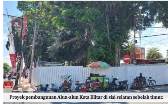
Proyek pembangunan Alun-alun Kota Blitar di sisi selatan sebelah timur.

Seperti diberitakan sebelumnya Pemkot Blitar menggelontorkan anggaran Rp 2,7 miliar, untuk mempercantik Alun-alun Kota Blitar sisi selatan pada 2023 ini. Pada 2019-2020 lalu, Pemkot Blitar juga sudah menggelontorkan dana sekitar Rp 4 miliar, untuk pembangunan jogging track, pagar dan Taman Jas Merah.