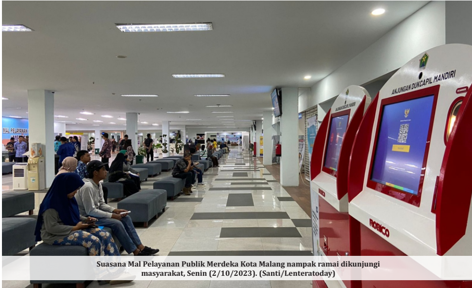
Suasana Mal Pelayanan Publik Merdeka Kota Malang nampak ramai dikunjungi masyarakat, Senin (2/10/2023).

MALANG - Pemerintah Kota (Pemkot) dan Pemerintah Kabupaten (Pemkab) Malang tengah merencanakan integrasi layanan publik melalui Mal Pelayanan Publik (MPP) Merdeka Kota Malang. Langkah tersebut bertujuan agar masyarakat mudah men-