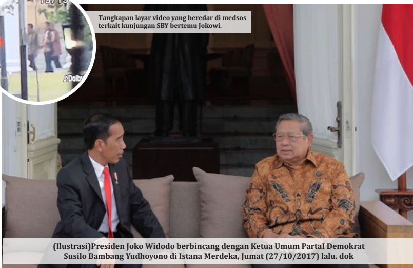
(Ilustrasi) Presiden Joko Widodo berbincang dengan Ketua Umum Partai Demokrat Susilo Bambang Yudhoyono di Istana Merdeka, Jumat (27/10/2017) lalu. dok

BOGOR – Ketua Majelis Tinggi Partai Demokrat Susilo Bambang Yudhoyono (SBY) mendadak menyambangi Presiden Joko Widodo (Jokowi) di Istana Bogor, Senin (2/10/2023). Melalui rekaman video diterima, SBY tiba sekira pukul 5 sore waktu setempat.