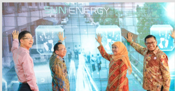
Gubernur Jawa Timur Khofifah Indar Parawansa menekan layar tanda peresmian PLTS atap di Tjiwi Kimia, Senin (2/10/2023).

SIDOARJO - Gubernur Jawa Timur Khofifah Indar Parawansa meresmikan Pembangkit Listrik Tenaga Surya (PLTS) Atap berkapasitas 9,8 Mega Watt peak (MWp) di kawasan PT. Pabrik Kertas Tjiwi Kimia, Kab. Sidoarjo, Senin (2/10/2023).