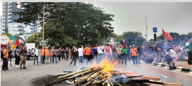
Massa buruh membakar kayu di depan Patung Kuda, Jalan Media Merdeka Barat usai hasil judicial review UU Ciptaker ditolak Mahkamah Konstitusi, Senin (2/10/2023). (ist)

JAKARTA - Mahkamah Konstitusi (MK) menolak 5 perkara yang menggugat Undang-Undang Nomor 6 Tahun 2023 tentang Penetapan Peraturan Pemerintah Pengganti Undang-Undang Nomor 2 Tahun 2022 tentang Cipta Kerja Menjadi Undang-Undang (UU Cipta Kerja).