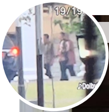
Tangkapan layar video yang beredar di medsos terkait kunjungan SBY bertemu Jokowi.