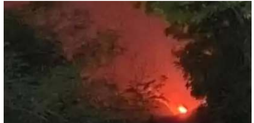
Kebakaran terjadi di lereng Gunung Argopuro Jember, 5 Oktober 2023 malam.

Sebelumnya diberitakan, Total sudah 1.990 hektar hutan Gunung Lawu rusak terbakar per 4 Oktober 2023. Tak hanya Ngawi, jumlah itu