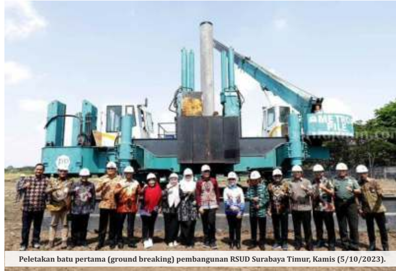
Peletakan batu pertama (ground breaking) pembangunan RSUD Surabaya Timur, Kamis (5/10/2023).

"Dengan ground breaking hari ini, maka Insyaallah warga Surabaya kalau