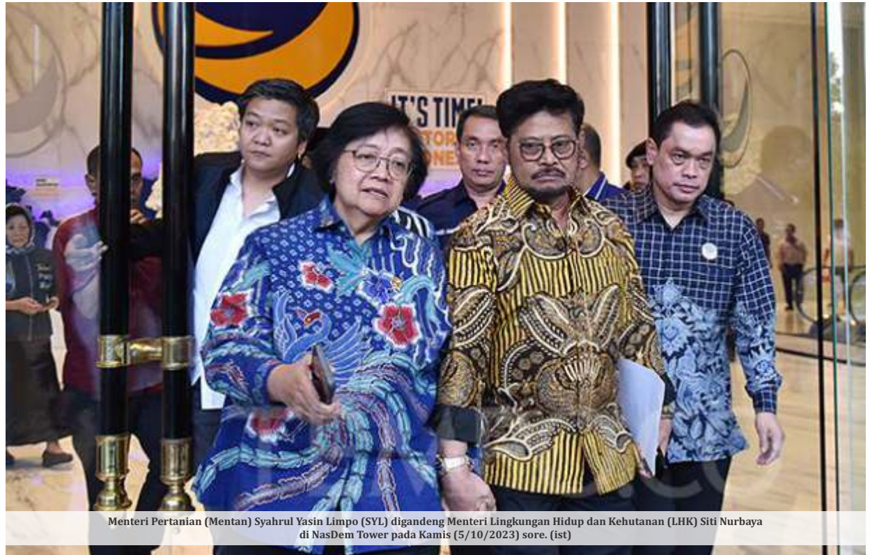
Menteri Pertanian (Mentan) Syahrul Yasin Limpo (SYL) digandeng Menteri Lingkungan Hidup dan Kehutanan (LHK) Siti Nurbaya di NasDem Tower pada Kamis (5/10/2023) sore.

Dalam penyelidikan ini, polisi memintai klarifikasi sejumlah pihak. Permintaan keterangan ini dilakukan sejak 24 Agustus-3 Oktober. "Terakhir tadi, bapak menteri pertanian sore tadi tiba di ruang pemeriksa Subdit Tipikor Ditreskrimsus Polda Metro Jaya untuk memberikan klarifikasi," katanya.