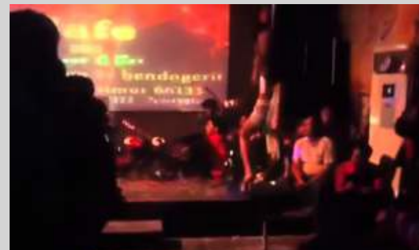
Salah satu tempat karaoke di Kabupaten Blitar

"Kami juga melakukan monitoring dan evaluasi. Namun kami hanya melakukan pengawasan dan pembinaan bagi pengusaha karaoke yang terdaftar NIB. Kami menagih komitmen yang ada dalam perizinannya," ungkapnya.