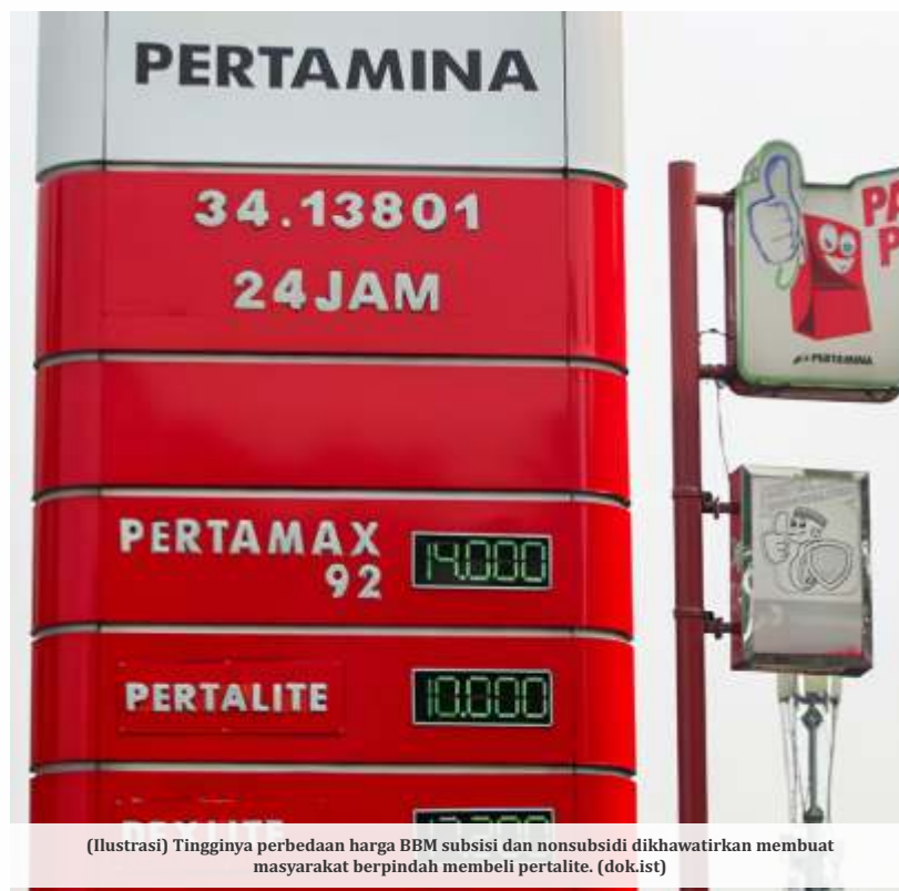
(Ilustrasi) Tingginya perbedaan harga BBM subsidi dan nonsubsidi dikhawatirkan membuat masyarakat berpindah membeli peralite.

JAKARTA -Selisih harga BBM Nonsubsidi dan BBM subsidi semakin jauh. Saat ini, disparitas antara keduanya sebesar Rp 4.000. DPR RI mengingatkan pemerintah mengantisipasi stok peralite karena masyarakat berpotensi melakukan migrasi