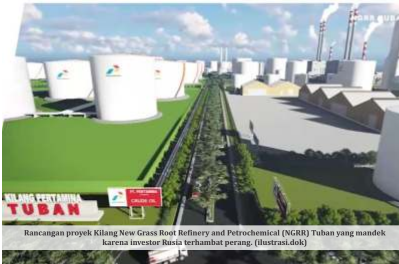
Rancangan proyek Kilang New Grass Root Refinery and Petrochemical (NGRR) Tuban yang mandek karena investor Rusia terhambat perang.

JAKARTA- Situasi geopolitik usai Rusia menginvasi Ukraina, membuat negara tersebut banyak dikucilkan. Tak hanya itu, aliran investasinya pun mandek. Hal itu diakui Menko Perekonomian Airlangga Hartarto saat menjelaskan terhambatnya proyek Kilang New Grass Root Refinery and Petrochemical (NGRR) Tuban. Pemerintah berencana segera mencari investor baru yang siap merealisasikan suntuikan dananya.