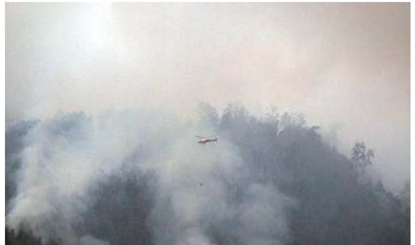
Helikopter Badan Nasional Penanggulangan Bencana (BNPB) melakukan waterbooming di Gunung Lawu di Jenawi, Karanganyar, Jawa Tengah, Jumat (6/10/2023) lalu.

Berdasarkan pemetaan BMKG, ada 7 kabupaten di Riau yang sangat mudah terjadi kebakaran lahan. Daerah itu adalah Indragiri Hulu, Indragiri Hilir, Pelalawan, Kampar, Bengkalis, Kuantan Singingi dan Rokan Hulu.