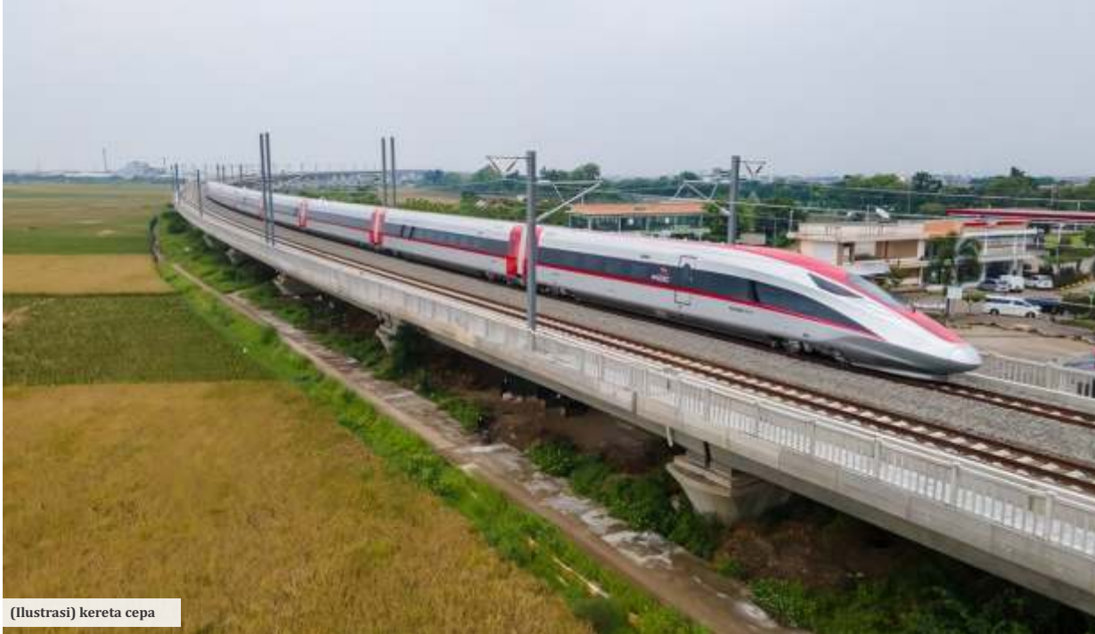
(Ilustrasi) kereta cepa

SURABAYA – Kereta cepat Jakarta – Surabaya yang saat ini sedang dirancang oleh tim dari Departemen Desain Produk Industri Institut Teknologi Sepuluh November (ITS), Badan Riset dan Inovasi Nasional (BRIN), PT Industri Kereta Api (Persero) atau PT INKA, dan Lembaga Pengelola Dana Pendidikan (LPDP) diperkirakan akan mampu mempersingkat waktu perjalanan cukup banyak. Pasalnya, Jakarta – Surabaya bisa ditempuh dengan waktu 3 jam 40 menit saja.