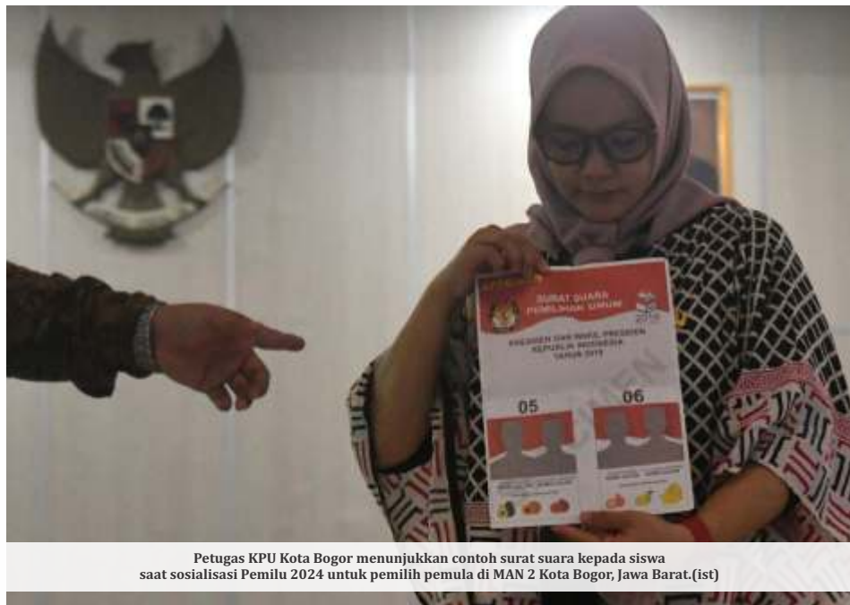
Petugas KPU Kota Bogor menunjukkan contoh surat suara kepada siswa saat sosialisasi Pemilu 2024 untuk pemilih pemula di MAN 2 Kota Bogor, Jawa Barat.