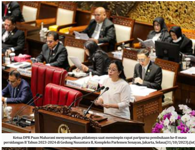
Ketua DPR Puan Maharani menyampaikan pidatonya saat memimpin rapat paripurna pembukaan ke-8 masa persidangan II Tahun 2023-2024 di Gedung Nusantara II, Kompleks Parlemen Senayan, Jakarta, Selasa (31/10/2023).

Pertama adalah peningkatan pemahaman (awareness) masyarakat luas dan utamanya kelompok risiko tinggi. maka harus isolasi sampai semua kelainan kulitnya hilang dan sudah tumbuh kulit baru yang bebas lesi kulit," terangnya.