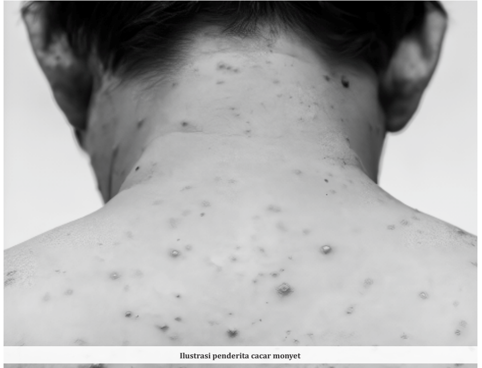
Ilustrasi penderita cacar monyet

Risiko penularan HIV bisa meningkat karena pola perilaku seks bebas atau seks berisiko yang tren di kalangan dewasa muda, anak dan remaja. Oleh karenanya, penyebaran virus pun terus terjadi, diikuti dengan