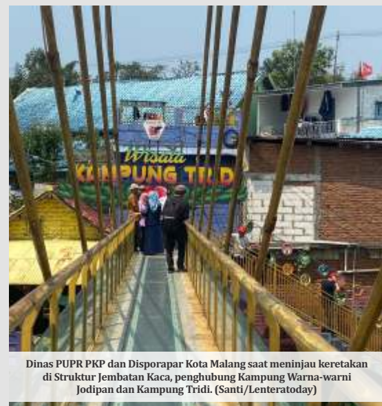
Dinas PUPR PKP dan Disporapar Kota Malang saat meninjau keretakan di Struktur Jembatan Kaca, penghubung Kampung Warna-warni Jodipan dan Kampung Tridi.

"Dengan kejadian jembatan kaca yang pecah di Banyumas, Jawa Tengah.