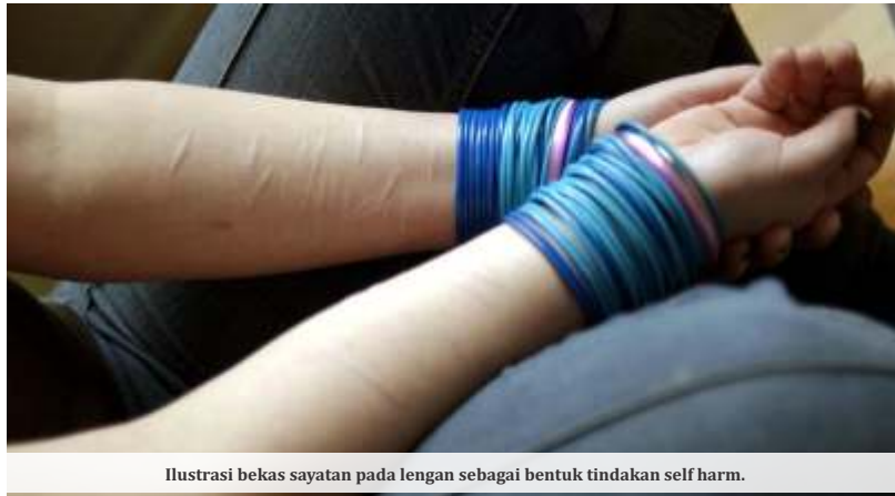
Ilustrasi bekas sayatan pada lengan sebagai bentuk tindakan self harm.

“Karena orang tua kadang juga sibuk sendiri. Sehingga, anak merasa