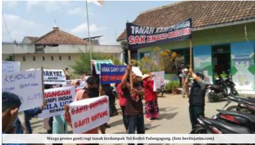
Warga protes ganti rugi tanah terdampak Tol Kediri-Tulungagung.

Nilai ganti rugi yang ditawarkan tersebut, 50 persen lebih kecil dari harga tanah yang berlaku di Panggungrejo Kabupaten