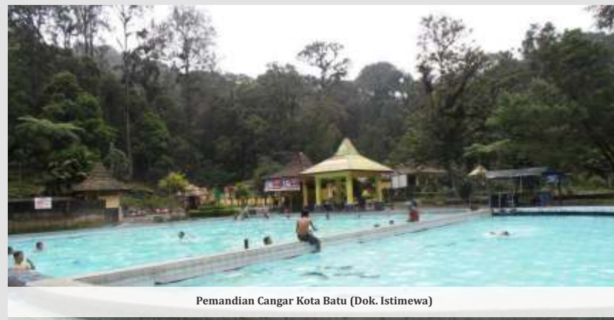
Pemandian Cagar Kota Batu (Dok. Istimewa)

"Semoga bersamaan dengan Hari Jadi Kota Batu ini bisa mengajak masyarakat untuk berkunjung ke Kota Batu. Kemarin juga sudah diberlakukan banyak diskon, dan kami