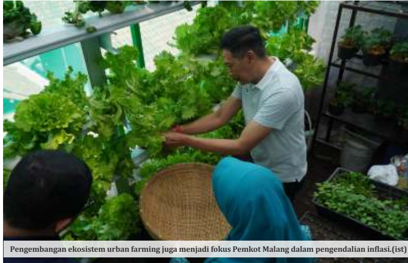
Pengembangan ekosistem urban farming juga menjadi fokus Pemkot Malang dalam pengendalian inflasi.

dari Badan Pusat Statistik (BPS) Kota Malang. Menunjukkan inflasi Kota Malang pada bulan September 2023 sebesar 0,18 persen, berada di bawah rata-rata Provinsi Jawa Timur dan nasional.