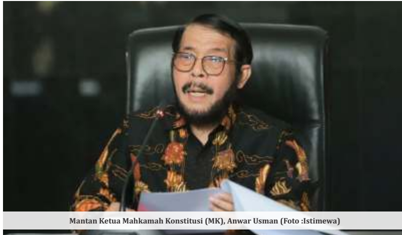
Mantan Ketua Mahkamah Konstitusi (MK), Anwar Usman