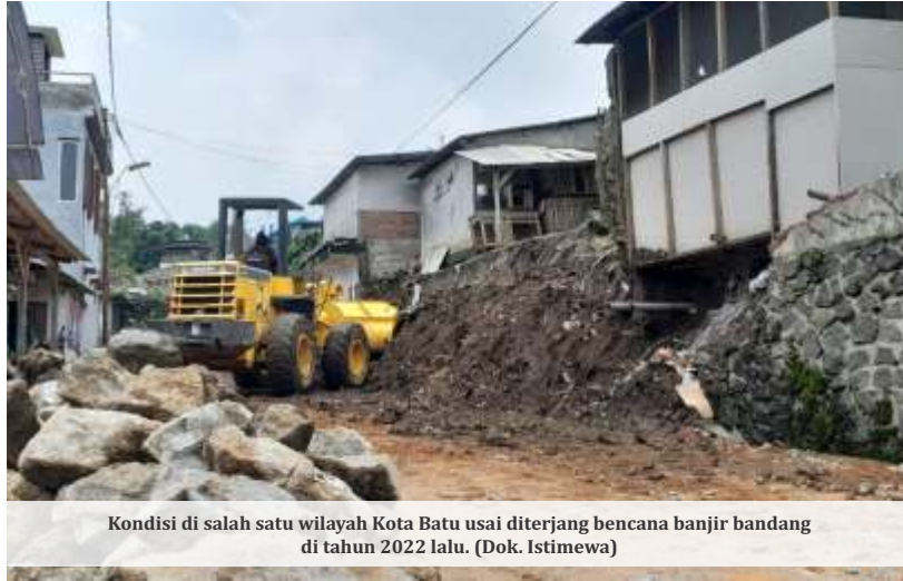
Kondisi di salah satu wilayah Kota Batu usai diterjang bencana banjir bandang di tahun 2022 lalu.