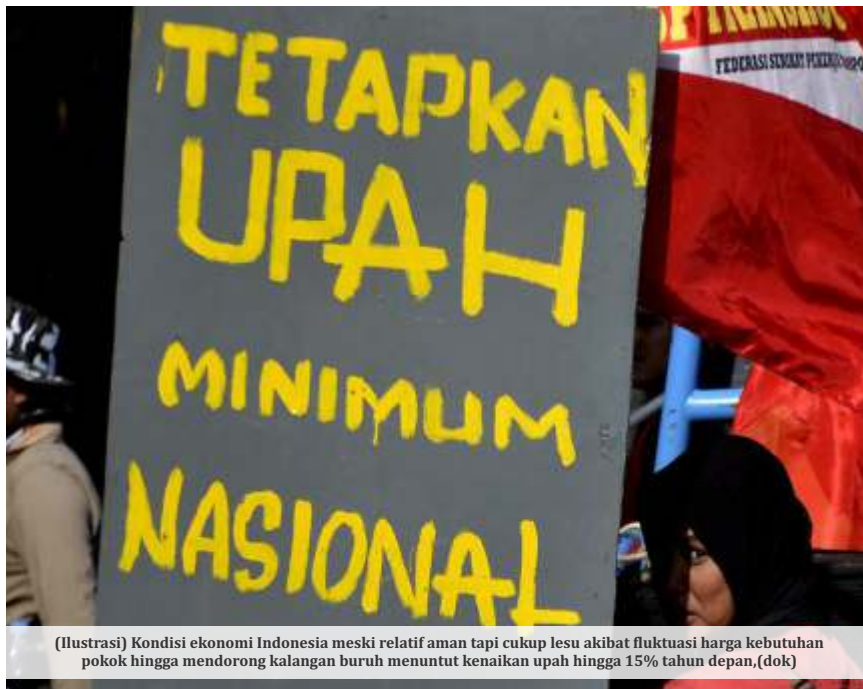
(Ilustrasi) Kondisi ekonomi Indonesia meski relatif aman tapi cukup lesu akibat fluktuasi harga kebutuhan pokok hingga mendorong kalangan buruh menuntut kenaikan upah hingga 15% tahun depan, (dok)

Sementara itu, pemerintah tetap mengalokasikan pinjaman secara neto minus. Dalam Perpres disebutkan, alokasi pinjaman yang berasal dari dalam dan luar negeri minus Rp 16,62