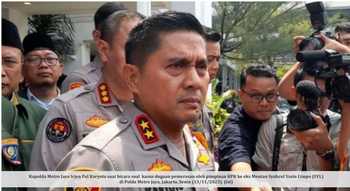
Kapolda Metro Jaya Irjen Pol Karyoto saat bicara soal kasus dugaan pemerasan oleh pimpinan KPK ke eks Mentan Syahrul Yasin Limpo (SYL) di Polda Metro Jaya, Jakarta, Senin (13/11/2023).

JAKARTA- Komisi Pemberantasan Korupsi (KPK) janji mengusut tuntas dugaan kepemilikan kartu anggota kasino di Malaysia milik Syahrul Yasin Limpo (SYL). Tanda keanggotaan itu diduga ditemukan saat penggeledahan yang dilakukan KPK di kediaman SYL.