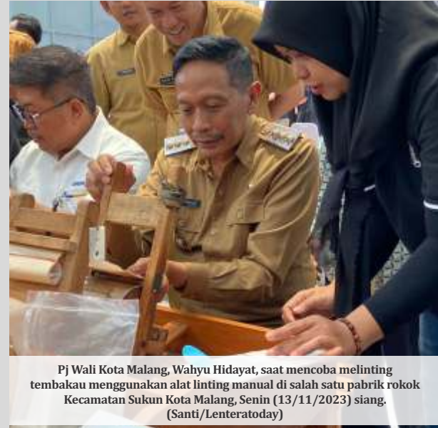
Pj Wali Kota Malang, Wahyu Hidayat, saat mencoba melinting tembakau menggunakan alat linting manual di salah satu pabrik rokok Kecamatan Sukun Kota Malang, Senin (13/11/2023) siang.

dikembalikan ke masyarakat khususnya para pekerja pabrik rokok. Mereka kita latih keterampilannya dan dari semua pabrik rokok di Kota Malang nanti akan kita libatkan semuanya, kita latih keterampilannya," tegasnya. (santi/dya)