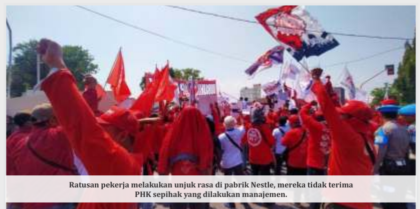
Ratusan pekerja melakukan unjuk rasa di pabrik Nestle, mereka tidak terima PHK sepihak yang dilakukan manajemen.

1. Karena hak dan kepentingan buruh harus sebagai prioritas.