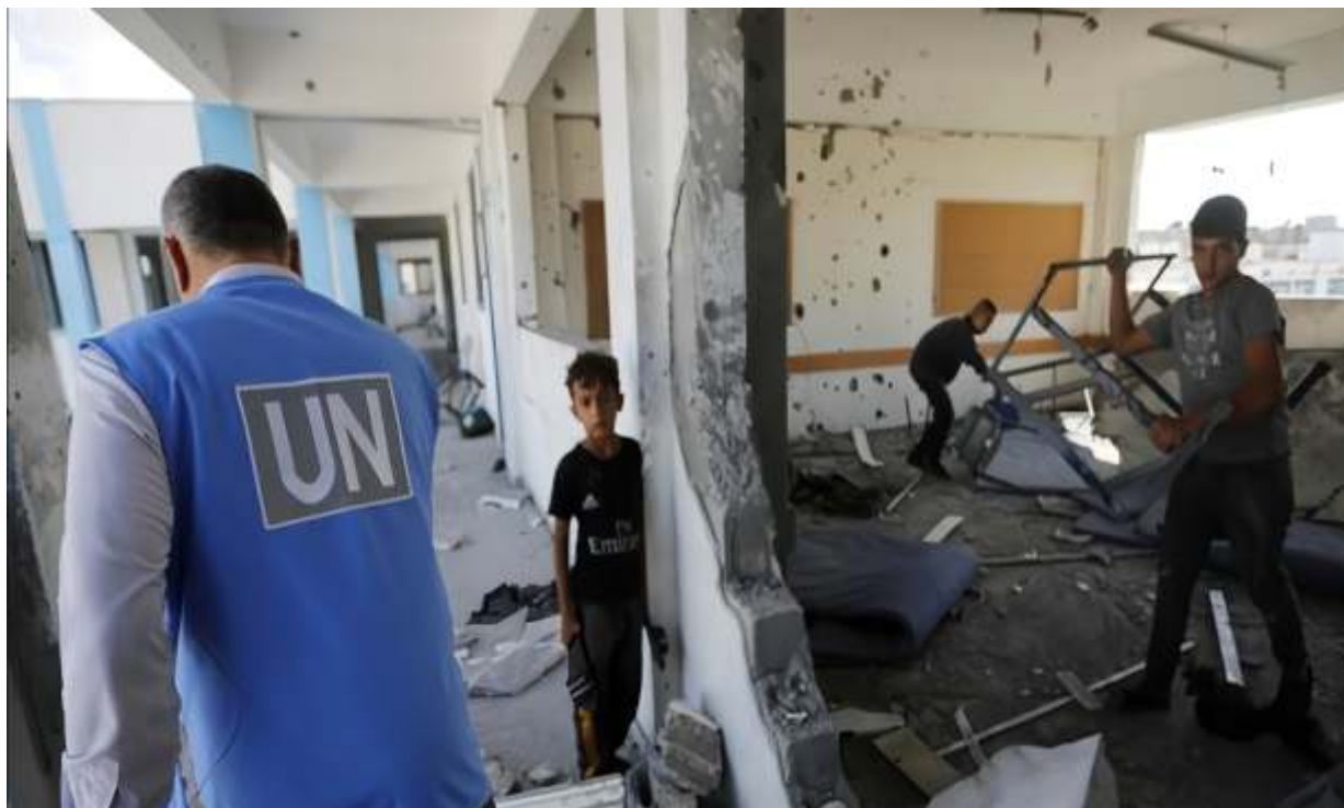
Israel menyerang sekolah al-Fakhoura milik PBB di kamp pengungsi Jabalia di Jalur Gaza utara yang menyebabkan sedikitnya 50 orang tewas, (MNA.ist)

JAKARTA -Presiden Joe Biden telah menulis dua surat berbeda mengenai perang Israel Hamas kepada warga Amerika Serikat. Surat ini ditujukan masing-masing kepada masyarakat pendukung Palestina dan Israel.