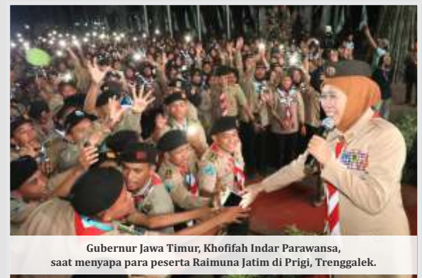
Gubernur Jawa Timur, Khofifah Indar Parawansa, saat menyapa para peserta Raimuna Jatim di Prigi, Trenggalek.

Untuk diketahui, Raimuna Jatim ini digelar selama lima hari, pada 16-21 November 2023. Sebanyak 34 kegiatan telah disiapkan untuk