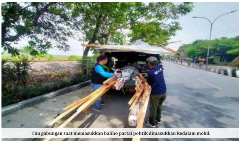
Tim gabungan saat memasukkan baliho partai politik dimasukkan ke dalam mobil.

Berbeda dengan alat peraga sosialisasi, alat peraga kampanye harus memenuhi tiga unsur kumulatif yakni visi dan misi, citra diri berupa foto, nomor urut, dan nama, serta ajakan. “Kalau tiga unsur tidak ada, hanya satu atau dua unsur saja, maka dikatakan alat peraga sosialisasi (APS). Kalau tiga unsur ini ada semua pada masa sebelum masa kampanye, maka dilakukan penertiban,” kata