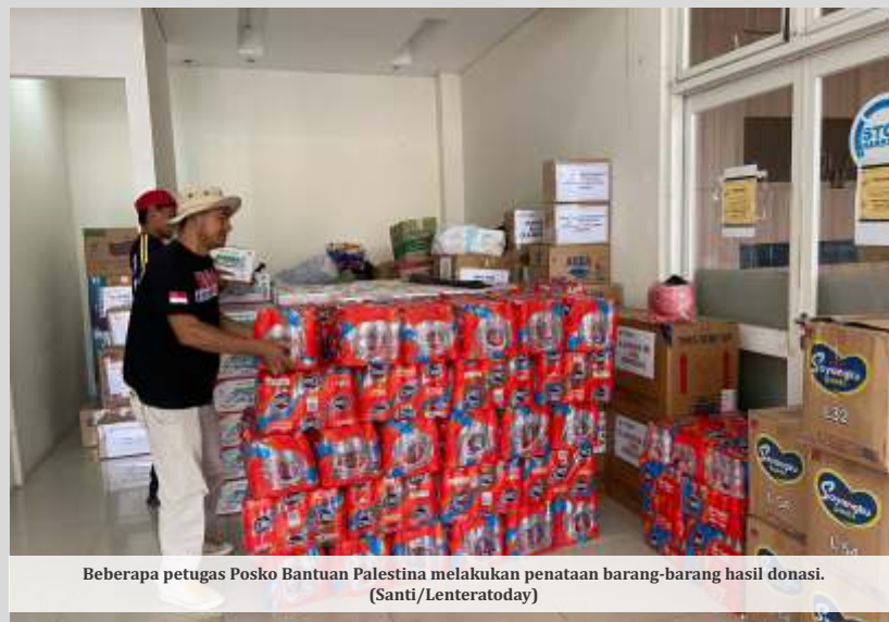
Beberapa petugas Posko Bantuan Palestina melakukan penataan barang-barang hasil donasi.

"Jadi masyarakat masih bisa menyalurkan bantuan. Jadi paling tidak, Selasa pukul 12.00 WIB, sudah kami maksimalkan untuk penerimaan bantuan. Selanjutnya biar kami bisa langsung packing karena ini sangat banyak. Karena Rabu paginya itu bantuan sudah kami berangkatkan ke (pelabuhan) Surabaya," ujar Wiwid, saat dikonfirmasi awak media, Minggu (19/11/2023).