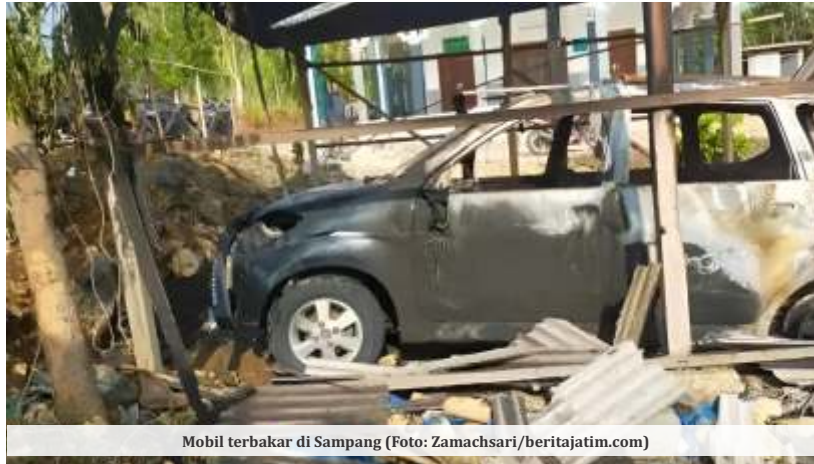
Mobil terbakar di Sampang

mengaku akan terus berupaya untuk mengungkap pembakaran mobil yang terjadi di wilayah Kecamatan Ketapang. "Korban yang kedua ini statusnya adalah pengusaha kayu dan mengaku tidak punya masalah dengan orang lain, tapi akan kita selidiki," ujarnya.