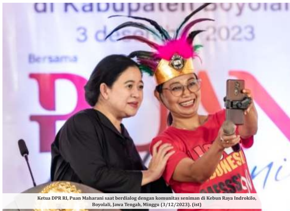
Ketua DPR RI, Puan Maharani saat berdialog dengan komunitas seniman di Kebun Raya Indrokilo, Boyolali, Jawa Tengah, Minggu (3/12/2023).

JAKARTA- Tagar #cawapres menjadi topik terpopuler di jagad sosial media setelah Komisi Pemilihan Umum (KPU) meniadakan debat khusus antar calon wakil presiden. Seperti diketahui, Komisi Pemilihan Umum (KPU) mengubah format Debat Cawapres pada gelaran Pilpres 2024.