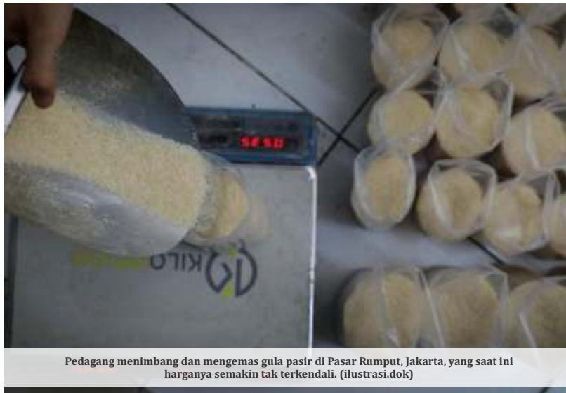
Pedagang menimbang dan mengemas gula pasir di Pasar Rumput, Jakarta, yang saat ini harganya semakin tak terkendali.