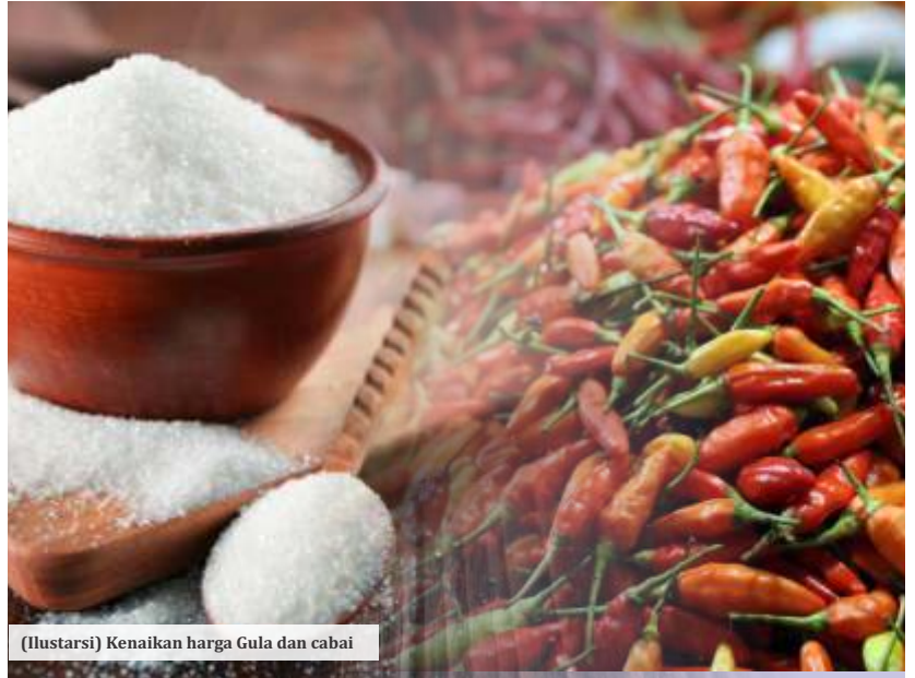
(Ilustrasi) Kenaikan harga Gula dan cabai

Menurut dia, kenaikan harga cabai rawit pada November lebih tinggi dibanding Oktober yang hanya 29,4 persen. Kenaikan harga cabai pada