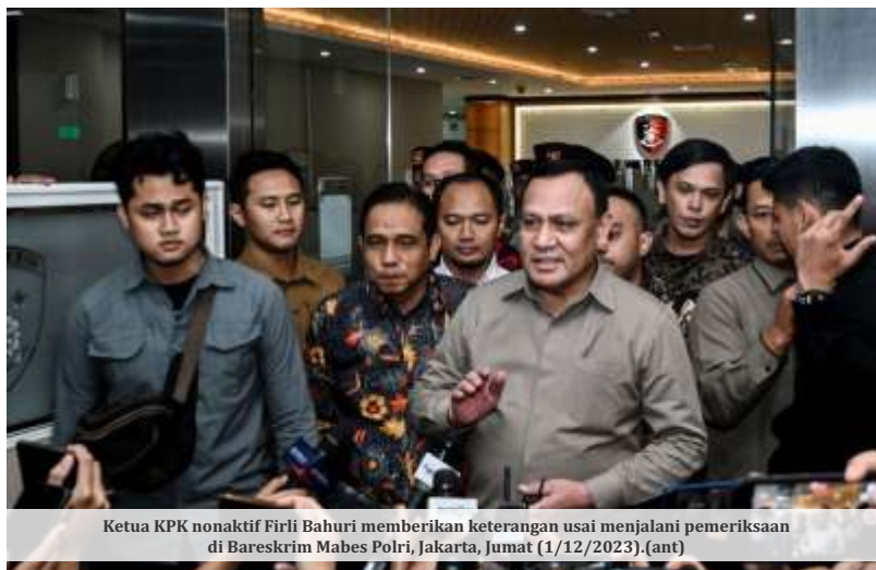
Ketua KPK nonaktif Firli Bahuri memberikan keterangan usai menjalani pemeriksaan di Bareskrim Mabes Polri, Jakarta, Jumat (1/12/2023).

Dia memastikan penyidik profesional, transparan dan akuntabel dalam melaksanakan tugas penyidikan. "Agar diingat bahwa alat bukti dalam Pasal 184 ayat 1 Undang-