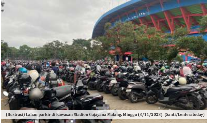
(Ilustrasi) Lahan parkir di kawasan Stadion Gajayana Malang, Minggu (3/11/2023).

Meski masih dalam tahap wacana, namun Jaya mengaku bahwa hal ini