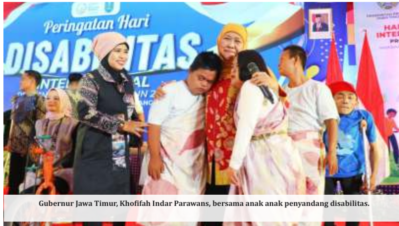
Gubernur Jawa Timur, Khofifah Indar Parawansa, bersama anak-anak penyandang disabilitas.

Sementara itu, Gubernur Jawa Timur, Khofifah Indar Parawansa menekankan bahwa pembangunan di Jawa Timur telah menuju inklusivitas. Hal ini dilakukan dengan berbagai program yang berfokus pada inklusi sosial ekonomi untuk para